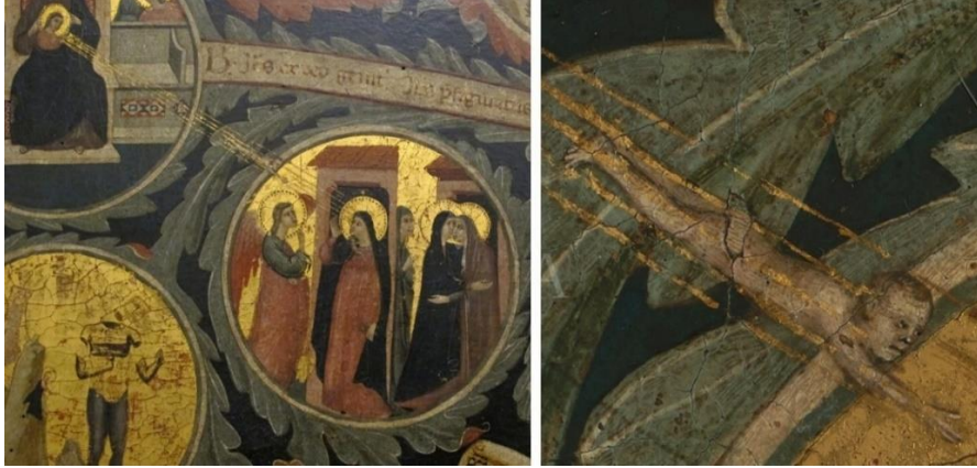
Fig.2-2a: Pacino di Buonaguida, Hayat Ağacı (Detay) Müjde,1310 – 1315, Ağaç Üzerine Tempera, (248x170 cm), Inv. 1890 n. 8459, La Galleria dell'accademia di Firenze, İtalya. 22

Müjde sırasında ruhun Meryem'e ulaşmasının çocuk formu ile betimlenmesine dair görsel gelenek, çocuk figürünün kurbanlık kavramı dolayısıyla Haç taşıyarak temsil edilmesi üzerinden gelişir ( Fig.2-2a; Fig.3-3a; Fig.4-4a ).