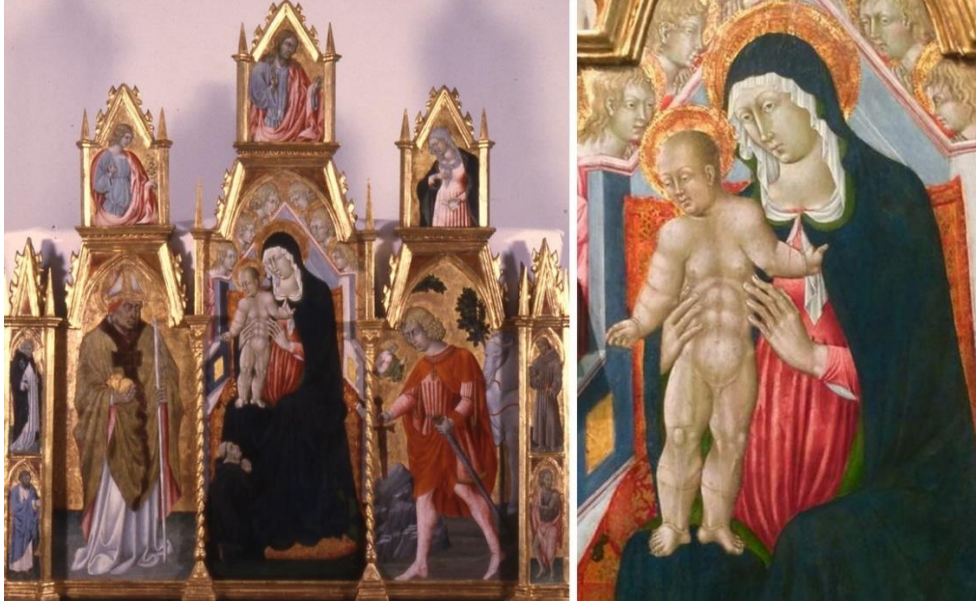
Fig.15: Giovanni di Paolo, Meryem ve Çocuk İsa ve Azizler , 1475-1480, Ahşap üzerine Tempera ve Altın Kaplama, Altar Panosu, (Tamamı 202 x 197 x 4.4 cm, Orta panel 136.5 x 54.7 cm), The Walters Art Museum, Baltimore, USA. 79

Çocuk, annesi ile bedensel bir iletişimde bulunmaz. Bu noktada annenin hizmet ettiği konum, Maesta programına benzer biçimde Kutsal Çocuğu sunan aracı ve taşıyıcı anne olarak yorumlanabilir. Benzer bir noktada, Siena ekolünün örneklerinden biri olan, Giovanni di Paolo (1403-1482) imzalı altar panosundaki örnek, Çocuğu yetişkin bedeni, yetişkin yüzü ve annesinin kucağında ayakta dururken betimler. (Fig.15) Bu örnek, iki figürü birbirinden ayırmaz. Anne hala çocuğunu tutmakta ve çocuk da sol eli ile annesinin yakasından yakalamaktadır. Bu temsil biçiminin dünyasal bir anne ve oğul ilişkisi halinde değişimi daha sonra Yüksek Rönesans döneminde gerçekleşir 78 .