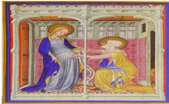
Fig.5: Narbonne Paremont Ustası, Ziyaret, Tres Belles Heures of Notre-Dame de Jean de Berry , y.1380, (28x20 cm), Aydınlatılmış El Yazması, MS Nouvelle Acquisition Latine 3093, fol. 28, Bibliotheque Nationale

Doğum aşamasına hazır bedene sahip çocuk figürünün Müjde sırasında Meryem'e ulaşması temsili, Aquinas'ın geliştirdiği ruh teorisine de temellenerek Meryem'in hamilelik sürecindeki materyal katkısını dışlar. Benzer bir noktada, Meryem'in hamilelik sürecini dışlayarak, rahimdeki çocuğun gelişkin olarak kabulüne dair diğer bir görsel formül, Meryem'in Elizabeth'i Ziyareti sahnesinde, gebeliklerin arasında altı aylık süre olmasına 25 ve Meryem'in Müjde'yi almasının üzerinden sadece günler geçmiş olmasına rağmen 26 (yaklaşık 4-5 gün), fiziksel görünüşünün tamamlanmış bir gebelik sürecini işaret etmesi üzerinde şekillenir. Yaklaşık 1380 yılına tarihlenen Les Très Belles Heures de Notre-Dame Dua Kitabı 'na ait Ziyaret sahnesini gösteren aydınlatılmış el yazması örneği, Meryem'i hamileliğinin ortalama üçüncü evresinde betimler. (Fig.5) Gebeliklerin paralel olarak kavranmasına dair diğer bir dikkat çekici örnek ise Middle Rhine Altar Panosunda bulunan Ziyaret sahnesinde yer alır (Fig.6). Benzer örneklerine sıkça rastlanabileceği üzere, kadınların hamilelikleri açık bir mandorla içindeki yetişkin bebek figürleri ile tanımlanır. Burada açıkça işaret edilmek istenen İsa'nın kusursuz insanlığına dair teorinin ilanidir.