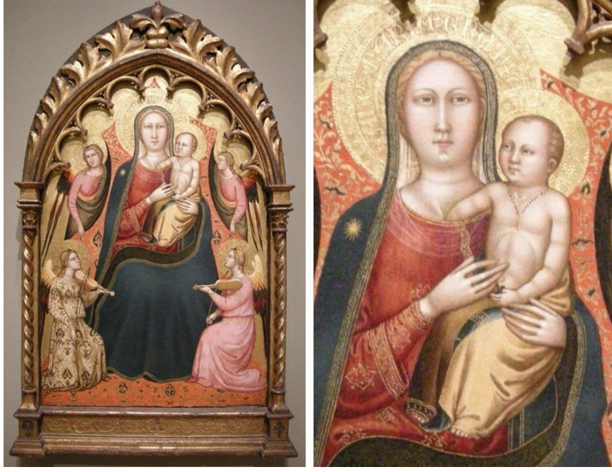
Fig.13: Lorenzo di Bicci, Meryem ve Çocuk İsa Meleklerle , 14.yy, Ahşap Üzerine Tempera ve Altın Kaplama, Panel, (81,3 x 54,3 cm), Fine Arts Museums of San Francisco (FAMSF), USA. 75

Böylelikle Çocuk İsa'nın bir homunculus formu ile betimlenmesine dair örnekler, beden gelişkinliğine, güçlülüğüne ve insan üstü özelliklerine odaklanarak devam eder. Ferrera'ya (1441-1461) ait örnek, Çocuk İsa'yı geleneğe uygun olarak annesinin kucağından uzağa yerleştirir. (Fig.14) Bu bedensel mesafe, Schiller tarafından Doğum sahnelerindeki anne ve bebeğin arasına giren bedensel mesafenin yorumlanması bağlamında ele alınabilir. 76 Bedensel olarak artık kucaklanmayan Oğul, Kutsal Çocukluk ile, bireysel olarak ayakta durur, sol elinde evrenin küresini tutar ve sağ eliyle takdis işareti yapar biçimde, kitabın da yerleştirildiği bir platformun üzerindedir. Çocuk İsa, portrecilik bağlamında doğrudan çocuksu niteliklerle betimlenirken, bedeninde işaret edilen kas grupları, yetişkinliğe vurgu yapar.