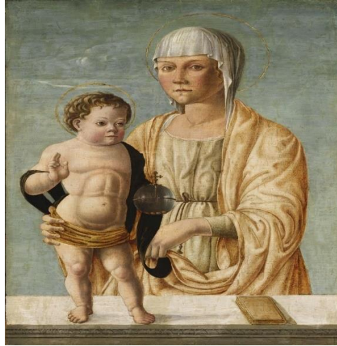
Fig.14: Bono de Ferrara, Meryem ve Çocuk İsa , y.1450, Ahşap Üzerine Tempera, (74,1 x 50,4 cm), Inv.No:1030, Museum of Fine Arts Budapest, Macaristan. 77

Böylelikle Çocuk İsa'nın bir homunculus formu ile betimlenmesine dair örnekler, beden gelişkinliğine, güçlülüğüne ve insan üstü özelliklerine odaklanarak devam eder. Ferrera'ya (1441-1461) ait örnek, Çocuk İsa'yı geleneğe uygun olarak annesinin kucağından uzağa yerleştirir. (Fig.14) Bu bedensel mesafe, Schiller tarafından Doğum sahnelerindeki anne ve bebeğin arasına giren bedensel mesafenin yorumlanması bağlamında ele alınabilir. 76 Bedensel olarak artık kucaklanmayan Oğul, Kutsal Çocukluk ile, bireysel olarak ayakta durur, sol elinde evrenin küresini tutar ve sağ eliyle takdis işareti yapar biçimde, kitabın da yerleştirildiği bir platformun üzerindedir. Çocuk İsa, portrecilik bağlamında doğrudan çocuksu niteliklerle betimlenirken, bedeninde işaret edilen kas grupları, yetişkinliğe vurgu yapar.