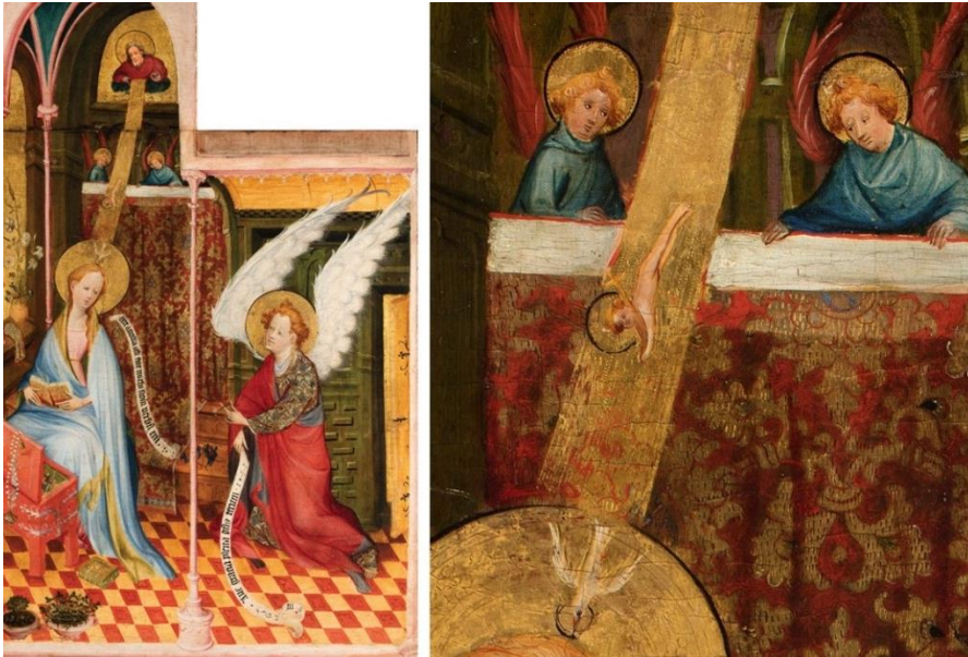
Fig.3-3a: (Detay) Müjde, 1405-1415, Middle Rhine Altar Panosu (74,5x60 cm), Köln Üretimi, Ağaç Üzerine Tempera, Utrecht Catharijneconvent Müzesi, Utrecht, Hollanda. 23