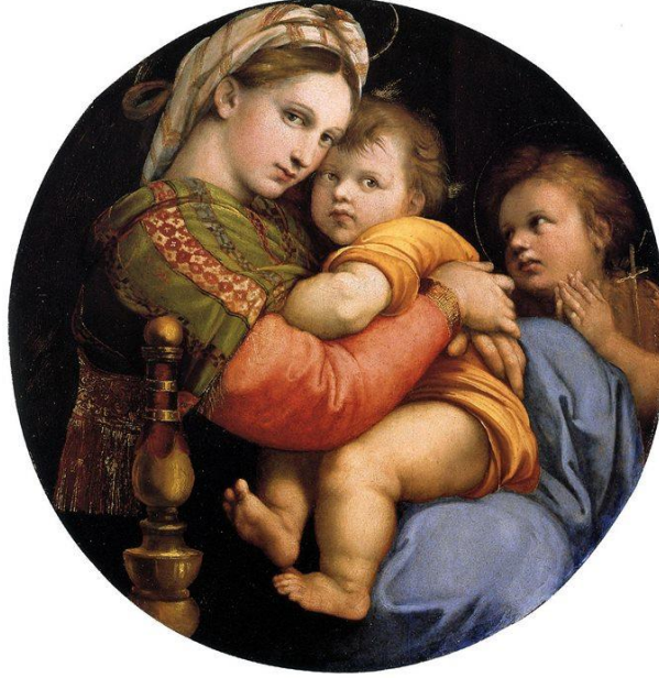
Fig.16: Raffaello Sanzio da Urbino, Madonna della Seggiola , Ağaç Üzerine Yağlı Boya, (Çap:71 cm), Galleria Platina (Plazzo Pitti), Floransa, İtalya. 80