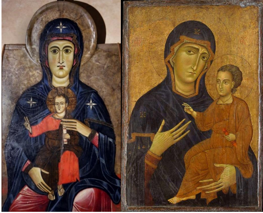
Fig.10: Bigallo Ustası, Meryem ve Çocuk İsa Hodegetria (Yol Gösteren Meryem) Modeli , 1225, Ahşap Panel, Fiesole Katedrali, San Romolo, Toskana, İtalya. 65