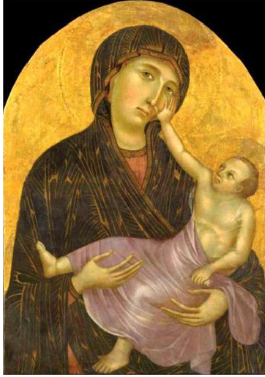
Fig.12: Cenni de Pepo (Cimabue), Meryem ve Çocuk İsa Eleoussa (Merhametli Meryem) Modeli ,13.yy, İkon,Ahşap Üzerine Tempera (69 x51 cm.) Santa Verdiana Müzesi, Castelfiorentino Komünü, Floransa, İtalya. 69