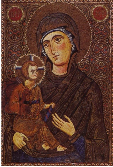
Fig.9: Meryem ve Çocuk İsa Hodegetria (Yol Gösteren Meryem) Modeli , 1200, İkon, Ağaç Üzerine Mozaik, (44,6 x 33,5 cm), St. Catherine Manastırı Müzesi, Sinai, Mısır. 63

Sinai örneğinde, Çocuk İsa'nın saç ve kaş çözümü ve tipolojisi yetişkinliği imlediği gibi, annesi ile paralel olarak betimlenmiş boyun çizgileri dikkat çekici bir işaretçidir. İkon, Meryem'i, kafasının iki yanında yer alan madalyonlar içinde yer alan MP ΘY monogramları ile Tanrı Anası olarak tanımlar. İsa'nın tanrısal ve insani doğasının bir arada işaret edildiğine dair en belirgin gösterge, Tanrı Anası'nın çocuğunu sağ eli ile sıkıca kavramasında gözlemlenebilir. Geleneksel Hodegetria'nın aksine, sağ kolunu kullanarak çocuğu desteklemesi de ona Dexiokratousa (Sağ el ile destekleyen) unvanını kazandırır. 64