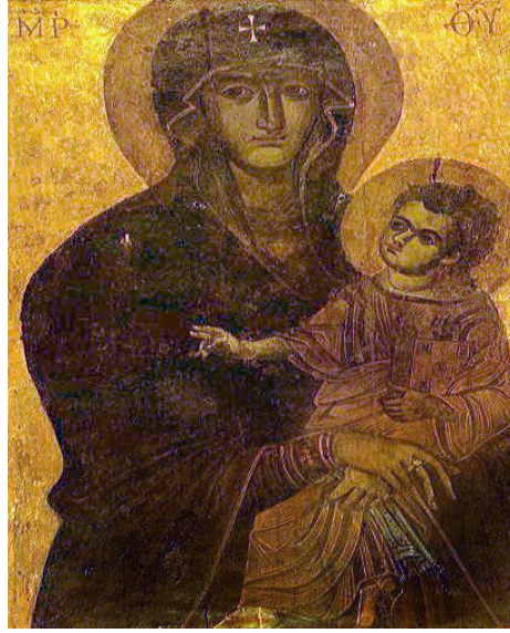
Fig.8: Salus Populi Romani (Meryem ve Çocuk İsa), 5.yüzyıl, Ahşap Üzerine Tempera, (117 x 79 cm), Saint Mary Major (Basilica di Santa Maria Maggiore) Basilikası, Borghese Şapeli, Roma, İtalya. 62

Örnekte, Tanrı Anası Meryem'in kucagında oturan Çocuk İsa figürü, filozof tipolojisine uygun, kaş ve saç detayları dolayısıyla yetişkin bir bedensel gelişime sahip olarak betimlenir. Sol eli ile kitap tutarken sağ eliyle takdis işaretini yapar ve burada da bedensel hakimiyetindeki yetişkinlik niteliği işaret edilmiş olur. Benzer ve daha belirgin işaretlerin olduğu diğer bir örnek ise 1200 yılına tarihlenen Sinai ikonunda yer alır. (Fig.9)