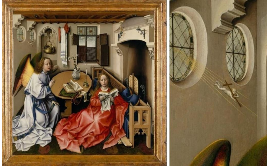
Fig.4-4a: Robert Campin , Merode Altarı Triptik, (Detay) Müjde, 1427-32, Tournai üretimi, (Toplam: 64,5x117,8 cm. Orta panel: 64,1 x 63,2 cm.), Cloisters 56.70a-c, The Metropolitan Museum of Art, NY, United States. 24

Doğum aşamasına hazır bedene sahip çocuk figürünün Müjde sırasında Meryem'e ulaşması temsili, Aquinas'ın geliştirdiği ruh teorisine de temellenerek Meryem'in hamilelik sürecindeki materyal katkısını dışlar. Benzer bir noktada, Meryem'in hamilelik sürecini dışlayarak, rahimdeki çocuğun gelişkin olarak kabulüne dair diğer bir görsel formül, Meryem'in Elizabeth'i Ziyareti sahnesinde, gebeliklerin arasında altı aylık süre olmasına 25 ve Meryem'in Müjde'yi almasının üzerinden sadece günler geçmiş olmasına rağmen 26 (yaklaşık 4-5 gün), fiziksel görünüşünün tamamlanmış bir gebelik sürecini işaret etmesi üzerinde şekillenir. Yaklaşık 1380 yılına tarihlenen Les Très Belles Heures de Notre-Dame Dua Kitabı 'na ait Ziyaret sahnesini gösteren aydınlatılmış el yazması örneği, Meryem'i hamileliğinin ortalama üçüncü evresinde betimler. (Fig.5) Gebeliklerin paralel olarak kavranmasına dair diğer bir dikkat çekici örnek ise Middle Rhine Altar Panosunda bulunan Ziyaret sahnesinde yer alır (Fig.6). Benzer örneklerine sıkça rastlanabileceği üzere, kadınların hamilelikleri açık bir mandorla içindeki yetişkin bebek figürleri ile tanımlanır. Burada açıkça işaret edilmek istenen İsa'nın kusursuz insanlığına dair teorinin ilanidir.