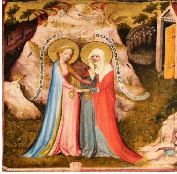
Fig.6: (Detay) Ziyaret, 1405-1415, Middle Rhine Altar Panosu (74,5x60 cm), Köln Üretimi, Ağaç Üzerine Tempera, Utrecht Catharijneconvent Müzesi, Utrecht, Hollanda. 28