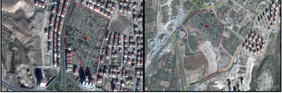
Şekil 2. Taşlıbel mezarlığı planı (solda), Kaldırım mezarlığı planı (sağda)

Güzelyurt mahallesinde yer alan Taşlıbel Mezarlığı 83 ha büyüklüğündedir. Mehmet Akif Ersoy mahallesinde yer alan Kaldırım Mezarlığı ise 170 ha büyüklüğündedir (Şekil 2).