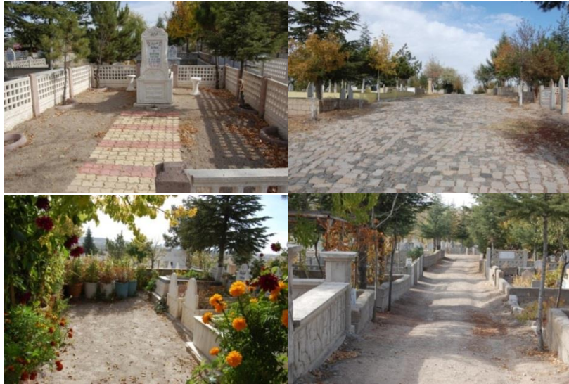
Şekil 8. Mezarlıklarda zeminlerin durumu

kaplaması yapmıřlardır. Ancak özellikle Kaldırım Mezarlıđı iinde, ara yollarda tozlu, kendi haline bırakılmıř, döşemesiz zeminler halen mevcuttur (Şekil 8).