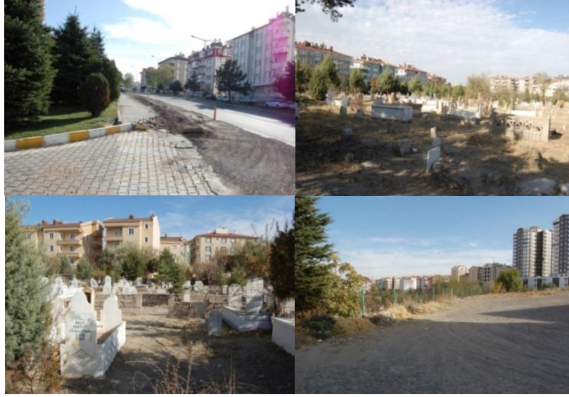
Şekil 4. Taşlıbel mezarlıęı çevresel durumu

Nevşehir merkez rakımı 1224 m iken, Kaldırım mezarlıęı ise 1320 m yükseklikte, kentin güneyinde, yapılaşmanın büyük ölçüde azaldıęı bir alanda yer almaktadır. Bulunduęu çevreye hakim bir tepede bulunan mezarlık, günümüzde güneye doğru uzanarak gelişme göstermektedir. Ana giriş kapısı kuzey yakasında yer almakta, Nevşehir Şehitlięi ile