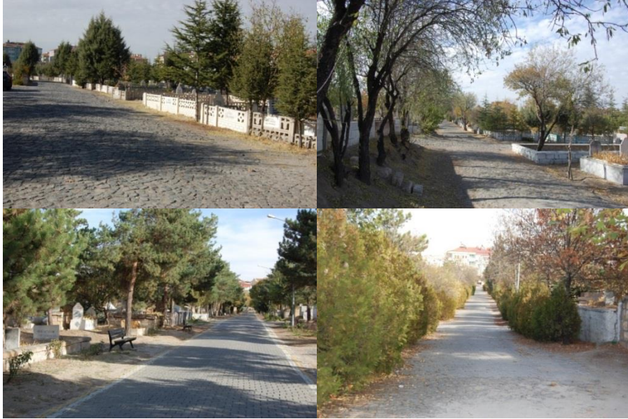
Şekil 6. Taşlıbel mezarlığı ulaşım ağı oldukça net bir yapı sergilemektedir

Taşlıbel mezarlığı içinde ana giriş ve ona bağlanan ikincil giriş güzergahı ana güzergahtır. Bir de doğu yönünden gelen bir başka giriş güzergahı mevcuttur. Diğer yollar ise aksi yönden bu yollara dik bağlanmaktadır. Genel olarak yol sistemi kuvvetli bir yönlendirme sağlamaktadır. Ana giriş yolunda banklar ve çeşmeler mevcuttur. Bu yol üzerinde alle bitkilendirme yapılmıştır. Tali yollarda da alle tekniği kullanılmıştır. Mezarlık içinde kaldırıma yer verilmemiştir (Şekil 6).