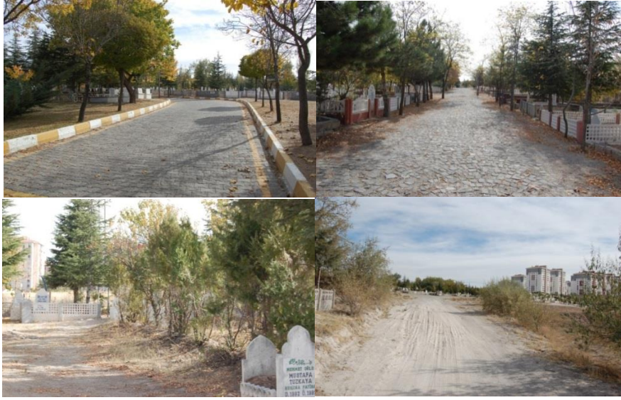
Şekil 7. Kaldırım mezarlıđında yolların durumu