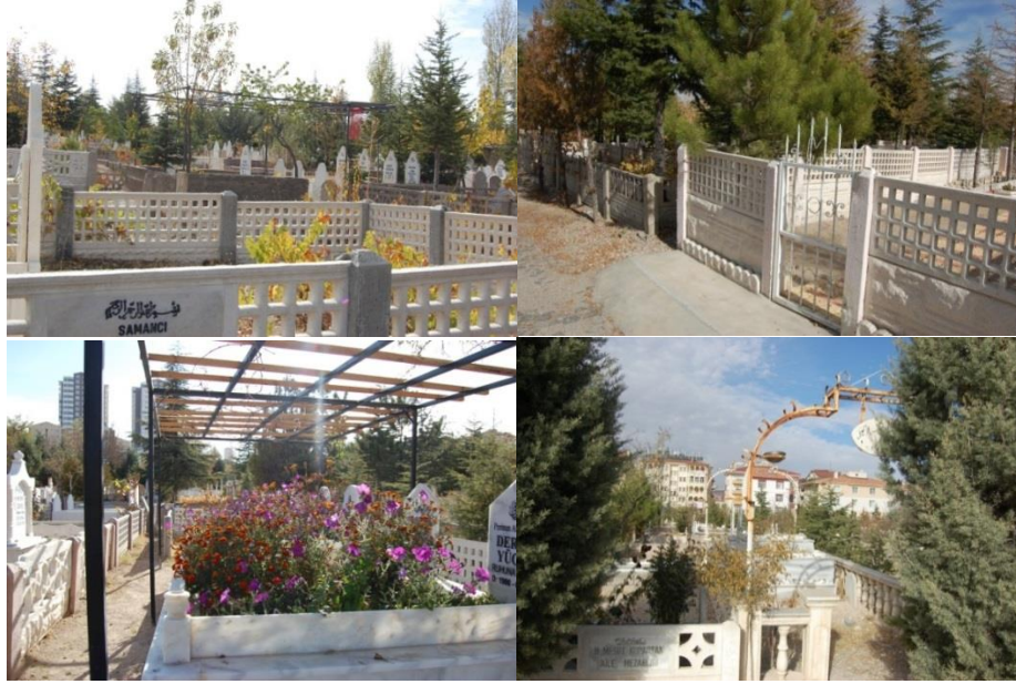
Şekil 11. Mezarlıkların çok renkli donatı durumu