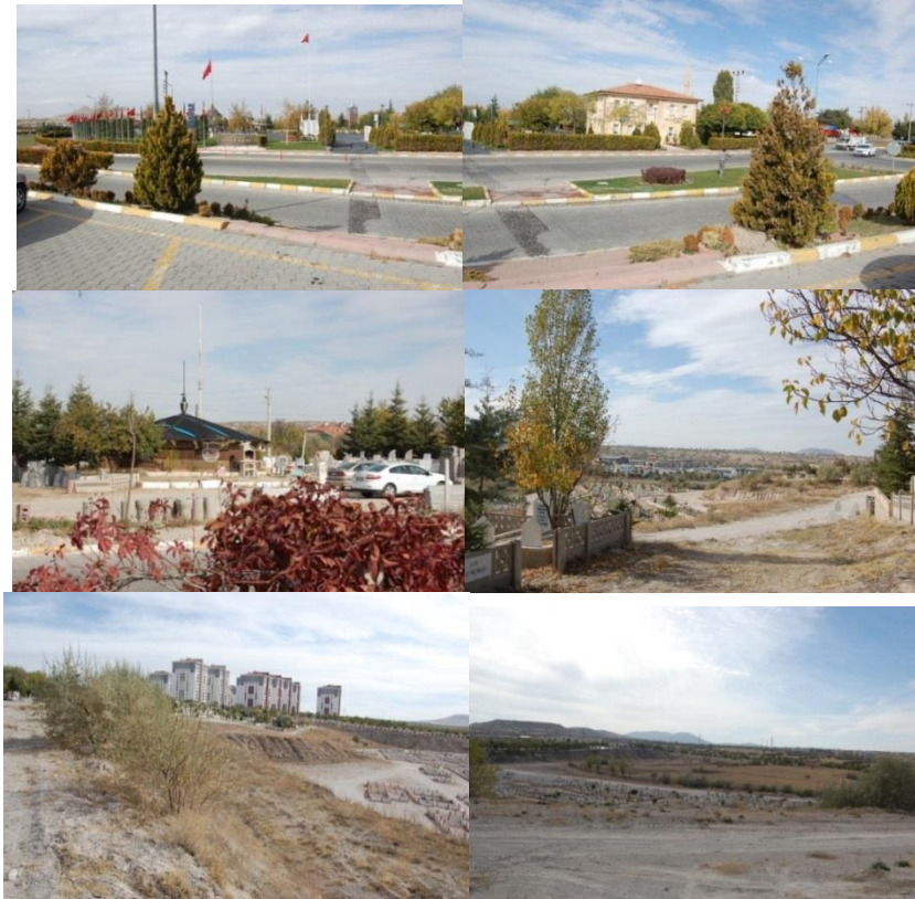
Şekil 5. Kaldırım mezarlıęı çevresel durumu

karşılıklı konumlanmaktadır. Bu girişte, Nevşehir mezarlıklar Müdürlüęü, İtfaiye, Cami ve Gasil hane yer almaktadır. Mezarlığın belirgin bir başka girişi yoktur, ancak güney yaka boyunca sınırlandırma yapılmamış, bu yakanın alt kotunda yer alan yeni kısım ise bugün için henüz tamamlanmamış ve sınırlandırılmamıştır (Şekil 5).