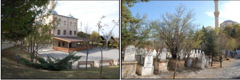
Şekil 3. Her iki mezarlıkta da cami ve ona bağlı kullanımlar bulunmaktadır.

bir konumda yer almış, nispeten daha küçük bir avlu düzenlemesi gerçekleştirilmiştir. Bu camide avlu etkisi kısıtlanmış, mezarlık parselleri arkasında kalmıştır (Şekil 3). Ayrıca Nevşehir Mezarlıklar Müdürlüğü de kaldırım mezarlığı girişinde yer almaktadır.