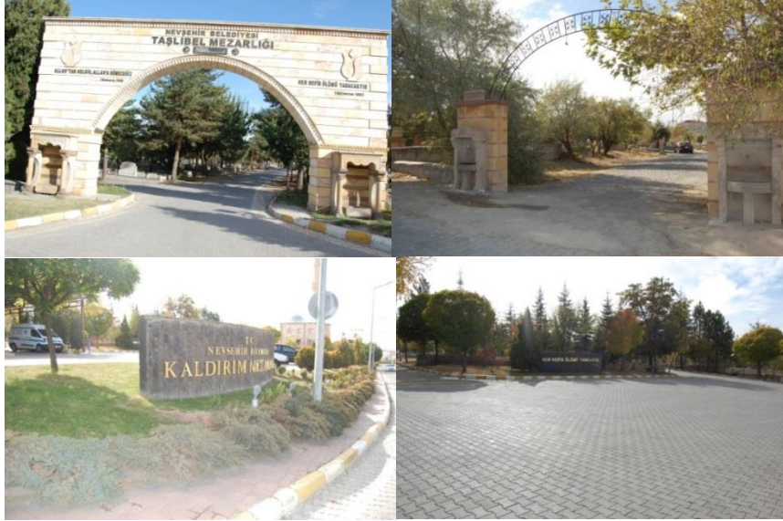
Şekil 10. Giriş kapısı düzenlemeleri

ön avlu ile giriş düzenlemesine yer verilmiştir. Zeminde yer verilen ışıklandırılmış taş duvar düzenlemesi ile mezarlık adı tabelası tanzim edilmiştir (Şekil 10).