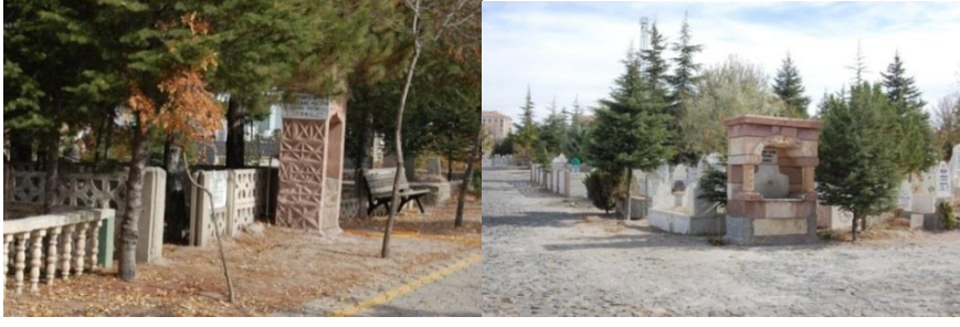
Şekil 9. Çok sayıda çeşme hayrat olarak mezarlıkların her yerinde gözlemlenebilir

Taşlıbel Mezarlığında her üç giriş kapısı da düzenlemiştir ve ana giriş kapısına daha fazla özen gösterilmiştir. Canlı ve cansız materyallerle giriş vurgulanmıştır. Kaldırım mezarlığında ise, geniş bir