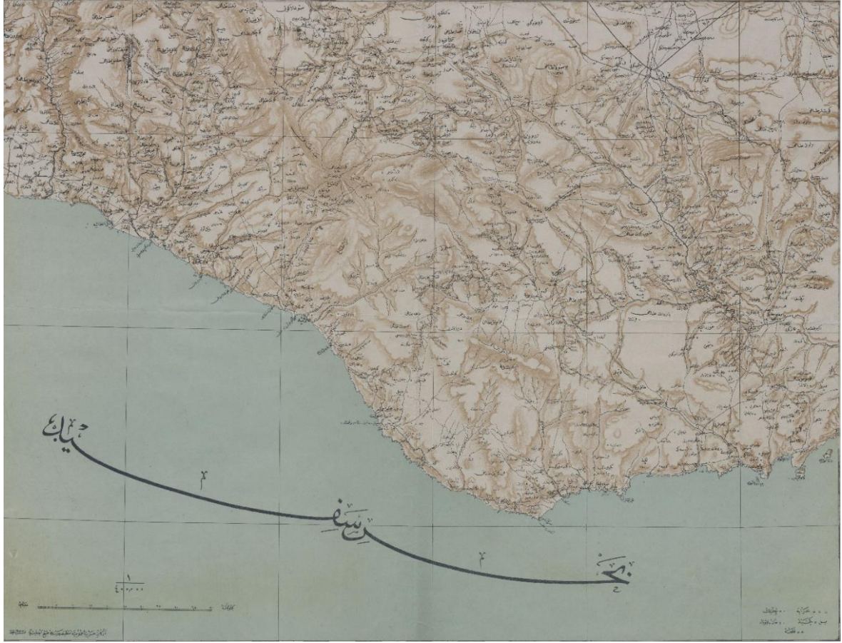
Şekil 1. Alâiye ve Çevresinin Haritası (13 Mart 1916)