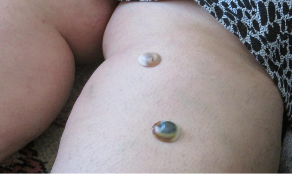
1- Yılcık Ocağında Yılcık Taşı ile Tedavi