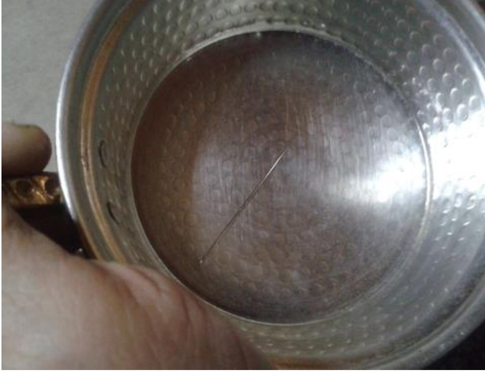
9-İğne Atılan Su ile Nazar Tedavisi