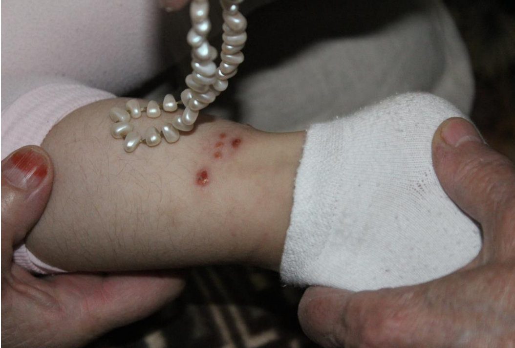
6- İncili Tutma Ocağında İnci ile Hastalık Tedavisi