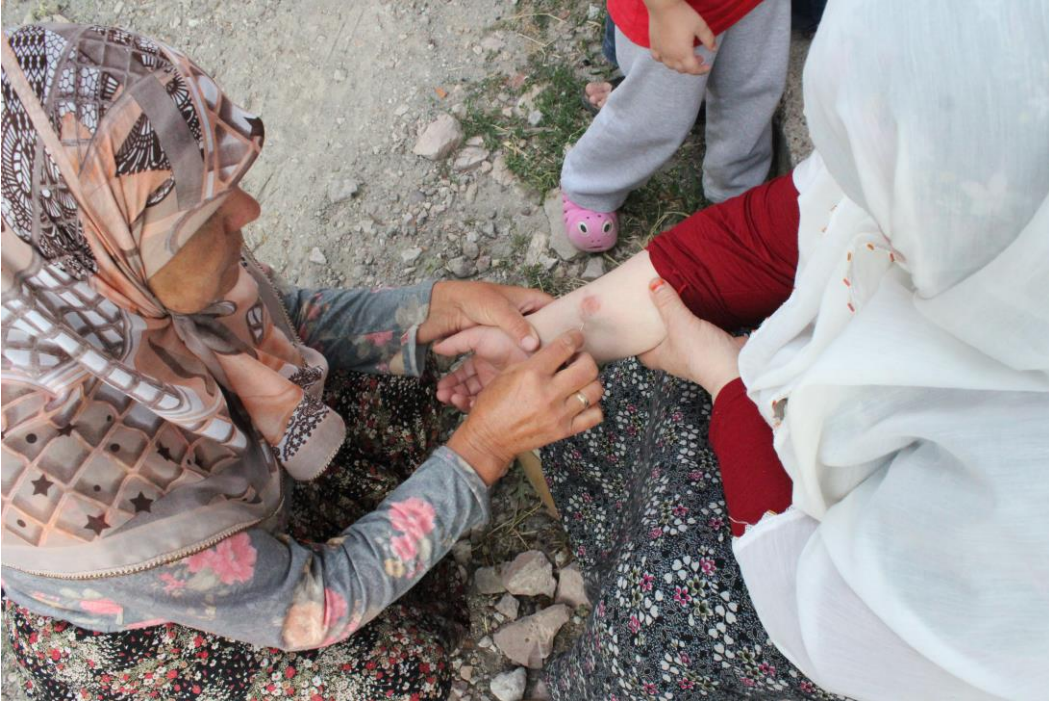
8- İğne ile Temre Tedavisi