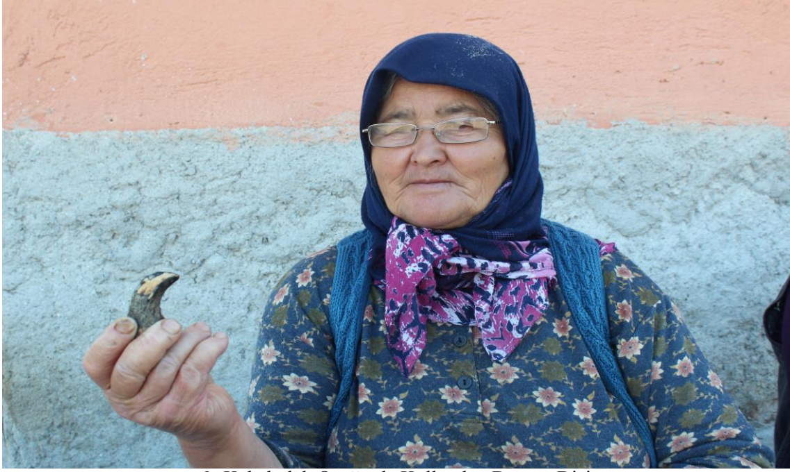
3- Kabakulak Ocağında Kullanılan Domuz Dişi