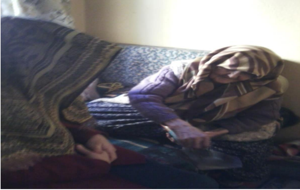
2- Tuz Patlatma Ocağında Nazar Tedavisi