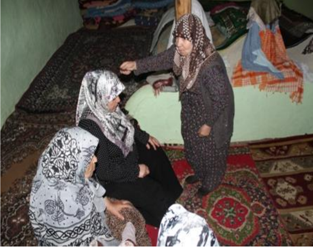
5-Azizdede Türbesinde Demir ile Nazar Tedavisi