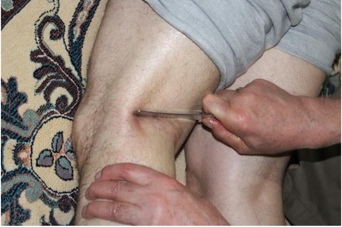
11- Bıçak ile Yel Kesme Tedavisi