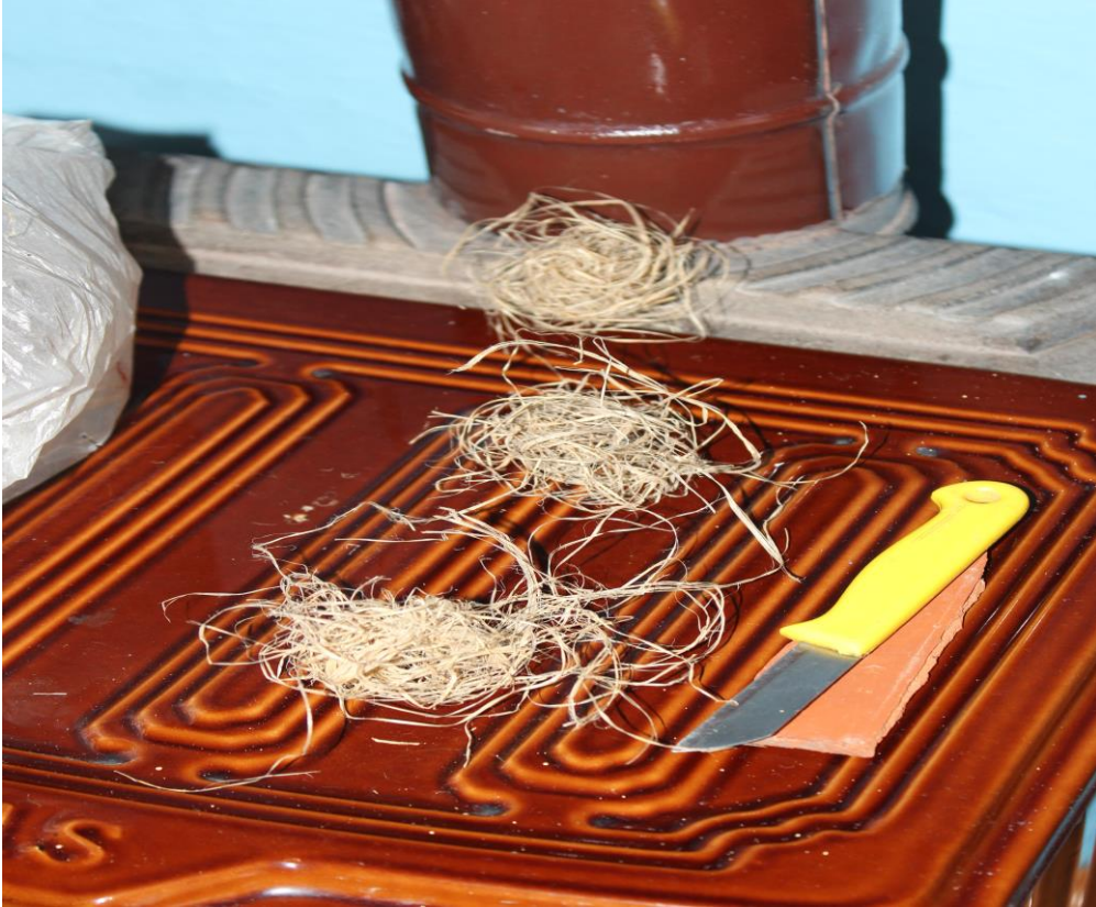
4- Örtleme Tedavisinde kullanılan kendir, bıçak ve kiremit