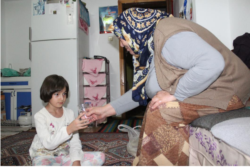
7-Kül ile Korkuluk Çıkartıldıktan Sonra Hastaya Ocaklı Elinden Su içirilmesi