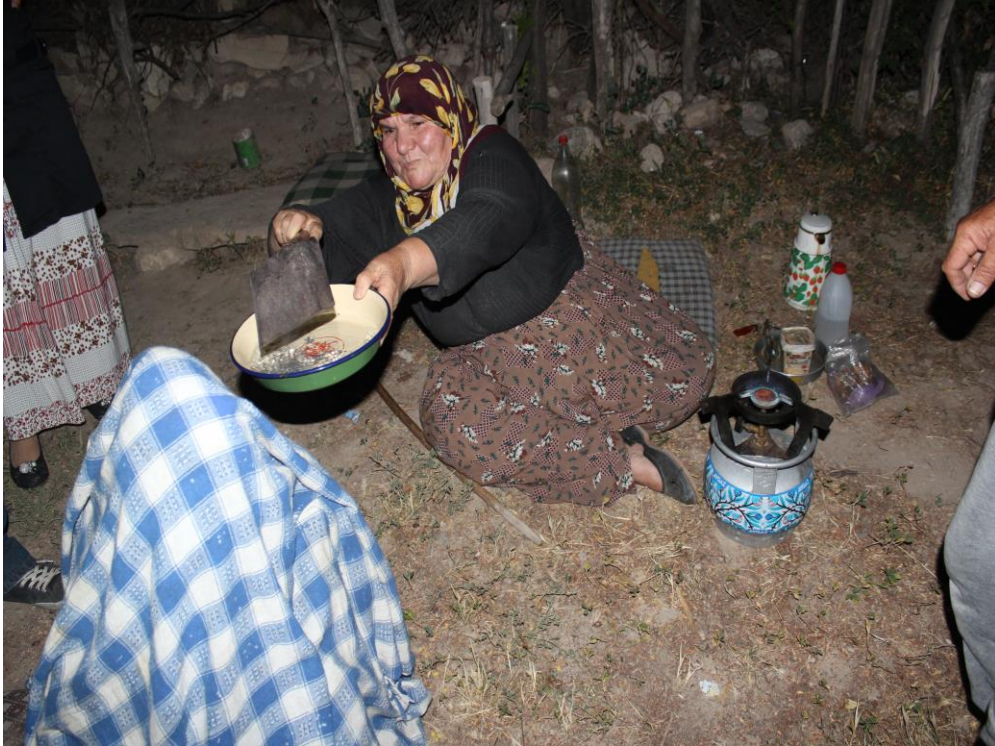
10- Kurşun Dökme Ocağı