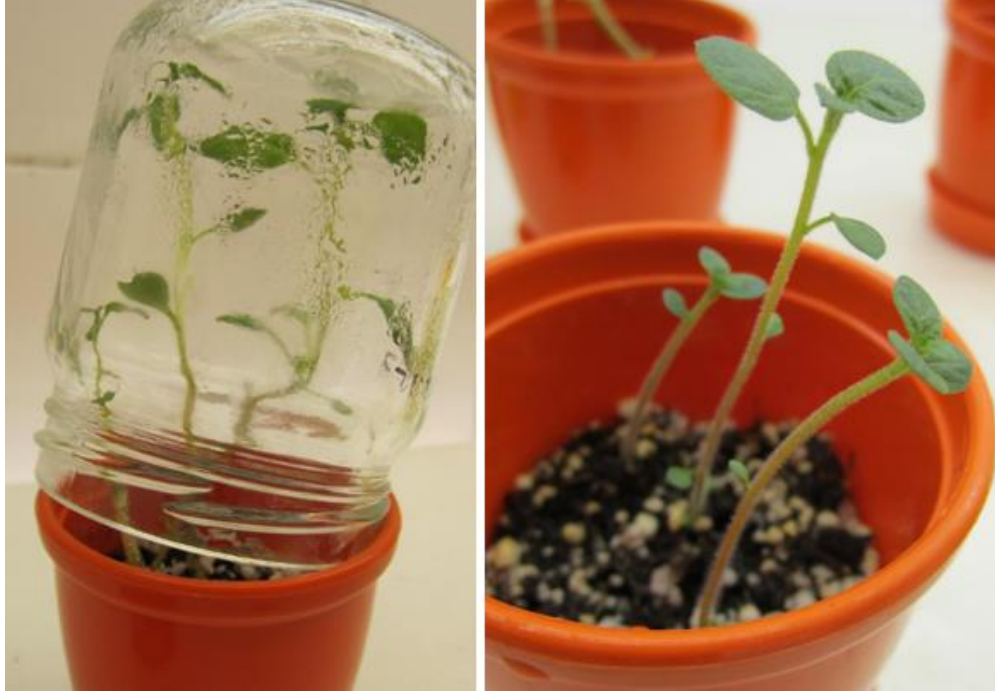
Şekil 3. Saksılara dikilen in vitro yumrulardan gelişen bitkiciklerin dış koşullara alıştırılması ve mikrotuberlerden oluşan 3-4 haftalık bitkiler.