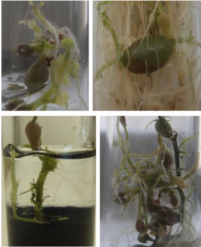
Şekil 2. FY (Karanlık, %0.2 AC+ %0.5 agar içeren) ortamında oluşan mikrotuberler.

Denemelerdeki ortam bileşimi ve fotoperiyot ile mikrotuber ağırlığı arasındaki ilişkinin önemli olduđu görölmektedir (p<0.05). Mikrotuber ağırlığı bakımından en yüksek deđerler sırasıyla FY (Karanlık, % 0.2 AC, %0.5 Agar) (183 mg) ve FX (Kısa gün, %0.2 AC, %0.5 Agar) (127 mg) gruplarında elde edilmiştir (Şekil 2). Bu sonuca göre sadece aktif kömür (AC) katılmış besin ortamlarının tuber ağırlığını artırıcı yönde etkisi olduđu tespit edilmiştir. Tek başına fotoperiyot, mikrotuber ağırlığı üzerinde etkili olarak gözlemlenmemiştir. Denemede en yüksek mikrotuber verimi (%137) ve en yüksek ortalama mikrotuber ağırlığı (183 mg); %0.2 AC ve %0.5 agar içeren çift fazlı MS ortamında ve karanlık inkübasyon koşullarında elde edilmiştir. Şekil 2'de denemelerde olumlu sonuç veren FY kodlu uygulamaya ait görünümlere yer verilmiştir/