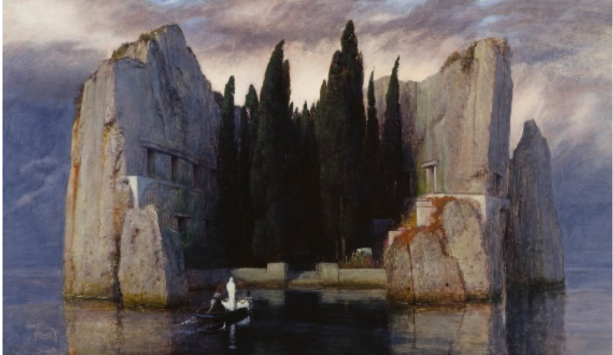
Resim 1. Arnold Böcklin, "Ölüler Adası" (Island of the Dead), üçüncü yapım (third version), 1883, Ahşap üzerine yağlıboya (Oil on wood), 80 x 150 cm, Alte Nationalgalerie, Berlin.

Bu çalışmada, Arnold Böcklin’in “Ölüler Adası” (Resim 1) adlı eserinin sanatsal eleştirisi, mevcut yöntemler dâhilinde, SEBYİ’ye dayalı olarak, doküman analiz tekniğiyle gerçekleştirilmiştir. Buna göre, eser hakkında elde edilen bulgular şöyledir: