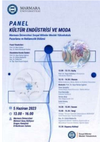
Görsel 6. Panel Afisi.

Literatür taraması ve deneysel tasarım anlayışıyla yürütülen çalışmanın materyali, 05-15 Haziran 2023 tarihinde Kültür Endüstrisi ve Moda Paneli (Görsel 6) kapsamında yazar tarafından gerçekleştirilen “Ormana Gilamıklı Dokumalarına MERHABA” başlıklı sergisinde yer alan ürünlerdir (Görsel 7) Örnekleme, bu sergi için hazırlanan koleksiyondan seçilen 6 adet ürün oluşturmaktadır.