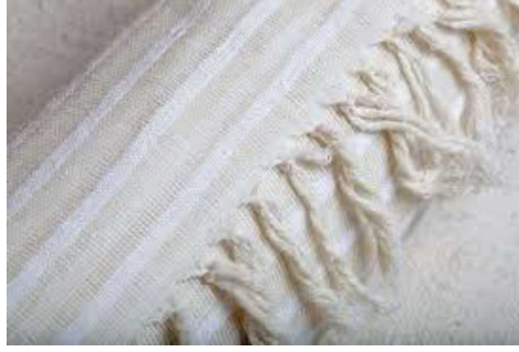
Görsel 1. Gilamıklı Dokuma Kumaş.

Gilamıklı dokuma kumaş, temelde bir tür ipekli dokuma olarak ortaya çıkmıştır, ancak zaman içinde ipek üretiminin azalması ve pazarlama zorlukları nedeniyle ipeğin yanı sıra pamuk ve keten iplikleri de kullanılmaya başlanmıştır. Dokuma işlemi, yörede “düzen” veya “dezgah” olarak adlandırılan ayaklı veya pedallı ahşap tezgâhlarda gerçekleştirilmektedir (Url-1). Bu tezgâhlarda yaklaşık 90 cm. genişliğinde dokuma kumaşlar üretilebilmektedir.