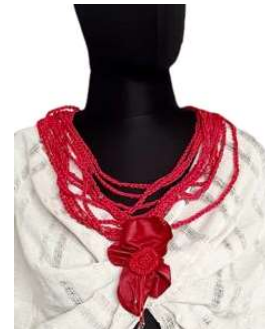
Görsel 13. Detay ve Aksesuar.