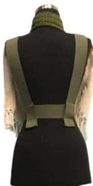
Görsel 28. Arka Görünüm.