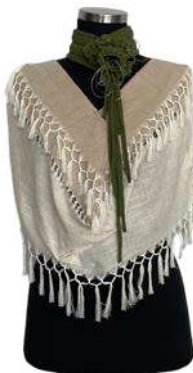
Görsel 27. Ön Görünüm.