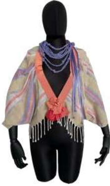
Görsel 21. Ön Görünüm.