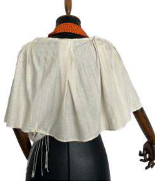
Görsel 19. Arka Görünüm.