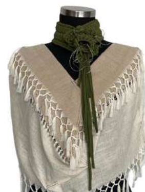
Görsel 29. Detay ve Aksesuar.