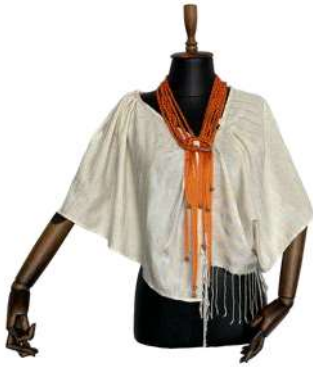
Görsel 18. Ön Görünüm.