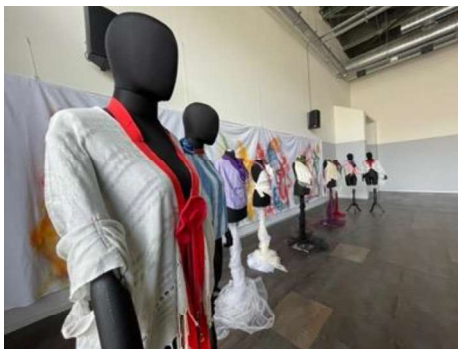
Görsel 9. Sergi Görüntüleri.