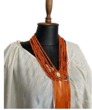
Görsel 20. Detay ve Aksesuar.

Görsel 18-19-20'de yer alan tasarım tek renk olarak dokunan dikdörtgen kumaş ile pelerin görüntüsü verilerek üst giyime dönüştürülmüştür. Sağ omuzdaki kumaşın bir bölümü büzülerek omuza oturması sağlanmıştır. Ön ortada sağ ve sola doğru küçük pililer katlanarak V yaka oluşturulmuştur.