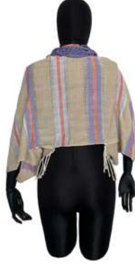
Görsel 22. Arka Görünüm.