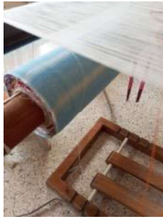
Görsel 2. Kumaş Levendi.

Gilamıklı dokuma kumaşlarının üretiminde kullanılan araçlar arasında gülerce, çark, pervane, kumaş levendi (Görsel 2) ve mekik (Görsel 3) yer almaktadır.