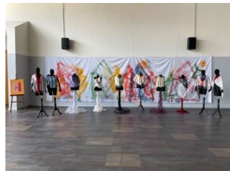
Görsel 10. Sergi Görüntüleri.