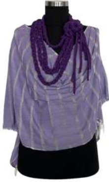
Görsel 24. Ön Görünüm.