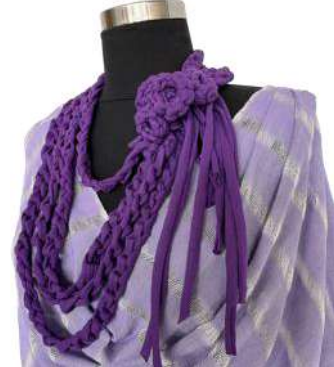
Görsel 26. Detay ve Aksesuar.

Görsel 24-25-26'da yer alan tasarım lila ve beyaz renkte çizgili olarak dokunmuştur. Beyaz renk ile dokumada ajur şeritler yapılmıştır. Ön bedeni bütün, arka bedeni farklı materyallerle desteklenerek birleştirilen üst giyime dönüştürülmüştür. Ön ortada yatay olarak yapılan drapeler giysiye hareket kazandırmıştır. Arka ortada iki parçanın birbirine bağlanmasını sağlayan 8 cm genişliğindeki grogren kurdele ters zig zag şeklinde yerleştirilmiştir. Omuzlarda ön ortadan gelen katlamalar devam ederek küçük pililer halinde dikilmiştir. Kol ağzları el dikişi ile tutturularak kol açıklığı oluşturulmuştur.