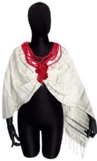
Görsel 11. Ön Görünüm.

Görsel 11-12-13'te yer alan tasarım ev tekstili/sehpa örtüsü olarak kullanılmak üzere kenarları saçaklı ve iki renkli olarak dokunan kumaş drapaj yöntemiyle üst giyime dönüştürülmüştür. İster içine bir tişört, krop (crop), body tarzı giysilerle birlikte ya da tek giyilebilecek bir ürün olarak tasarlanmıştır.