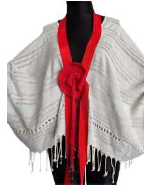
Görsel 17. Detay ve Aksesuar.

Görsel 14-15-16-17'de yer alan tasarım tek renk dokunan dikdörtgen kumaş ile önden açık ve arkası kısa olarak drapaj yöntemiyle üst giyime dönüştürülmüştür.