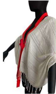
Görsel 16. Yan Görünüm.