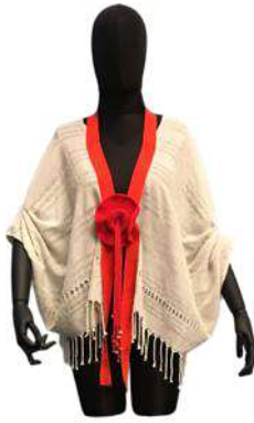
Görsel 14. Ön Görünüm.