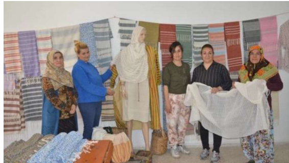
Görsel 5. Dokuma Kumaş Sergi Alanı.

Gılamıklı dokuma geleneğinin 300 yılı aşkın bir gelenek olduğunu belirten Peşmen, " Bu yaptığımız dokumaları ebelerimiz, ninelerimiz ve teyzelerimiz örtü olarak kullanırlardı. Bize de bu miras kaldı. Bunu canlandırdık. İpek ve pamuk karışımı yapıyoruz. Bizim bu dokumalarımız Ormana Özgüven Vakfı ve Sabancı Olgunlaşma Enstitüsü girişimleri ile Türkiye kültürel mirasına alındı. Ormana Gılamıklı Dokuması Cumhurbaşkanlığı himayesi altına da alındı ve bu vesile ile Ankara'da sergisi gerçekleştirildi. Türkiye Dokuma Atlasında Anadolu'nun Miras Kumaşları' adı altında yayınlandı " (Url-4) şeklinde bu kumaşın yaygınlaştırılması amacıyla yapılan çalışmalardan bahsetmiştir. Şu an Antalya'nın İbradı ilçesi Ormana Mahallesi'nde yöreye özgü 300 yıllık Gılamıklı dokuma sanatı yaşatılmaya çalışılmakta ve kadınlar dokuma tezgâhlarında hem kültürlerini yaşatırken hem de aile bütçesine katkı sağlamaktadırlar (Url-5) (Görsel 5).