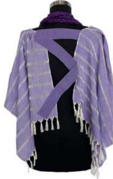
Görsel 25. Arka Görünüm.