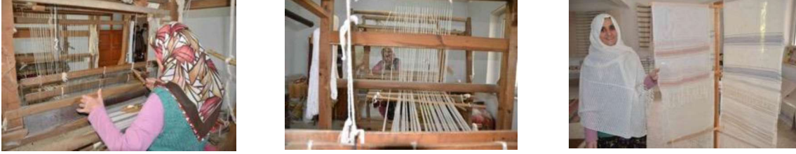
Görsel 4. Dokuma Tezgâhı Başında Üretici Nevin Peşmen.

Geleneksel el sanatları, bir toplumun kültürel mirası ve kimliğinin önemli bir yansıması olarak kabul edilmektedir. Bu bağlamda, Ormana kasabasında yer alan dokuma geleneği de dikkate değer bir örnek teşkil etmektedir.