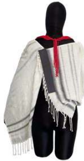
Görsel 12. Arka Görünüm.