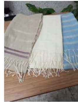
Görsel 8. Halk Eğitim Atasem Kursunda Dokunan Kumaşlar.