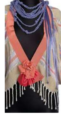
Görsel 23. Detay ve Aksesuar.

Görsel 21-22-23'te yer alan tasarım bej, açık ve koyu lila ve somon renkleriyle tekrar eden çizgili olarak dokunan kumaş şal görüntüsünden yola çıkarak hafif drape katlamaları ile üst giyime dönüştürülmüştür. Önden açık olarak tasarlanan giyside ön ortada sağ etek ucundan başlayıp 8 cm genişliğinde somon renkte kullanılan grogren kurdele arkayı dönerek sol etek ucunda bitirilmiştir. Bu kurdele giysiyi toparlamak ve deformasyonu önlemek amacıyla kullanılmıştır. Bel hizasındaki ön ve arkadan gelen kumaş el dikişi ile tutturularak kollar oluşturulmuştur. Her iki kenarda bulunan saçaklar serbest bırakılarak görüntüde kavisli dönüş