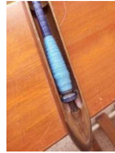
Görsel 3. Mekik.

Gilamıklı dokumacılığının Ormana Mahallesi'ndeki tarihçesi net olarak belgelenmemiş olmasına rağmen, uzun bir geçmişe sahip olduğu bilinmektedir. Bu kumaş türü, başörtüsü ve çarşaf gibi giyim eşyaları olarak kullanıldığı gibi masa takımı, sehpa takımı ve yatak takımı gibi mobilya üzerinde de örtü olarak kullanılmaktadır.