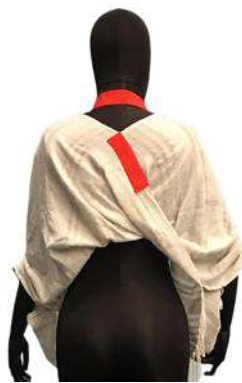
Görsel 15. Arka Görünüm.