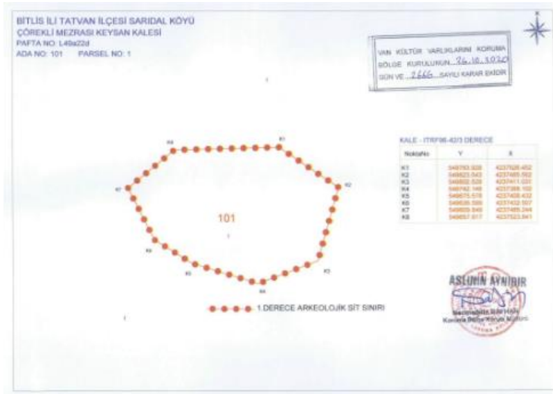
(Krokiya Kelhê şekil: I)

Wezaretê çand û hunere Keleha Sunbanê û merzelê begên wê kiriye sît. Li ser daxweznameya Cemil Begê "Lijneya Parastina Heynên Çandî ya Wanê roja 26.10.2020 bi numara 2666 ev biryar dane: "Kela Kêsanê merzelên began ya ku niha di nav sînorê wilayeta Bitlîsê navçeya Tetwanê gundê Kûtê/Saridal mezra Sunbanê/Çorekliyê milkê wê aîdê xezînê ye. Pafte L49a22d ada 101 parsela 1 bi dereca 1. sîta arkeolojiyê hatiye ilan kirin." (Krokiya Kelhê şekil: I) (Kelhê Sunbanê şekil: II)