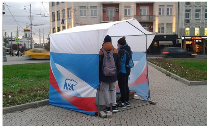
Görsel 3. Moskova'nın Merkezinde Birleşik Rusya Partisinin Seçim Çadırı.

Bu bir haftalık süre içinde, Rusya Federasyonu parlamentosunun alt kanadı Devlet Duması'na 2011 yılındaki seçimle girebilmiş dört partiden ikisine rastlandı: Biri "Putin'in partisi" olarak da bilinen iktidardaki Birleşik Rusya partisi ve diğeri o sırada Duma'da en küçük parti konumundaki Rusya'nın Liberal Demokrat Partisi (LDPR).