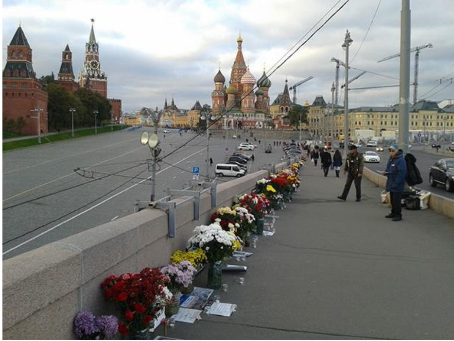
Görsel 8. İktidarın muhaliflerinden Boris Nemtsov'un öldürüldüğü köprü ve Nemtsov'un anısına bırakılan çiçekler, yazılar vs. Görselin sağında görülen gözlüklü, mavi paltolu ve şapkalı kişiyle köprüden geçerken biraz sohbet edildi. Köprünün adını "Nemtsov Köprüsü" olarak değiştirilmesini talep ettiklerini ve Nemtsov suikastı için adalet istediklerini ifade etti. (Görsel, Ekim 2015 tarihinde yazar tarafından çekildi / Y.Ö.A.).

Hodorovski'nin partisi sayılan PARNAS'ın 2016 Duma seçimine katılmasına izin verilmesi gibi. Bu gibi durumlarda, muhaliflere zaten kazanamayacakları koşullar altındaki bir alanda oynamalarına izin verilmektedir. Putin'e muhalif ve PARNAS'ın liderlerinden bir diğeri olan İlya Yaşın, Birleşik Rusya - Suçlu Rusya adlı kitabını tanıttı. Yaşın, kitapta iktidarda bulunan Birleşik Rusya partisinin yaptığı yolsuzlukları belgelendirmektedir. Bu kitabın Boris Nemtsov'un öldürülmeden önce yayınlacağını söylediği belgeleri içerdiği yazıldı. Yaşın, kitabını tanıttıktan iki gün sonra Moskova'da sokakta seçim öncesi yaptığı bir konuşma sırasında polis tarafından tutuklandı.