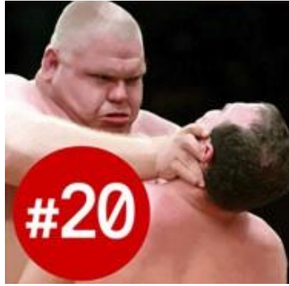
Görsel 2: Rus Muhalefetinin Seçim Sürecindeki Temel Simgesi

cezalandırılmasını öngörmektedir. Bu (bkz. Görsel 2 ), 2016'daki Duma seçim sürecinde muhalefetin temel ismi Navalni'nin kullandığı başlıca simgeydi.