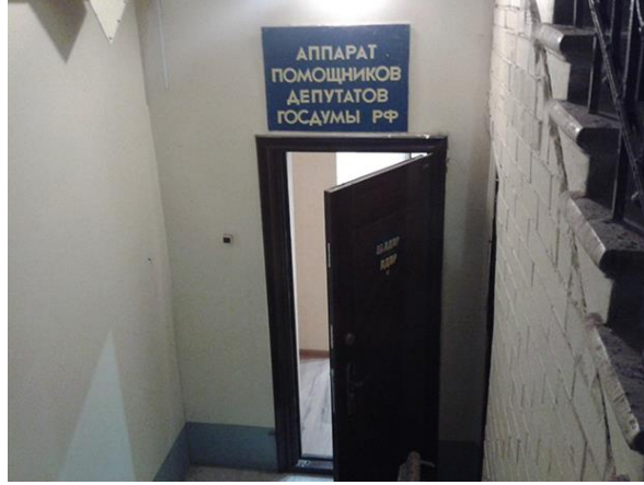
Görsel 4. Moskova'da Çok Katlı Bir Binanın Bodrum Katında LDPR Bürosu.

Moskova'da LDPR'ye rastlanması ise, bir hafta süresince kalınan binadaki daireden çıkarken duyulan gürültülü sesler nedeniyle bodrum katına kısaca göz atmakla oldu. Bu sırada seslerin geldiği bodrum katındaki dairenin giriş kapısında Rusya'nın Liberal Demokrat Partisi'nin kısa adı olan "LDPR"nin yazıldığı görülüp bir görseli çekildi (bkz. Görsel 4 ). Kapı girişinin üstünde ise büyük harflerle "Rusya Federasyonu Devlet Duması Milletvekillerinin Yardımcı Birimi" yazmaktadır.