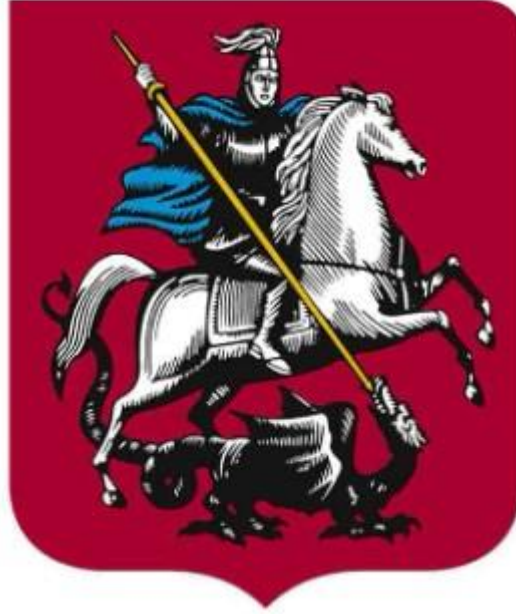
Görsel 1: Rus İktidarının (Birleşik Rusya Partisi) Seçim Sürecindeki Temel Simgesi Aziz Georgi (Jurnal FOMA, 2023)

2016'daki Duma seçimlerinde iki temel rakibin birbirlerine karşı kullandıkları rekabet simgeleri (bkz. Görsel 1 ve Görsel 2 ), söz konusu seçimi görsel düzlemde özetlemektedir.