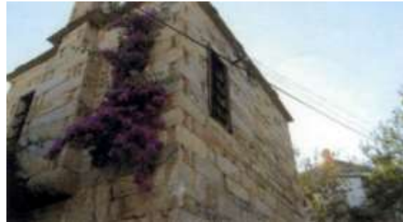
Fotoğraf 4. Çomakdağ köyünde bir taş ev (Photo 4. A Stone house in Çomakdağ village)