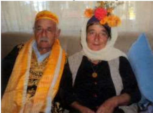
Fotoğraf 7. Çomakdağlı hacı adayı (Photo 7. Çomakdağ pilgrim candidate)