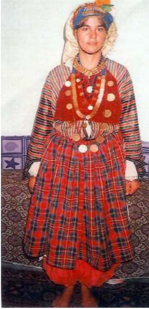
Fotoğraf 43. Kırmızı yemenili Çomakdağlı kadın (Photo 43. Çomakdağ woman with red yemeni)