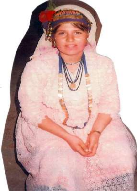
Fotoğraf 18. Çomakdağlı yeni gelin (Photo 18. Çomakdağ new bride)