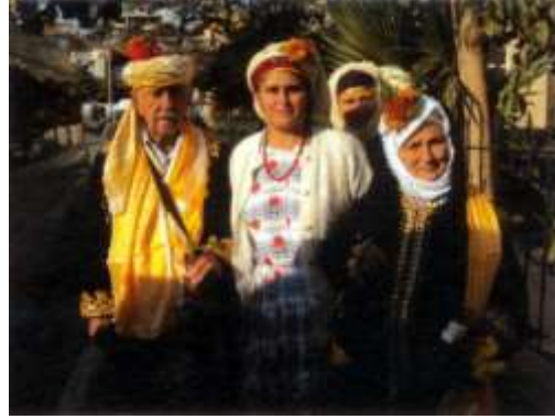
Fotoğraf 10. Hacı adaylarını uğurlama merasimi (Photo 10. Ceremonies for pilgrims)

Çomakdağ kadınları hala günlük yaşamda ve törenlerde kullanılan, çok eskiye dayanan otantik giysileri ile dikkat çekmektedirler (Fotoğraf:11-13).