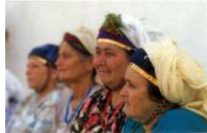
Fotoğraf 13. Günlük yaşamda Çomakdağlı kadınlar (Photo 13. Women daily life in Çomakdağ)

Düğünlerde; gelin kızın kıyafetlerinin kendine has Yörük geleneklerine uygun olarak hazırlandığı belirtilmiştir. Belirgin özellik olarak gelin kıza geleneksel giysiler giydirildikten sonra başın arkadan ve önden yerlere doğru uzanan ipek veya saten kırmızı kumaş geçirilip baş kısmına mevsim çiçeklerinden hazırlanmış çiçekler yerleştirilir. Gelin kızın takıları da baş bölgesinin arka tarafından sarkıtılmak suretiyle yerleştirilir. Bu geleneği birçok aile devam ettirmesine rağmen bazı aileler günümüz beyaz gelinliği tercih ettikleri belirtilmektedir (Fotoğraf:14). Çomakdağ'da otantik giysilerin kumaşlarının dokunması ve dikimi çoğunlukla yöre kadınları ve genç kızları tarafından yapılmaktadır. Geleneksel giysiler, çeşitli imgeler taşıyan motif ve işlemlerle süslüdür. Kadınların başlarına doğal mevsim çiçekleri takarak süslemeleri ise çok yaygın bir gelenektir (Fotoğraf:15-17).