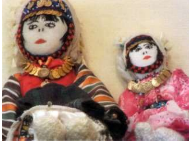
Fotoğraf 45. Çomakdağ giysili bez bebekler (Photo 45. Cloth dolls dressed in Çomakdağ)

Maddi kültürün önemli ögesi olan Giyim-Kuşam ve süslenme kültürünün genç kuşaklara öğretilmesi oldukça önemlidir, bu nedenle bunların sergilenebileceği özgün bir Çomakdağ Etnografya Müzesinin kurulması gerekmektedir. Bu giysi ve aksesuarların oyuncak bebeklerle, hediyelik eşya ile de pekiştirilerek ülke ekonomisine katkı sağlanması gerekmektedir. Batı ülkelerinden İngiltere, Fransa, Almanya, Avusturya, İtalya bunu bir devlet politikası olarak görüyor ve hediyelik eşyalar, müzeler, devlet yardımı ile son derece güzel hazırlanarak ilgililere sunuluyor (Ayhan, 2004).