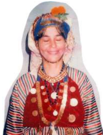
Fotoğraf 42. Göğüslük giymiş Çomakdağlı kadın (Photo 42. Çomakdağ woman wearing breasts)