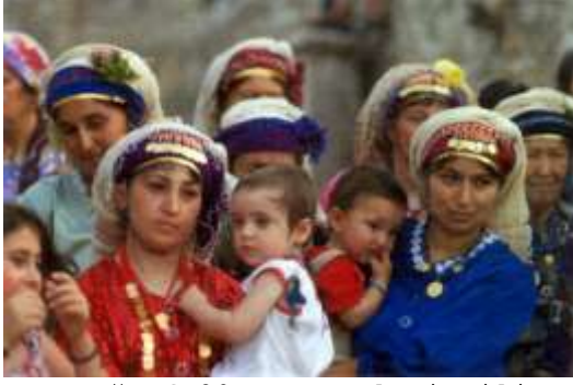
Fotoğraf 20. Yöresel giysili Çomakdağlı kadınlar (Photo 20. Women with regional dress in Çomakdağ)