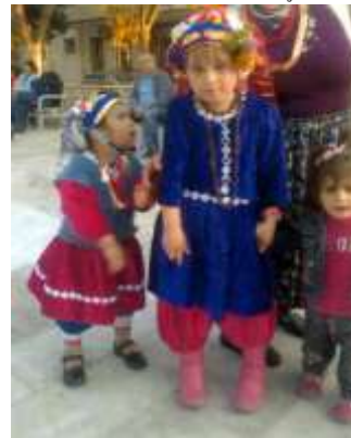
Fotoğraf 30. Çomakdağlı kız çocukları (Photo 30. Girls in Çomakdağ)