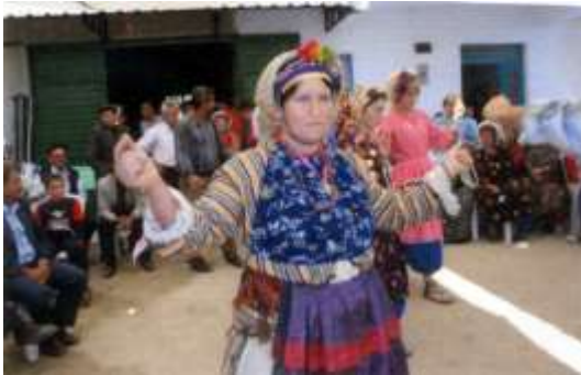
Fotoğraf 5. Düğün töreninde yöresel giysili kadın (Photo 5. Woman in local dress at wedding ceremony)