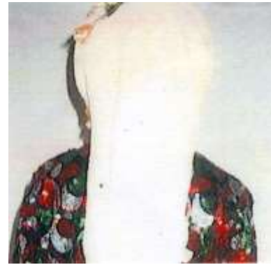
Fotoğraf 33. Çomakdağlı kadının baş bağlamanın arkadan genel görünümü (Photo 33. General view of the back of the head of a woman from Çomakdağ)