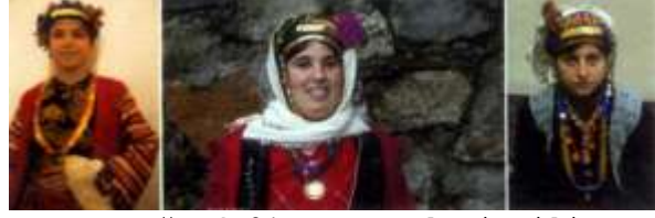
Fotoğraf 21. Yöresel giysili Çomakdağlı kadınlar (Photo 21. Women with regional dress in Çomakdağ)