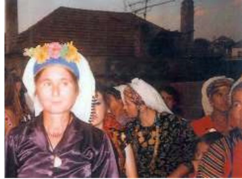
Fotoğraf 23. Yöresel giysili Çomakdağlı kadınlar (Photo 23. Women with regional dress in Çomakdağ)