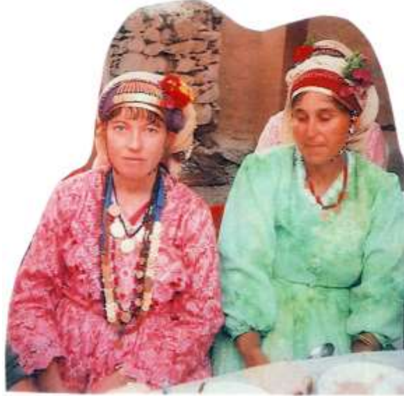
Fotoğraf 15. Başları çiçekli kadınlar (Photo 15. Young women with flowers in their heads)