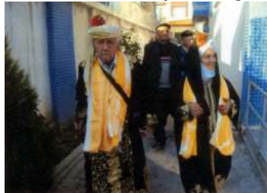
Fotoğraf 8. Hacı adaylarını uğurlama merasimi (Photo 8. Ceremonies for pilgrims)