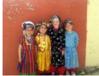
Fotoğraf 29. Çomakdağlı kız çocukları (Photo 29. Girls in Çomakdağ)