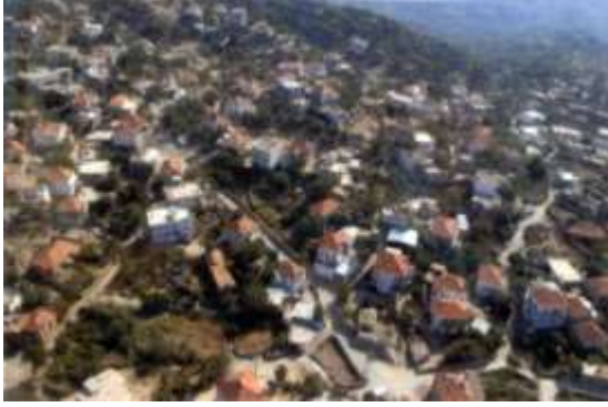
Fotoğraf 1. Çomakdağ köyü genel görünüm (Photo 1. General view of Çomakdağ village)