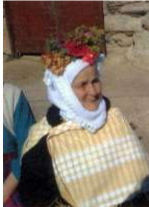
Fotoğraf 12. Çomakdağlı hac giysili nine (Photo 12. Çomakdağ hijacked grandmother)