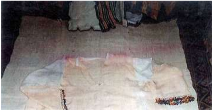
Fotoğraf 34. Çomakdağ oyalı çemberesi (Photo 34. Çomakdağ carved wheel)