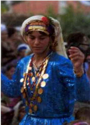
Fotoğraf 11. Çomakdağ köyünde bir yeni gelin (Photo 11. A new bride in the village of Çomakdağ)

Çomakdağ kadınları hala günlük yaşamda ve törenlerde kullanılan, çok eskiye dayanan otantik giysileri ile dikkat çekmektedirler (Fotoğraf:11-13).