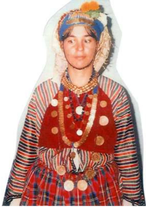
Fotoğraf 44. Boncuk ve altın takılı Çomakdağ kadını (Photo 44. Çomakdağ woman wearing beads and gold)