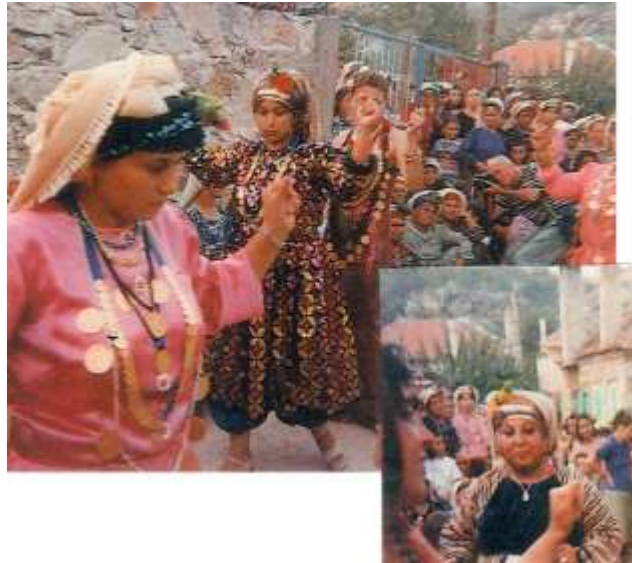
Fotoğraf 25-26. Kına gecesi töreni ve kayın valide (Photo 25-26. Henna night ceremony and mother-in-law)