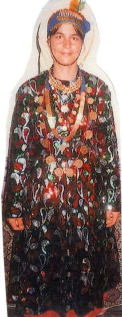
Fotoğraf 27. Düğünde giyilen simli entarili Çomakdağlı yeni gelin (Photo 27. Women wearing brilliant clothes in wedding)

Çomakdağ-Kızılağaç köyünün geleneksel düğünleri kadar köy kadınlarının giydikleri geleneksel kıyafetler de yörenin tanınmasında etkili olmuştur. Düğünlerde giyilen kadın kıyafetleri düğünün kaçınıcı gününde olduğumuzu bize söyler. Her düğün günü için farklı kıyafet giyilir. Kıyafetine bakılarak davetlilerinin düğün evine yakınlığını da anlayabiliriz. Bu yakınlık kendisine verilen okutmayla paralel olarak gösterilir. Değerli bir okuntu olan davetli en kıymetli kıyafetlerini giyer. Köyde kadınların kıyafetleri simli entari, şifon, gipür dantelli (köyde köprülü de denir) ve üç beş entari bu kıyafetlere verilen isimlerdendir (Fotoğraf:27). Düğün törenlerinde kız çocuklarına da yöresel giysi giydirilir (Fotoğraf:28-30) (Yılmaz, 2012).