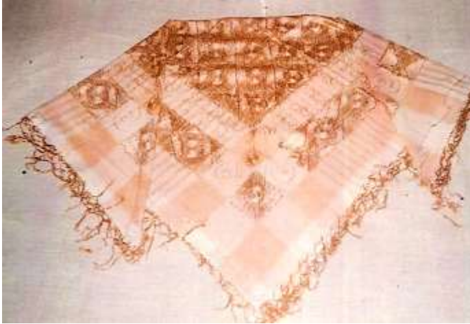
Fotoğraf 36. Çomakdağ ipekli çembere (eşarp) (Photo 36. Çomakdağ silk çembere (Scarf))