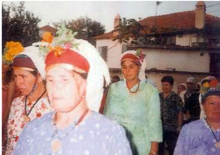
Fotoğraf 37. Başlıkları çiçekli Çomakdağlı kadınlar (Photo 37. Çomakdağlı women with flowers)