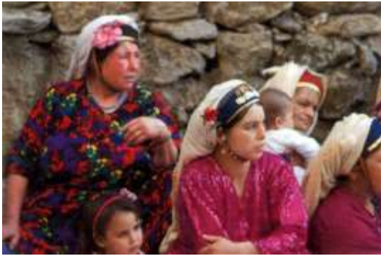
Fotoğraf 22. Yöresel giysili Çomakdağlı kadınlar (Photo 22. Women with regional dress in Çomakdağ)