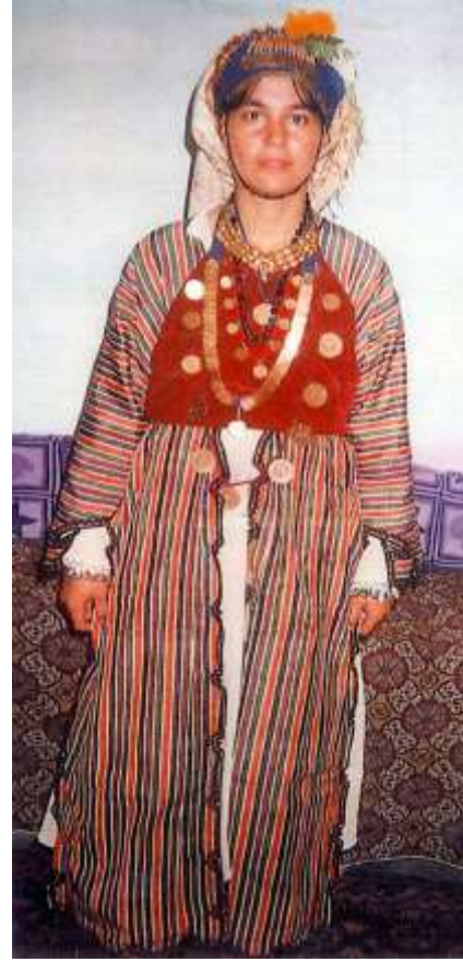
Fotoğraf 40. Üç-beş giyimli Çomakdağlı kadın (Photo 40. Three-five- dressed Çomakdağ woman)