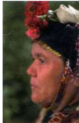
Fotoğraf 32. Çomakdağlı takkeli kadın (Photo 32. Çomakdağ with takke woman)