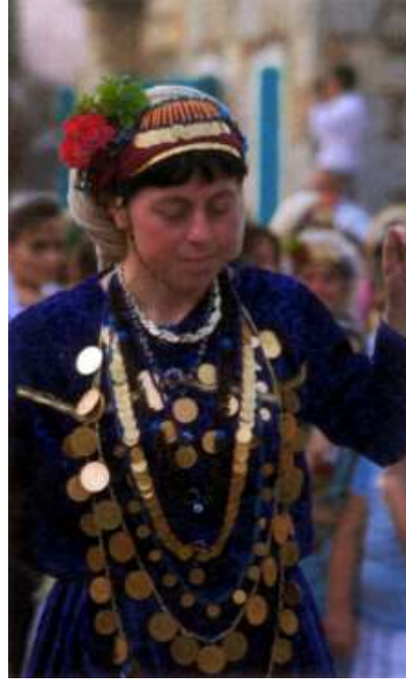
Fotoğraf 19. Çomakdağlı yeni gelin (Photo 19. Çomakdağ new bride)

Bu araştırmada amaç, Muğla ili Milas ilçesi Çomakdağı-Kızılağaç köyünün kadın kıyafet geleneğini belgelemek ve tanıtmaktır. Çalışma 2009 ve 2012 yıllarında yörede yapılan, gözlem, inceleme ve görüşmelerle gerçekleştirilmiştir. Farklı düğünlere katılarak kıyafet parçaları ayrı ayrı fotoğraflarla belgelenmiş, kaynak kişilerden edinilen bilgiler doğrultusunda kültürel özellikler ve giysiler tanıtılmaya çalışılmıştır (Yılmaz, 2012).