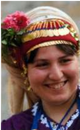
Fotoğraf 31. Çomakdağlı takkeli kadın (Photo 31. Çomakdağ with takke woman)

Bu altınlar bir nevi güvencedir onlar için, bu kadar altını başlarında taşımak güvence içinde olsa günümüzde tehlike unsuru da olabilmektedir. Fakat kadınlar önlem olarak başörtüleriyle bu altın dizilerini kapatıp olası tehlikelere karşı kendilerini koruma altına almaktadırlar (Kınacı 2009:215).