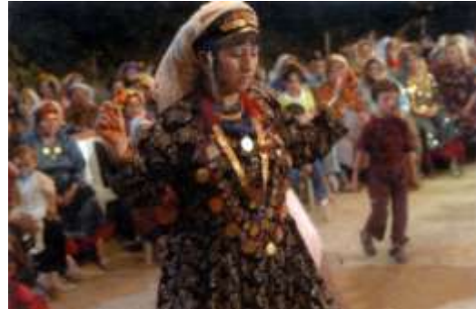
Fotoğraf 6. Düğün töreninde yöresel giysili yeni gelin (Photo 6. New bride with local dress in wedding ceremony)