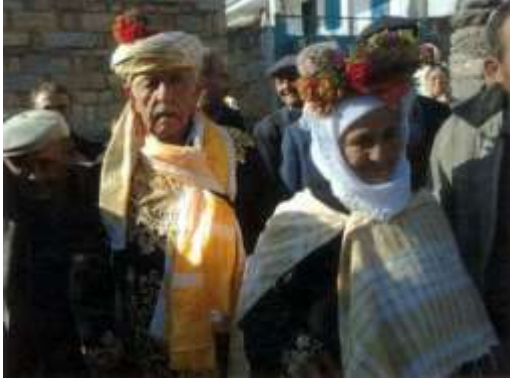
Fotoğraf 9. Hacı adaylarını uğurlama merasimi (Photo 9. Ceremonies for pilgrims)