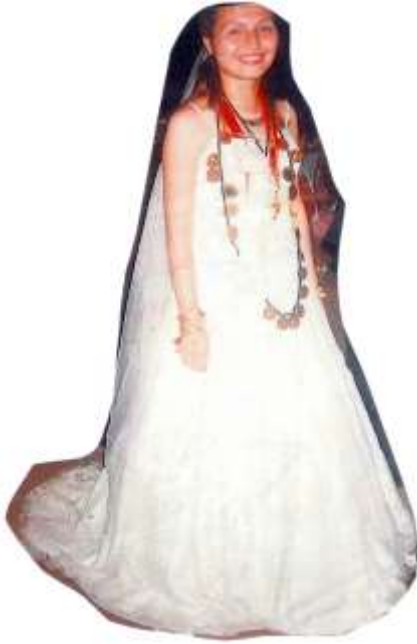
Fotoğraf 14. Çomakdağlı güncel giysili gelin (Photo 14. Bride with current dress with Çomakdağ)