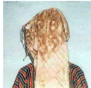
Fotoğraf 35. Çomakdağ çembereli kadın başı Photo 35. Çomakdağ grooved female head