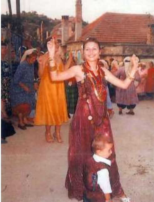
Fotoğraf 24. Kına gecesi ve gelin (Photo 24. Henna night and bride)