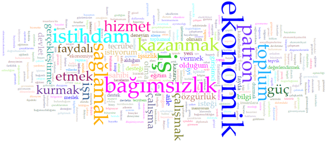
Şekil 1. Girişimci Olmaya Sevk Eden Unsurlar Kelime Bulutu

Şekil 1.'de katılımcılara yöneltilen açık uçlu sorulardan “sizi girişimci olmaya sevk eden unsurlar nelerdir” sorusuna yönelik verilen cevaplara göre oluşturulmuş kelime bulutu görülmektedir. Katılımcılardan elde edilen 1458 kelimedenden oluşan söylem kelime işlemci programında tek bir paragraf haline getirilmiş ve Voyant Tools isimli internet tabanlı söylem analiz yazılımına yerleştirilmiştir. Katılımcılardan elde edilen ve, veya, daha, vb. kelime grupları söylemden çıkarılmıştır. Kelime bulutunda katılımcıların verdiği yanıtların niceliksel olarak fazlalığına göre ilgili kavramların boyutları büyümekte ve merkez noktaya yerleşmektedir.