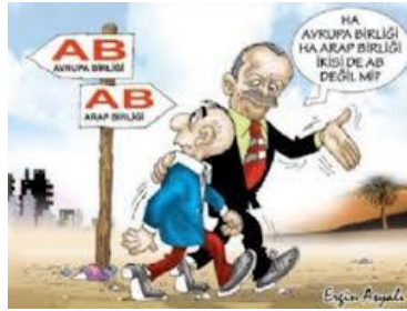
Şekil 6 : Gazetelerde Haber-Eğlence ( http://www.turkiye-ab.blogspot.com )