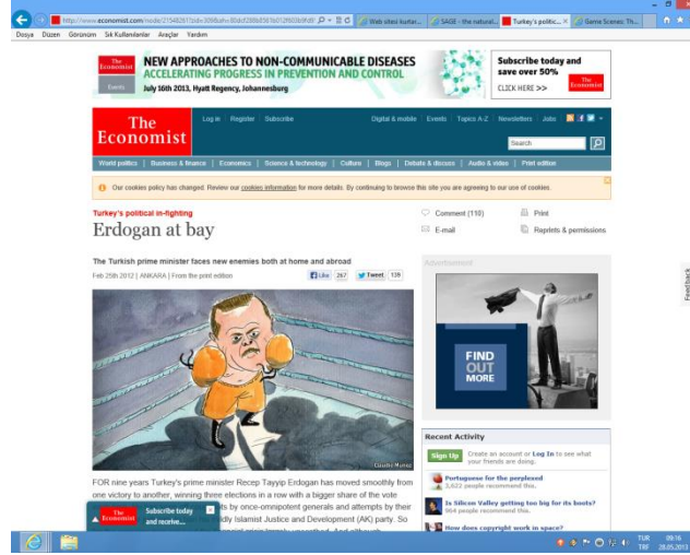
Şekil 8 : The Economist Dergisinde Erdoğan Karikatürü (The Economist, 25.02.2012)

Economist dergisinde yer alan habere göre, Türkiye ekonomisi her ne kadar ülke içerisinde aksi bir izlenim oluşturma gayretine karşı tam tersine bir dizi alanda başarısız olmuştur. Örneğin AKP döneminde Türkiye Cumhuriyeti tarihi boyunca verdiği en yüksek cari açığa sahip olmuş, yüzlerce üniversite öğrencisi ve gazetecisi kendilerine atfedilen suçlamalar doğrultusunda hapishanelerde mahkûm edilmiş, Türkiye Avrupa İnsan Hakları Mahkemesi tarafından karara bağlanan davalar açısından dünya birincisi haline gelmiştir. Bununla birlikte habere göre, Erdoğan oldukça sorunlu bir dizi alanda daha mücadele etmek zorundadır. Bununla birlikte, karikatüre göre ringe sıkışmış ve gözü morarmış bir boksör olarak temsil edilmiş ve karşısında elinde kılıç taşıyan ve oldukça büyük bir gölgeye sahip rakibi bulunmaktadır. Bütün bu unsurlara rağmen gazete haberi tarafından, Türkiye’ye getirilen önemli bir diğer eleştiri ülkenin Avrupa Birliği hedefinden uzaklaştırılması ve gittikçe Amerika Birleşik Devletleri ve Ortadoğu ekseninde bir dış politika izlemesidir.