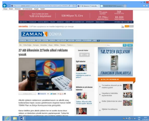
Şekil 5: Zaman Gazetesi'nde Avrupa Birliği Haberleri ( http://www.zaman.com.tr )

Örneğin, siyasal iktidarın toplum mühendisliği adına öne çıkarttığı alkol yasaklarının, yine Zaman Gazetesi'ndeki haberleştirilme biçimi tam da siyasal iktidarın maskelenmesi ve AB'nin bir iç politika aktörü olarak konumlanmasını hedeflediği zaten gözlenmektedir. Buna rağmen, Avrupa Birliği'nin hangi üyesi ya da üye adayının insan hakları ihlalinde dünya ikincisi olduğu, merkezi sınırlardaki yozlaşma süreçlerinin hangi ülkede egemen bir pratiğe dönüştüğü, gizli tanıklarla kurulan mahkemelerin toplumun geniş kesimlerinin hukuk güvencesinden uzaklaştırılmış bir yaşamı hangi ülkede kurduğu tam da söz konusu haberler içerisinde yok sayılmaktadır.