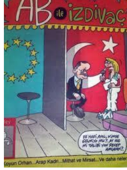
Şekil 9: Türkiye’de Egemen Medya Pratiklerinde Aile Kavramı

AB ile İzdivaç isimli medya faresi internet sitesinde yayınlanan karikatürde; izdivaç programı sunucusu “eee, hadi ama kimse gelmiyor mu? Yine mi talibi yok Recep amcanın” der ancak paravanın diğer tarafında hiç kimse yoktur. Bununla birlikte, Avrupa Birliđi bayrađı ile Türkiye Cumhuriyeti bayrađı oturma koltuklarının ardında yer alır. Bu durum gerçekte Türkiye'nin, Avrupa Birliđi adaylıđından beklentilerinin henüz karşılanmadıđı (evlenmeye gelen talibin olmadıđı) yönünde de tek parçalı ve farklılıkların görülmediđi bir aile yapısının yansıtılmadıđı yönünde de yorumlanabilir. Gerçekte, her ne kadar “Recep amca” beklese de Türkiye’de bir dizi alanda Avrupa bütünleşmesi üstelik çok daha erken tarihlerde tamamlanmıştır.