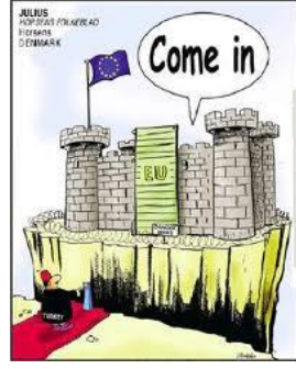
Şekil 10: Avrupa Birliği Medyasında Türkiye (www.abblogspot.com).

Danimarka’da bir ulusal gazetede yer alan karikatür, Avrupa Kalesi’ne bir Türk’ün girmesinin, üstelik içeriden yükselen haydi gel çağrısına rağmen, halen oldukça zor olduğunu gündeme getirmektedir. Çünkü kalenin surları bir yana kırmızı halı döşenmiş yolun tam arkası bir hendekle çevrilmiştir. Haberin eğlence boyutları bir yana, Türkiye’nin 2000-2012 dönemindeki dış tanıtım harcamaları ve Dış İşleri Bakanlığı’nın 93 Büyükelçilik, 11 Daimi Temsilcilik ve 58 Başkonsolosluk olmak üzere toplam 162 misyonla temsil edilmesine ve Dış İşleri Bakanlığı’nın resmi internet sitesinde Atatürk’ün sözlerini çarpıtma pahasına kullandığı “Hattı diplomasi yoktur, sathı diplomasi vardır, o sath bütün dünyadır” sözlerine rağmen (www.mfa.gov.tr), halen kavuk, fes ve cüppe ile çizilen Türk imajı; Adalet ve Kalkınma Partisi’nin diplomasi anlayışının bu bağlamda da sorgulanmasını gerekli kılmaktadır. Öte yandan büyük önder Atatürk’ün; “yurtta sulh, cihanda sulh” sözünün bir komşu ülkedeki iç savaşa destek veren hükümet tarafından dış işleri bakanlığı internet sitesine yerleştirilmemesi çok da şaşırtıcı değildir.