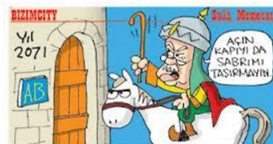
Şekil 7: Türkiye ve Avrupa Birliği Haberlerinde Eğlence (Bizimcity)

Örneğin blogspot sitesinde yayınlanan karikatürde, Tayyip Erdoğan’ın “ha Avrupa Birliği ha Arap Birliği ikisi de AB değil mi?” sözleri ile üretilen karikatür gerçekte Türkiye’nin giderek Avrupa Birliği ve değerlerinden uzaklaştırılarak Arap Birliği’ne yakınlaştırılması tam da söz konusu anlamlı gösterge olarak değerlendirilebilmektedir. Ancak, Türkiye’de gazetelerin tam aksine bir çizgi izledikleri hatta o denli ki gittikçe karikatürlerde dahi, üstelik hiç de öyle olmadığı gibi, bireysel başarının altını çizdikleri gözlenmektedir. Buna ilişkin örnekler satış sürecinin ardından Sabah Gazetesi ve A TV televizyonundan gelmektedir. Eşi AKP milletvekili olan Salih Memecan; “Bizim City” isimli karikatürlerinde Tayyip Erdoğan’ın, çoğu kez vatandaşa gösterdiği, asabi tavrını konu edinmekte ve sözde bir kararlılık tablosu oluşturmaktadır.