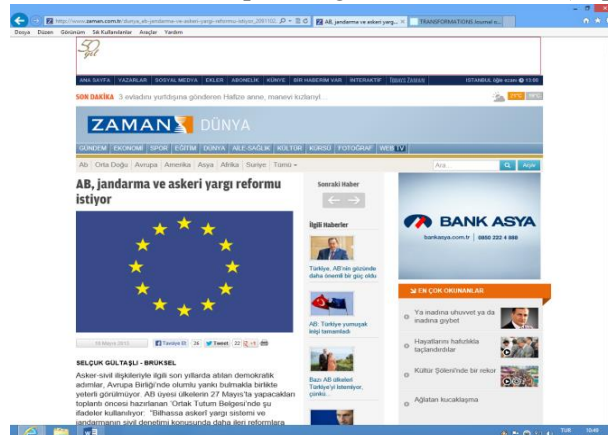
Şekil 4 : Zaman Gazetesinde, Avrupa Birliği Haber Örnekleri ( http://www.zaman.com.tr )