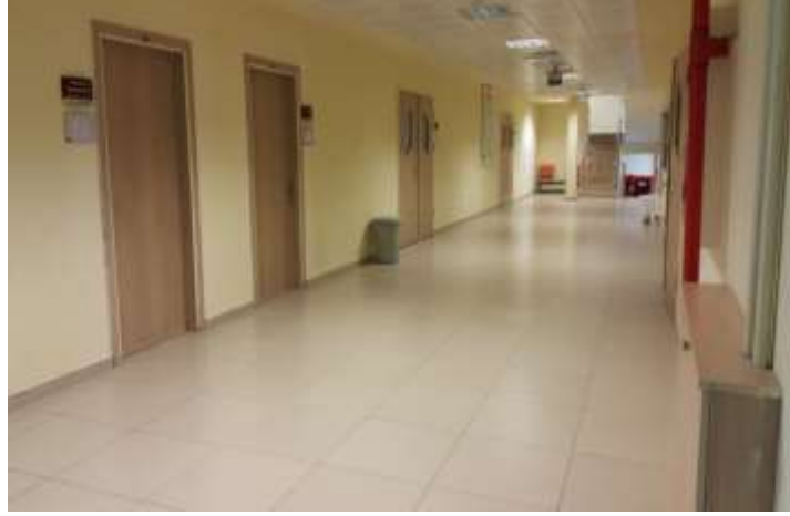
Fotoğraf 20. Bölüm başkanı odaları ve derslikler (Karşıda idari bölümle bağlantı sağlayan merdivenler) (Image 20. Rooms of the heads and classrooms (Opposite: stairs leading to the administrative section))