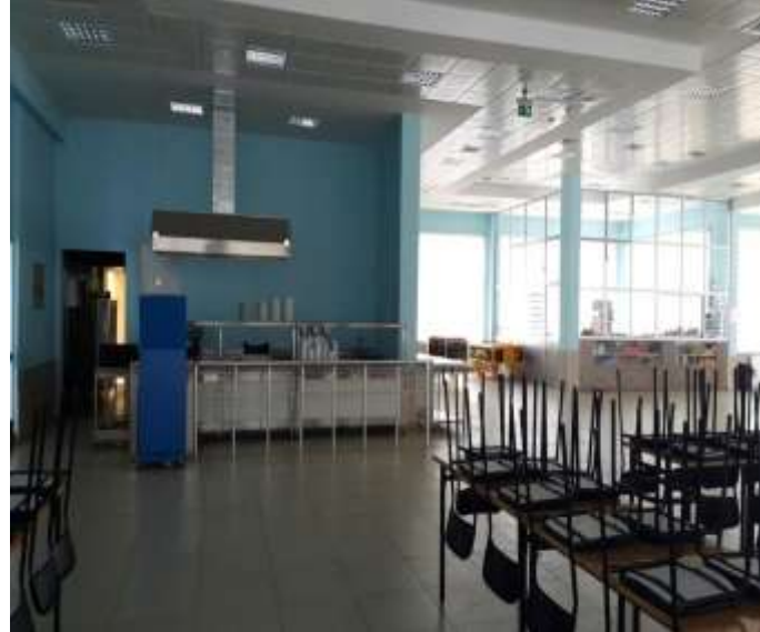
Fotoğraf. 14 (Image. 14) Fotoğraf. 15 (Image. 15) Fotoğraf 14 ve 15. Yemekhane girişi, yemekhane ve kantin bölümü (Image 14 and 15. Dining hall entrance, dining hall and canteen department)