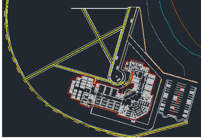
Şekil 2. Vaziyet planı (Figure 2. Situation plan)

Bu çalışmada hizmet alanlarına göre kültür binaları sınıfında yer alan eğitim yapılarının bedensel engellilere yönelik düzenlemeleri araştırılmıştır. Çalışmanın amacı bir yükseköğretim kurumuna ait eğitim binası ve yerleşkesinin engelliler açısından ulaşılabilirliğini ve kullanılabilirliğini incelemektir. Şekil 2’de vaziyet planı verilen kurumun yerleşkesi ve eğitim binası çalışmanın kapsamını oluşturmaktadır. Çalışma da engelli bireylere yönelik bazı yapısal düzenlemeler ile birlikte belirlenen kurumun engelliler açısından ulaşım ve kullanım durumu incelenmiştir.