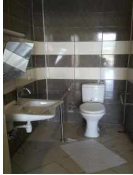
Fotoğraf. 12 (Image. 12) Fotoğraf. 13 (Image. 13) Fotoğraf 12 ve 13. Giriş katında planlanan engelli wc (Image 12 and 13. Disabled wc at the entrance floor)