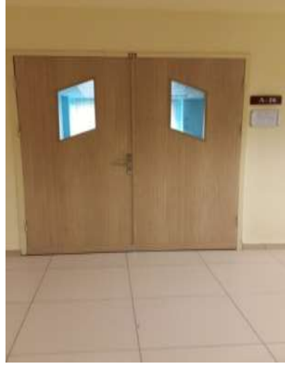
Fotoğraf. 16 (Image. 16) Fotoğraf. 17 (Image. 17) Fotoğraf 16 ve 17. Derslik giriş kapısı (Image 16 and 17. Classroom entrance door)