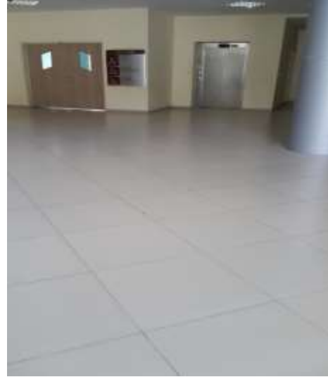
Fotoğraf 8. Öğrenci giriş koridorunda planlanan asansör (Image 8. Planned elevator in student entrance hall)