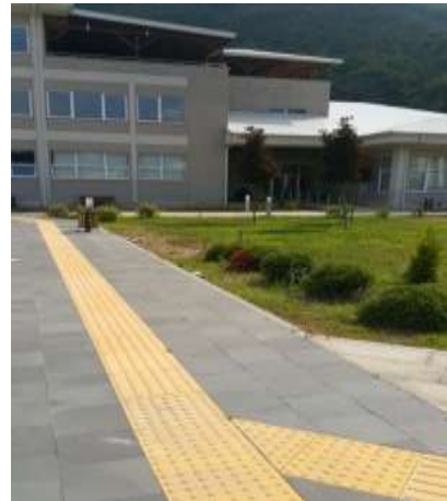
Fotoğraf. 18 (Image. 18) Fotoğraf. 19 (Image. 19) Fotoğraf 18 ve 19. Bina girişi (Image 18 and 19. Building entrance)