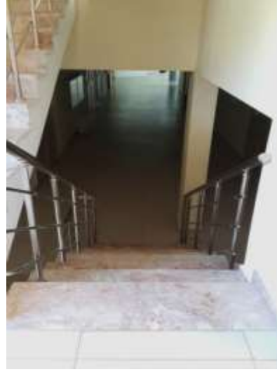
Fotoğraf. 22 (Image. 22) Fotoğraf. 23 (Image. 23) Fotoğraf 22 ve 23. Kat merdivenleri (Image 22 and 23. Floor stairs)