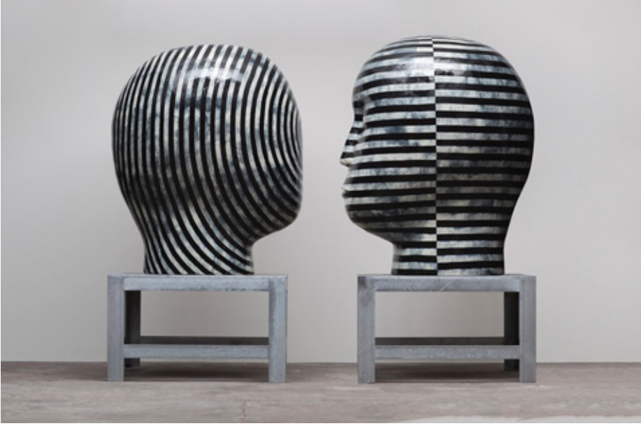
Görsel 7: “Untitled, Heads”, Jun Kaneko 2014 hand built and glazed ceramics R: 68 h x 54 w x 42 d / L: 69.5 h x 54 w x 42 d in.

eserlerinde önemli bir yer tutmaktadır. Toplumdaki hiyerarşik yapı, bireylerin kimlik arayışlarını ve aidiyet duygularını nasıl etkiler, bu konuda sanatçının eserleri aracılığıyla ortaya çıkabilir. Politik eleştiri de “Heads” eserinde rastlanabilecek bir başka temadır. Sanatçı, siyasi kararların ve sistemlerin toplumdaki hiyerarşiyi nasıl şekillendirdiğini ve bu durumun insanlar üzerindeki etkilerini sanatsal bir perspektifle gözler önüne sermektedir. Sanatçı, toplumsal cinsiyet ve çeşitlilik konuları da “Heads” adlı eseri önemli bir yer tutabilir. Toplumsal cinsiyet rolleri, cinsiyet eşitsizliği ve çeşitlilik gibi konuları ele alarak toplumdaki farklı grupların hiyerarşik yapı içindeki yerlerini sorgulayabilir. “Heads” eseri, sanat aracılığıyla toplumsal gerçeklikleri anlama ve düşünme fırsatı sunarak izleyicilere çeşitli düşünsel katmanlar sağlamaktadır.