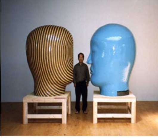
Görsel 11: Jun Kaneko Çift Kafalar arasında duruyor.