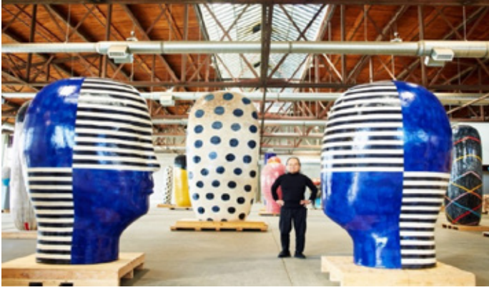
Görsel 10: Jun Kaneko and “Heads”, Ceramic

temsilini oluşturmaktadır. Sanatçı, seramik sanatı aracılığıyla bir toplumun düzensizliğini ve içinde yaşadığı olumsuzlukları izleyicilere sunarak, kend yaşam ortamını en iyi şekilde yansıtabileceğine inanmaktadır. Bu düzenleme, soyut biçimlerin kullanımıyla insanlığın karmaşıklığını ve içsel çatışmalarını ifade etmeye yönelik bir çaba içindedir. Çizgisel sıralama, kaotik ve düzensiz bir dünya içindeki bireyin deneyimlerini yansıtarak izleyicilere derin bir düşünürme sunmayı amaçlamaktadır. Sanatçı, seramik sanatının aracılığıyla,