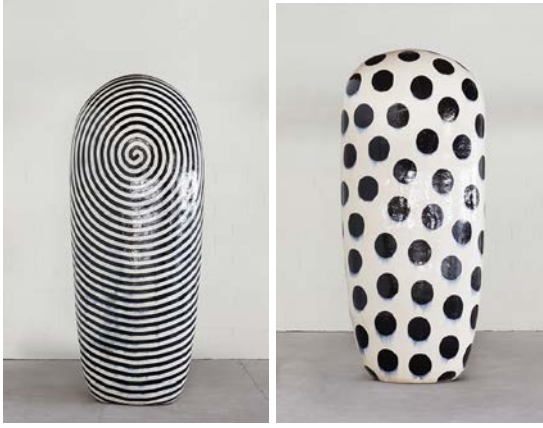
Görsel 5-6: 5“Untitled, Dango”, Jun Kaneko 2014 Hand built and glazed ceramic 122h x 56.5w x 39.5d in. 6“Untitled, Dango”, Jun Kaneko 2013 Hand built & glazed ceramics | 120h x 58w x 35d in.

Kaneko'nun eserlerinde insan ve doğa, genellikle bir araya getirilerek karmaşık ilişkileri temsil eder. Heykellerinde detaylı bir gözlemlerle elde ettiği bilgi ve deneyimleri kullanarak, insanların çevreleriyle olan etkileşimini inceler. Sanatçının eserleri, insan figürlerinin yanı sıra doğal öğelerin de iç içe geçtiği bir dünya yaratır. Bu, izleyicilere hem insanın doğa ile olan bağını hem de çevresindeki dünyayı anlama çabasını düşündürür. 9 Her ne kadar anlatım dili olarak soyut, yüzeysel bir dil kullansa da renklerle birlikte seramik heykellerinde sade bir dil tercih etmiş teknik ve biçimsel dil açısından soyut çizgisinden vazgeçmemektedir.