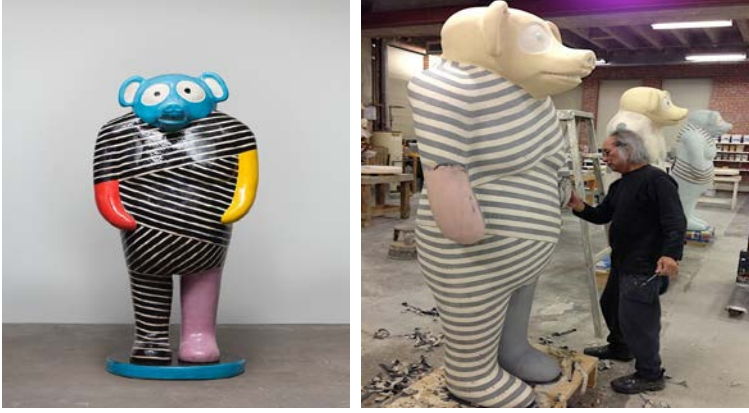
Görsel 2-3: Untitled, Tanuki, "Jun Kaneko" 2014 Hand built & glazed ceramics 76h x 33w x 28d in. 3Ceramic Process 2012 Jun Kaneko working in his Omaha studio.

olaylar karşısındaki insan tepkilerini, yüzlerindeki her türlü ifadeyi ve toplumsal olayları sanatında tüm inceliğiyle kullanmıştır. Jun Kaneko'nun sanat pratiği, geniş bir perspektife ve derin bir gözlem yeteneğine dayanmaktadır. Sanatçı, eserlerinde insan ve doğa arasındaki ilişkiyi seramik heykelleri aracılığıyla yansıtarak kendine özgü bir ifade biçimi geliştirmiştir. Kaneko'nun eserlerinde dikkat çeken bir diğer önemli unsurlardan biri, toplumun içindeki hiyerarşiyi vurgulama becerisi ve renk geçişlerini kullanma yeteneğidir. 8