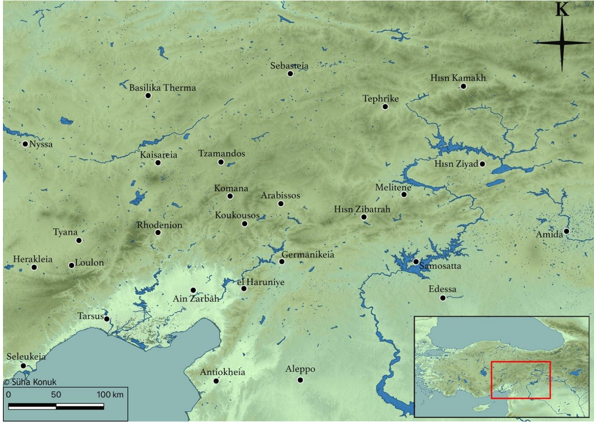
Harita 2. Bizans ile Müslüman Arapların Sınır Bölgesi (VIII – X. yüzyıllar)