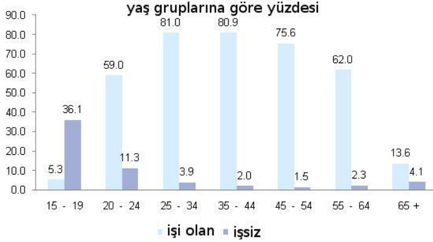
Tablo 2. Temel İş Gücü Verileri