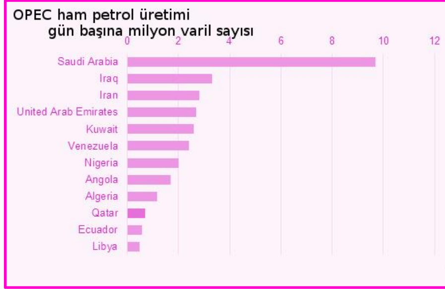
Tablo 3. Dünyada Ham Petrol Üretimi

Bu çerçevede UEA tarafından hazırlanan enerji piyasalarının geleceğine ilişkin tahminler, ülkelerin enerji stratejilerini belirlemeleri için güvenilir bir kaynak oluşturmaktadır. UEA tarafından hazırlanarak yayımlanan "World Energy Outlook" başlıklı belge UEA'nın enerji konusunda 2020 yılına kadar olan dönemi kapsayan projeksiyonlarını ve özellikle petrol arz/talep dengesine etkide bulunması beklenen unsurları içermektedir. Küresel ekonomik büyümenin %3 olarak gerçekleşmesi ve nüfus artış hızının yavaşlaması varsayımından hareketle oluşturulan bir senaryo çerçevesinde hazırlanan söz konusu çalışmada, petrol ve doğalgaz fiyatlarının 2010 yılından sonra artmasının beklendiği kaydedilmektedir. Ayrıca OECD ülkeleri ile OECD üyesi olmayan Asya ülkelerinin ilgili dönemde petrol ithalatına olan bağımlılıklarının artacağı vurgulanmaktadır. Her durumda, dünya petrol kaynaklarının bu dönemde oluşacak talebi karşılamaya yeterli olduğu vurgulanmaktadır. UEA tarafından önümüzdeki aylarda petrol varil fiyatlarında 4-5 Dolar civarında bir düşme olabileceği varsayılmaktadır. Petrol fiyatlarının serbest piyasa koşulları içinde