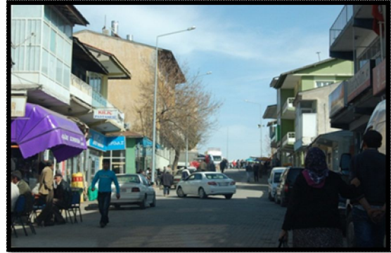
Şekil 5. Yayıların ve araçların iç içe olduğu sokaklar

“Özel taşıtlar yerine uygun alternatif taşıma ve trafiğin toplu taşıma araçları ve yaya alanları ile bütünleştirilmesi için projeler” kriteri kapsamında; Tercan'ın yayaların ve trafik akışının iç içe olduğu bir sokak ve ulaşım sistemine sahip olduğu gözlemlenen bir bulgudur. Bu organik ilişki zaman zaman tehlikeli olabileceğinden, İlçe Trafik Komisyonunun özellikle ana caddede park yasağı uygulama kararı alma aşamasında olduğu öğrenilmiştir. Bu sınırlandırma ilçe içlerinde de uygulanırsa, görsel ve kültürel değerlerin daha iyi korunacağı ve gelişeceği, sokakların yavaş yaşam standartlarının artacağı bir gerçektir. Modern toplumlar artık modernleşme ile birlikte artan makineleşmenin, doğa ve insan hayatı üzerinde oluşturduğu baskı ve negatif etkilerin farkına varmıştır. Evine, bürosuna ve arabasına hapsolan günümüz insanı hem sosyal anlamda niteliksizleşmiş, hem insan sağlığı olumsuz etkilenmiştir. Araçların olabildiğince daha az kullanılması, şüphesiz doğa üzerindeki kirletici etkiyi de azaltacaktır. Ayrıca yayaların kullandığı bir peyzaj estetik anlamda da daha hızlı ve sağlıklı gelişecektir. Turizm anlamında da bu peyzajlar çok daha çekicidir (Şekil 5).