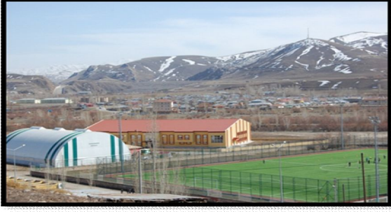
Şekil 6. Futbol sahası ve Spor Tesisleri

metrekare alana kurulu ve çevre düzenlemesi ve gece aydınlatmasıyla birlikte Tercanlı gençlerin ve çocukların hizmetine sunulmuş durumdadır. Saha Türkiye'nin en büyük sentetik futbol sahasıdır (70m-100m) ve burada ayrıca yazları futbol okulu hizmet vermektedir (Şekil 6).