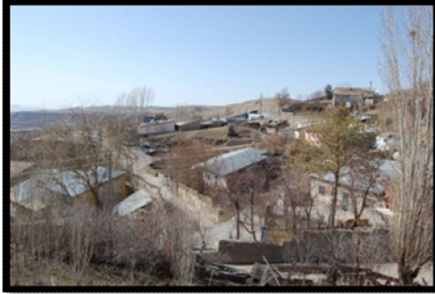
Şekil 7. Mimari karakteri olmayan çirkin yapılaşmalar

İlçe merkezinin güneyinden Türkiye'nin en temiz sularından biri olan Tuzla Çayı geçmektedir. Tercan Barajı'nda dinlenen su, herhangi bir atık