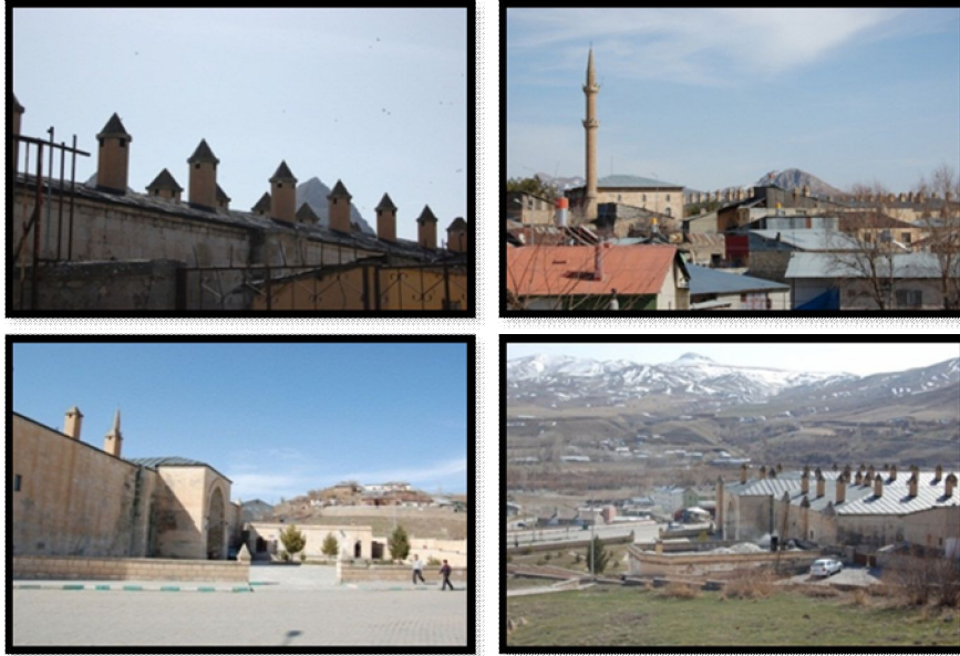
Şekil 3. Farklı açılardan Mamahatun Kervansarayı