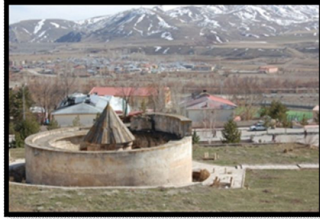
Şekil 4. Kervansarayın yanında kurulan pazar yeri ve Mamahatun Türbesi

“Özel taşıtlar yerine uygun alternatif taşıma ve trafiğin toplu taşıma araçları ve yaya alanları ile bütünleştirilmesi için projeler” kriteri kapsamında; Tercan'ın yayaların ve trafik akışının iç içe olduğu bir sokak ve ulaşım sistemine sahip olduğu gözlemlenen bir bulgudur. Bu organik ilişki zaman zaman tehlikeli olabileceğinden, İlçe Trafik Komisyonunun özellikle ana caddede park yasağı uygulama kararı alma aşamasında olduğu öğrenilmiştir. Bu sınırlandırma ilçe içlerinde de uygulanırsa, görsel ve kültürel değerlerin daha iyi korunacağı ve gelişeceği, sokakların yavaş yaşam standartlarının artacağı bir gerçektir. Modern toplumlar artık modernleşme ile birlikte artan makineleşmenin, doğa ve insan hayatı üzerinde oluşturduğu baskı ve negatif etkilerin farkına varmıştır. Evine, bürosuna ve arabasına hapsolan günümüz insanı hem sosyal anlamda niteliksizleşmiş, hem insan sağlığı olumsuz etkilenmiştir. Araçların olabildiğince daha az kullanılması, şüphesiz doğa üzerindeki kirletici etkiyi de azaltacaktır. Ayrıca yayaların kullandığı bir peyzaj estetik anlamda da daha hızlı ve sağlıklı gelişecektir. Turizm anlamında da bu peyzajlar çok daha çekicidir (Şekil 5).