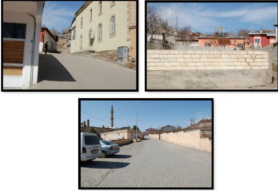
Şekil 8. Uygulamalara örnek mekanlar