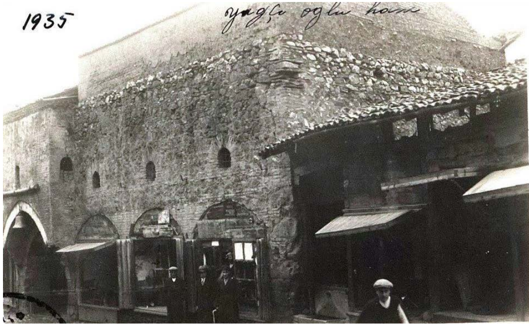
Foto 2: Tokat'ta 1935 yılında Yağcıoğlu Hanı'na ait bir görüntü.

Kırım'da 1754-1758 yılları arasında Fransız konsolosluğu yapan Charles de Peyssonel, Karadeniz ticareti hakkında yazdığı bir kitapta, Tokat'tan Karadeniz'e kıyısı olan birkaç ülkeye ihraç edilen 500.000 toptan fazla pamuklu dokuma ve basmanın, Fransız yünlü kumaşına büyük darbe vurduğunu ifade etmektedir (1787: 47-50). Hatta Genç, Tokat'ın pamuklu dokuma sanayiinin zirveye ulaştığı bu dönemde bahsi geçen miktara Karadeniz'e kıyısı olan diğer ülkelere yapılan ihracat rakamları da eklenirse bu rakamın iki katına çıkacağını söylemektedir (2016: 279-280).