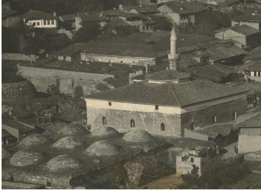
Foto 1: Tokat Bedesteni, Devecihan ve Takyeciler Camii.

Şehirdeki ticari fonksiyonunun çeşitliliğini ve büyüklüğünü ortaya koyan çarşı ve pazarlarla ilgili seyahatnamelerde de önemli bilgiler bulunmaktadır. Nitekim Evliya Çelebi, 17. asrın ortalarında şehirde 13 büyük hanın ismini, nerede olduklarını ve yapıların mevcut durumlarını şu şekilde anlatmaktadır: “Cümle (-) aded kal’a-misâl kârgir kubâblar ile mebnî hân-ı metînlerdir. Evvelâ Düğmeciler Çârsüsunda Taş hân. Cümle kârgir kubâblar ile mebnî kal’a-misâl bir hân-ı kadîmdir. Her gece tabl çalınır. (---) (---) hayrâtıdır. Ve yeniçeri serdârı Fazlî Beşe hânı ve Atbâzârında Abdurrahman Beşe hânı ve Vartan oğlu nâm bir Ermeni bir hân inşâ etmişdir kim cümle Acem sevdâgerânı anda mihmân olurlar. Ve Kapan hânı ve Kebeciler hânı Bitbâzârına karîbdir ve Mutâfçılar içinde Nâzır hânı ve gazzâzlara karîb Kadı hânı ve sarrâchâne kurbunda Sulu hân ve boyacılar kurbunda Sarı Ağa hânı ve Pervâne hammâmı kurbunda Müftî hânı ve Yeni hân etrâfında yetmiş altı aded kârgir kemer binâlî dükkânlar ile mebnî kal’a-misâl bir hân-ı cediddir. Ve Kibleli Paşa vekâlesi gâyet ma’mûrdur ve İpşir Paşa mihmânhânesi çârsü meydânındadır ve Çark Bınarı yanında Çark hânı ve ... (1.5 satır boş)... Bu mezkûr vekâlelerden ziyâde vardır, ammâ meşhûr bunlardır”. (2001: 36).