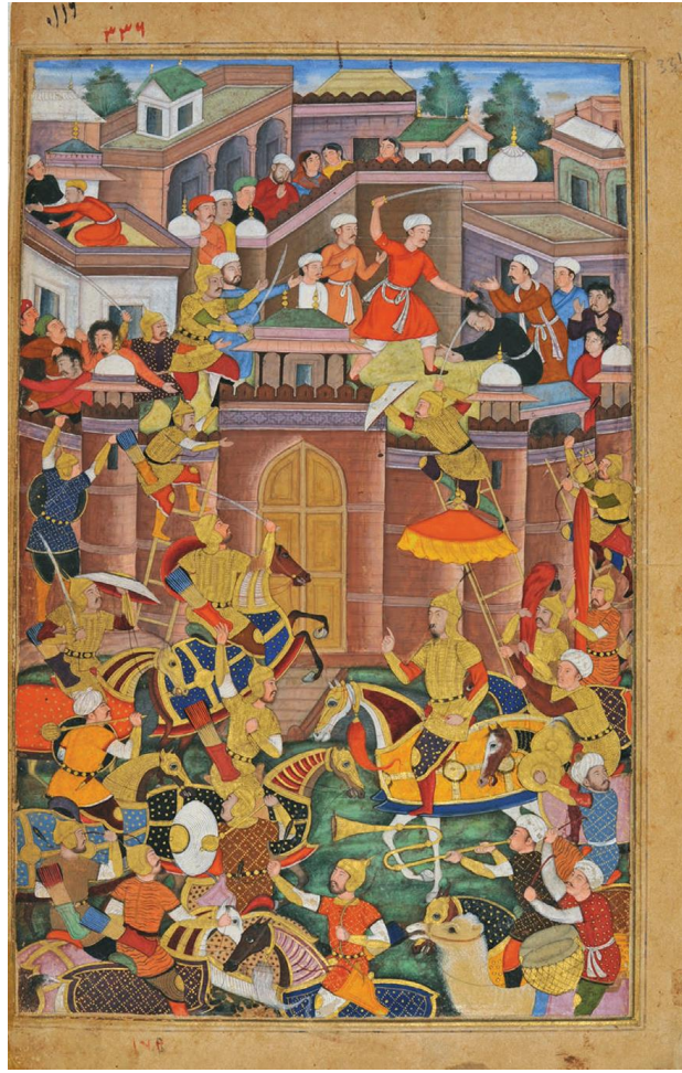
Çendiri Kuşatması (1527-28).