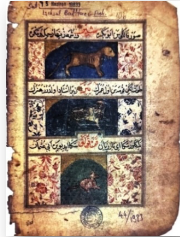
Bektaşoğlu, Habibe (2023), Resimli Osmanlı Fal Kitabı Hurşidnâme , s. 87, "VARAK 10 B RESİMLERİ"

Marifetinde, becerinde usta olmak istiyorsan eğer; halife Ömer'in eteğinden tut, onu bırakma diyerek kaplan halife Ömer'e sevk eder.