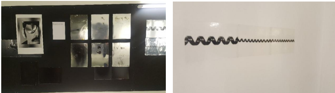
Görsel 1. Henrik Olesen, “Kablolar, Anahtarlar, Gözlükler, Işıklar” Enstalasyonu

Tasarımcı sanatçı araştırma sürecinde 15. İstanbul Bienali “İyi Bir Komşu” sergisini ziyaretinde Henrik Olesen isimli sanatçının enstalasyon çalışmasıyla karşılaşmış ve bu çalışmayı, kendi eseriyle kuramsal ve uygulama temelinde ilişki kurabileceği bir kaynak olarak değerlendirmiştir. Görsel 1’de yer alan eserde görüldüğü gibi Olesen, Bienal için hazırladığı enstalasyon çalışmasında bireylerin çevresindeki insanların dedikoduyu nasıl rahatsız edici biçimde kullandığını, bu kullanımın bireyin sınırlarını nasıl ihlal ettiğini ve bu durumda yaşanan rahatsızlığı işlemiştir.