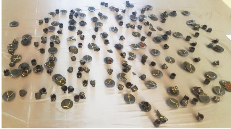
Görsel 7. “Dedikodu” Enstalasyon Çalışması

Bu alandaki sergi açılışı itibariyle sergi tamamlanana kadar eser son haline getirilmiş ve Görsel 7’de gösterildiği gibi şeritler çıkarılmış ve sanat izleyicisiyle arasındaki sınırlar kaldırılmıştır. Enstalasyona sergi boyunca tasarımcı sanatçının gerekli gördüğü aralıklarda taze Türk kahvesi getirilmiş ve eklenmiştir. İzleyicinin sürekli olarak bu kokuya maruz kalması, izleyici ile etkileşimi üst seviyede tutmuştur.