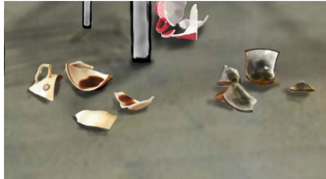
Görsel 2. "Dedikodu" Enstalasyon Çalışması Denemeleri

Türk kahvesinin kültürümüzde dedikodu ile direkt ve böylesine güçlü bir bağı olduğundan tasarımcı sanatçı, enstalasyon çalışmasında Türk kahvesi ve kahve fincanları kullanmıştır. Kullanılan fincanların, dedikodunun olumsuz anlamından etkilenen, dedikodusu yapılmış insanların duygu durumlarını (duygusal kırılmalarını) anlatabilmek/gösterebilmek öncelikle tek kırmış, parçalamıştır. Enstalasyon çalışmasının tasarım aşamasında fikrin somutlaştırılabilmesi için Görsel 2'de gösterilen deneme görsellerini oluşturmuştur.