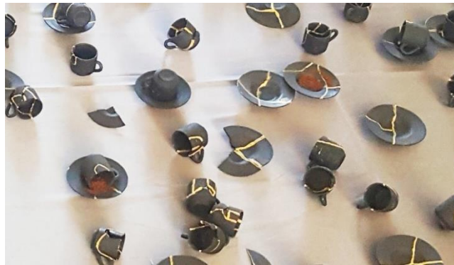
Görsel 4. “Dedikodu” Enstalasyon Çalışması

Çalışmanın deneme sürecinde arttırılan parçaların sergileme şekli yüksek bir platform yerine Görsel 4’teki gibi zeminde, saten ve nötr renge sahip olan bir örtünün üzerinde sergilenecek şekilde güncellenmiştir. Çalışmada, Türk kahvesi fincanı ve tabağı takım olacak şekilde toplam 180 parça malzeme kullanılmıştır. Kullanılan parçalar orijinalinde tamamen beyaz renkte olmasına rağmen, konunun koyu, karanlık ve olumsuz teması dikkate alınarak hepsi siyah mat akrilik boyayla kaplanmıştır.