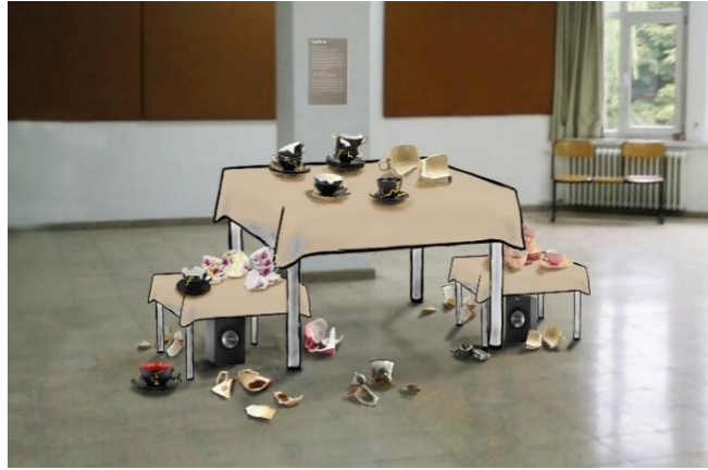
Görsel 3. “Dedikodu” Enstalasyon Çalışması Denemeleri

Denemeler oluşturuldukça eserin sanat izleyicisiyle etkileşiminin artırılmasının, verilmek istenen etki doğrultusunda daha kapsamlı uygulanması gerektiği sonucuna varılmış ve kırılan parça sayısı ve kapladığı alanın büyütülmesi çözümüne başvurulmuştur. Görsel 3’te görüldüğü üzere tüm parçaların kırılmış halde yerde ve bir platform üzerinde sergilenmiş haline izleyici etkileşimini arttırabilmek adına ses sistemi eklenmiştir. Ses sistemi ile serginin aktif olduğu sürelerde kısık sesle fısıltı duyulması hedeflenmiştir.