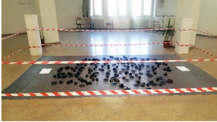
Görsel 6. “Dedikodu” Enstalasyon Çalışması

Tasarımı bitmiş, manifestosu tamamlanmış, sergileme disiplinine karar verilmiş olan enstalasyon çalışması, tasarımcı sanatçının lisansüstü eğitimini tamamladığı Anadolu Üniversitesi Eğitim Fakültesi Güzel Sanatlar Eğitimi Binası Galeri 2’de sergilenmiştir. Sergileme alanında kaldığı süre boyunca alanla bir bütünlük sağlayan eser, sergi açılışına değin dikkat edilmesi ve zarar görmemesi adına Görsel 6’da görüldüğü gibi etrafına şeritler çekilerek korunmuştur.