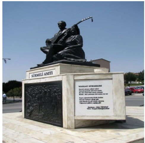
Fotoğraf 6. Yozgat ili müzik kültürünü yansıtan Sürmeli Anıtı (web 6)

Yozgat sürmelisi olarak da bilinen “sürmeli” kültürüyle ortaya çıkan yöreye özgü tavır ve ağız oluşumu gırtlakta, nüanslarda ve duyumda farklılaşarak yeni bir müzik kültürünü oluşturmaktadır. Mavili (2012)’ye göre kadınların seslendirdiği beş farklı sürmeli tavrı vardır ve bu sürmeli tavrı genellikle söyleyen kadınların isimleriyle anılmaktadır. Kadınlar, sürmeli tavrı dışındaki türkülerde de gerek sesleriyle gerekse yaktıkları türkülerle ve çaldıkları çalgılarla yörenin müzik kültüründe yer almışlardır. Kadınlar, Yozgat yöresine ait kadınların söylediği kadın ağız olarak ifade edilen türkülerde yaşadıkları dönemin özelliklerini, geleneklerini, inançlarını, örf ve adetlerini, duygu ve düşüncelerini yansıtmışlardır.