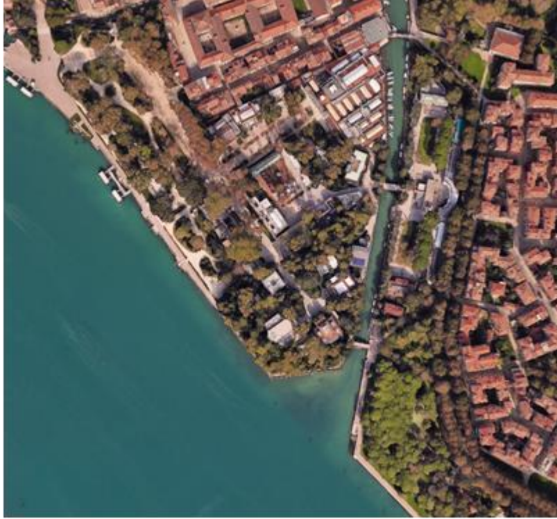
Şekil 6. Giardini hava fotoğrafı, (URL-4).

Bienal dışında da ziyaretçiler tarafından kullanılan konserler, performanslar ve açık hava etkinliklerinin de düzenlendiği bir kentsel mekândır. Şekil 6'da yer alan vaziyet planında bahçenin içinde yer alan yapılar, yeşil alanlar ve su öğeleri görülmektedir.