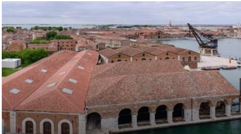
Şekil 3. Arsenale Binası üstten görünüş, (URL-3).