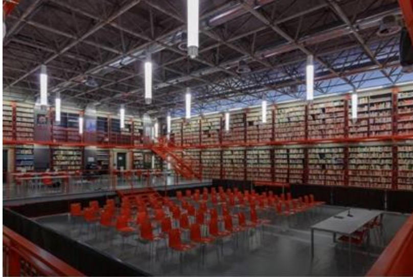
Şekil 4. Bienal kütüphanesi, (URL-3).

Giardini, Venedik'te San Marco Bahçesi'nin doğusunda yer alan bir bölgedir. Bölgede, Venedik Bienali için yapılmış birçok sergi alanı bulunmaktadır. Giardini iki eksen boyunca uzanmaktadır ve ilki şehirden Giardini'nin en doğu ucundaki insan yapımı tepeye doğru; ikincisi deniz cephesinden başlayarak Giardini yönünde devam etmektedir. Alan, 1887 yılında açılan bu alan, Bienal'in kalıcı yerleşkesi olarak kullanılmaya başlanmıştır. Giardini, 19. yüzyıl İtalyan bahçe tarzının özelliklerini taşımaktadır ve günümüzde dünya çapında tanınan turistik ve kültürel bir alandır. Bienal sergi mekânlarının düzenlenmesi çerçevesinde, 2009'da Giardini'deki tarihi Merkezi Pavilyon, 3.500 metrekarelik çok amaçlı ve çok yönlü bir yapıya dönüşmüştür. Bu, sürekli faaliyetlerin merkezi ve diğer Giardini Pavilyonları için bir referans noktası haline gelmiştir. İçinde, uluslararası üne sahip sanatçılar tarafından tasarlanmış alanlara ev sahipliği yapmaktadır; örneğin, Massimo Bartolini (Eğitim Alanı), Rirkrit Tiravanija (Bienal Kütüphanesi) (Şekil 4) ve Tobias Rehberger (Kafeterya). Merkezi Pavilyon'un çok amaçlı bir yapıya dönüştürme projesi, 2011'de sergi alanlarının ve giriş holünün düzenlenmesiyle tamamlanmıştır. O tarihten itibaren Merkezi Pavilyon, eğitim faaliyetleri, atölyeler, bahçeler (Şekil 5) ve özel projeler gibi çeşitli ve çok sayıda kullanım amacına uygun optimal mekânsal ve mikro iklim koşullarından yararlanabilmektedir (URL-3).