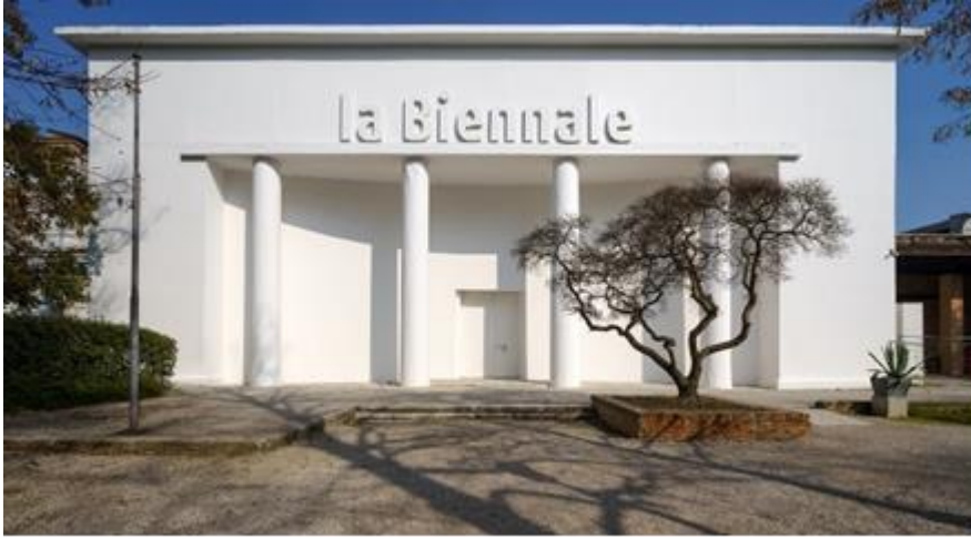
Şekil 7. İtalya Pavilyonu, (Campolonghi, 2022).

İlk bienal döneminde, sergi salonlarını sergileme yöntemi olarak, resimler üst üste asılarak salonlar, yabancı sanatçıların ve İtalyan sanatçıların eserleri arasında dönüşümlü olarak yerleştirilmiştir. Sergide, birçok eser satılarak turizme yönelik pazarlama stratejisi geliştirilmiş ve bir satış ofisi aracılığıyla satış işlemleri yönetilmiştir. Bu süreçten sonra İtalyan sanatçıların kendilerine ayrılan alanın yetersiz olduğundan şikâyet etmişlerdir. Çözüm olarak, 1907'de Bienal'in Genel Sekreteri Antonio Fradeletto, yabancı sanatçıların Giardini'nin çevresi içinde inşa edilecek özel ulusal pavilyonların yapılmasını önermiştir. Ortaya çıkan bu ihtiyaçlar doğrultusunda Belediye, tüm sorumluluk ve masraflar pavilyonu yapan ülkeye ait olacak şekilde bir anlaşma yaparak ülkelerin alan kullanımını da kent için ekonomik katkıya dönüştürmüştür. Alınan bu karardan sonra 1907 yılında Giardini'de ilk pavilyonunu kuran ülke Belçika olmuştur. Giardini'de, sonuncusu 1995'te Güney Kore tarafından inşa edilmiş olan 34 ülkeyi temsil eden 30 ulusal pavilyon bulunmaktadır (Martini, 2005). İngiltere pavilyonu 1917 yılında, İsviçre pavilyonu 1932 yılında, İtalya pavilyonu 1930 yılında inşa edilmiş tarihi binalardır (Şekil 7).