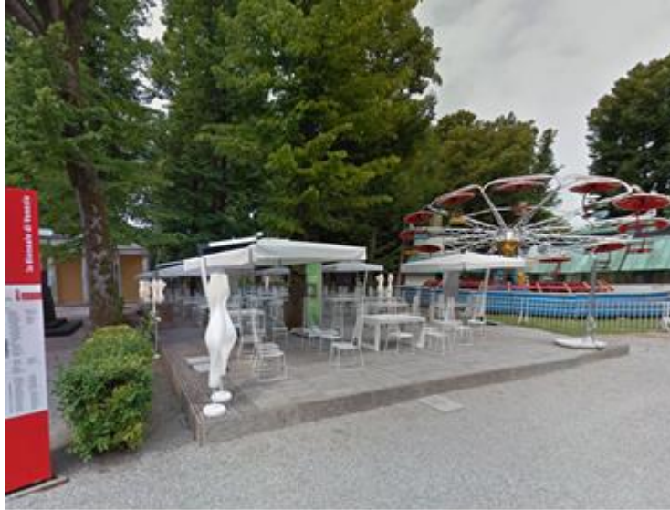
Şekil 12. Sosyal alan örneği (URL-4).

Bienal Bahçeleri, Venedik Bienali'nin ana sergi mekânlarından biri olması sebebiyle binlerce sanatseverin buluşma noktasıdır. Bu nedenle, bahçeler, sanatseverler arasında bir sosyal etkileşim merkezi olarak işlev görmektedir. Bahçeler, Venedik Bienali sırasında düzenlenen birçok sanat etkinliğine ev sahipliği yapmaktadır. Bu etkinlikler, sosyal ve kültürel canlılığı artırmakta ve farklı kültürlerden insanları bir araya getirmektedir. Venedik Bienali, kültür turizminin önemli bir örneğidir ve Giardini de bu turizmde önemli bir rol oynamaktadır. Bienal, sanatseverlerin yanı sıra turistleri de çekmekte ve turistlerin Venedik'in kültürel mirasını keşfetmelerine olanak tanımaktadır. Bahçeler, aynı zamanda Venedik Bienali sırasında düzenlenen açılış törenleri, partiler ve diğer sosyal etkinlikler için de kullanılmaktadır. Bu etkinlikler, Venedik Bienali'ne katılan sanatçılar, sanatseverler ve diğer ziyaretçiler arasında sosyal etkileşimi artırmaktadır. Bienal, genç sanatçıların yeteneklerini sergilemeleri için bir platform sağlamaktadır. Aynı zamanda, bahçelerde genç sanatçıların diğer sanatçılar ile tanışması ve sosyalleşmesine imkân vermektedir (Şekil 12). Tüm bu faktörler bir arada değerlendirildiğinde, Venedik Bienali Bahçeleri olan Giardini, sanatın sosyal, kültürel, turistik ve çevresel canlılık etkilerini bir arada gösteren önemli bir platformdur.