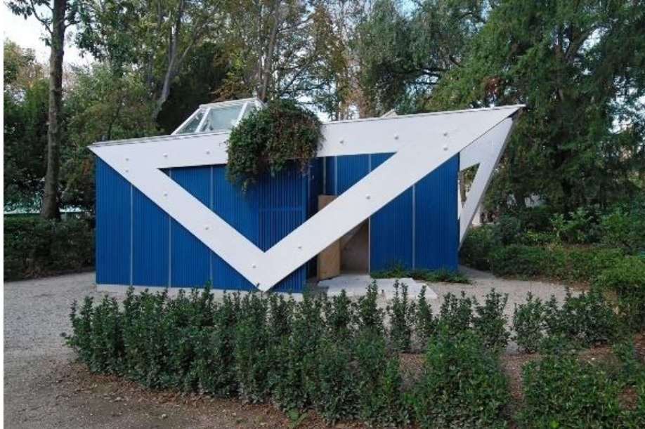
Şekil 10. Alvar Aalto Pavilyonu (URL-7).