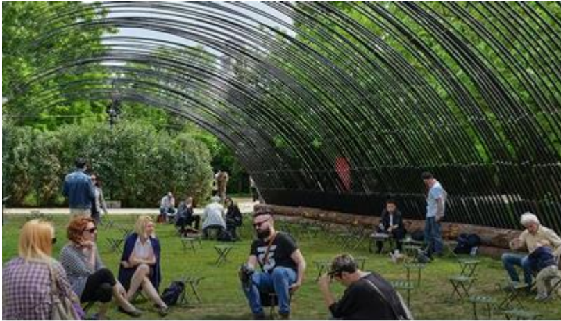
Şekil 5. Bahçeler, (URL-3).