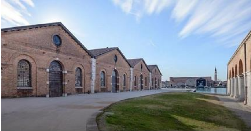
Şekil 2. Arsenale Binası açık alanı, (URL-3).

Venedik Bienali, Venedik kenti içerisinde çeşitli mekânlarda düzenlenmektedir. Bienalin ana sergi mekânları, Giardini ve Arsenale bölgelerinde yer almaktadır. Arsenale, Giardini'nin yakınında yer alan eski büyük bir tersanedir ve bienalin ana sergi alanlarından biridir. Arsenale, büyük bir sergi alanı ve birçok farklı galeri ve mekânını bünyesinde barındırmaktadır (Şekil 2 ve Şekil 3). Bienalin bu bölgesinde genellikle büyük ölçekli eserler, heykeller, enstalasyonlar ve performanslar sergilenmektedir (URL-3).