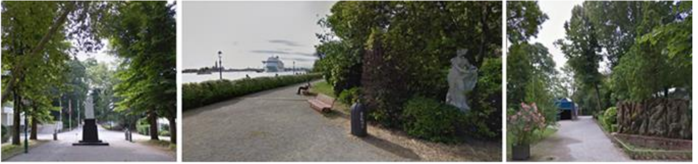
Şekil 11. Parkın içerisinde yer alan çeşitli heykeller ve manzaralar (URL-4).

Giardini, zengin bir bitki örtüsüne sahiptir ve çevresindeki su kanalları da dahil olmak üzere birçok ekolojik özellik barındırmaktadır. Bu nedenle, bahçelerin korunması ve sürdürülebilirliği, ekolojik etkileri de dikkate alınmalıdır. Giardini bahçeleri, aynı zamanda birçok kuş, böcek ve hayvan türüne ev sahipliği yapmaktadır. Bu nedenle, doğal yaşam alanı sağlamakta ve biyolojik çeşitliliği artırmaktadır. Giardini, bünyesinde barındığı farklı bitki türleri ile havadaki karbondioksit miktarını azaltmakta ve hava kalitesini iyileştirmektedir. Bahçeler, yağmur sularını emerek suyun toprağa nüfuz etmesine yardımcı olmaktadır. Bu sayede, su kirliliğini önleyerek su kaynaklarını korumaktadır. Bahçelerde yer alan bitkiler, kökleriyle toprağa tutunarak toprak erozyonunu önlemektedir. Bahçeler bünyesinde barındırdığı farklı bitkiler form, renk ve doku gibi özellikleri ile estetik açıdan güzel bir görünüm sunmakta ve insanların doğayla daha fazla bağlantı kurmalarına yardımcı olmaktadır. Bu nedenlerle, Venedik Bienal Bahçeleri olan Giardini, Venedik'teki doğal yaşamın ve biyolojik çeşitliliğin korunmasına ve kentin estetik ve ekolojik değerine katkıda bulunmaktadır.