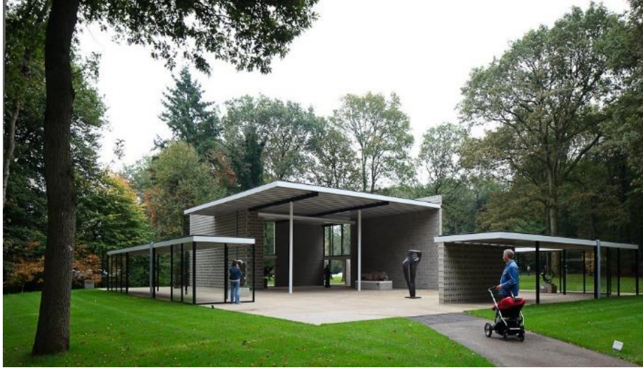
Şekil 9. Gerrit Thomas Rietveld Hollonda Pavilyonu (URL-6).