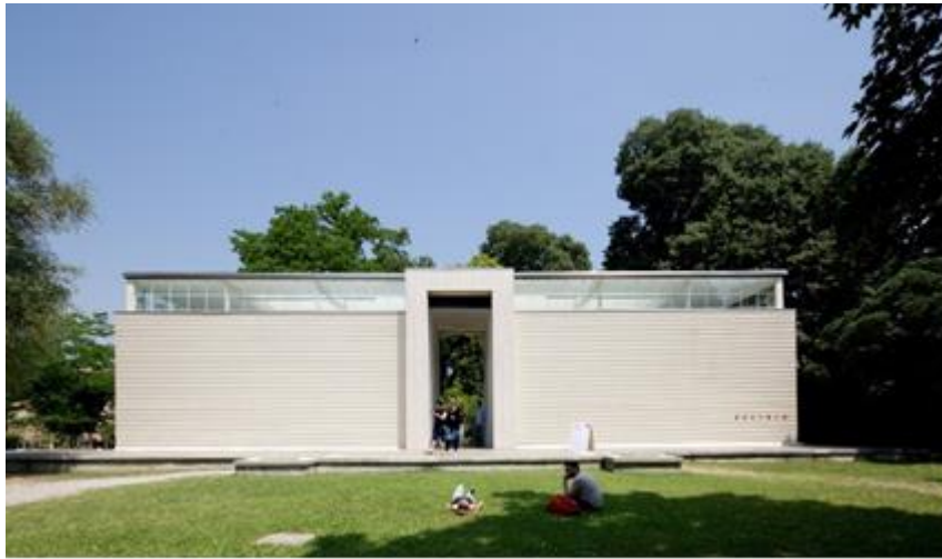
Şekil 8. Josef Hoffmann'ın Avusturya Pavilyonu (Leardi, 2018).

Giardini şu anda, bazıları Josef Hoffmann'ın Avusturya Pavilyonu (Şekil 8), Gerrit Thomas Rietveld'in Hollanda pavilyonu (Şekil 9) veya Alvar Aalto tarafından tasarlanan yamuk planlı prefabrike Finlandiya pavilyonu (Şekil 10) gibi ünlü mimarlar tarafından tasarlanmış 29 yabancı ülke pavilyonuna ev sahipliği yapmaktadır (URL-4).