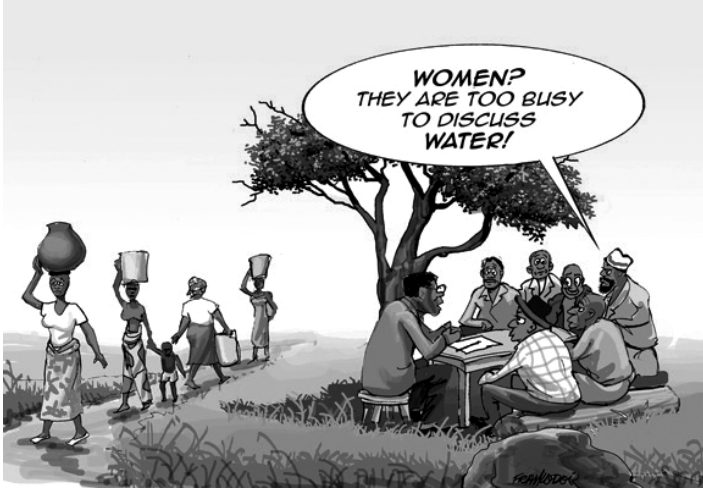
Şekil 1: Kadın ve Kalkınma / Karikatür