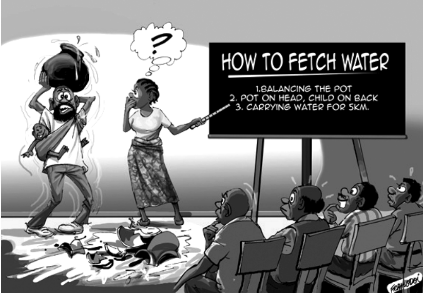
Şekil 2: Ücretsiz Bakım ve Ev İşleri / Karikatür