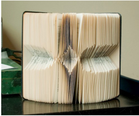
Resim 7. E'Map ed Veveis', 1990

İsteyen herkesin kendi görsel imgelerini ve kişisel tipografik yaklaşımını uygulayabileceği bir alanı olarak sanatçı kitapları dijital ortamda okunabilen ve çevre duyarlılığına bağlı olarak hızla yayılan e-booklara rağmen gelecekte de üretilmeye devam edecek gibi görünmektedir.