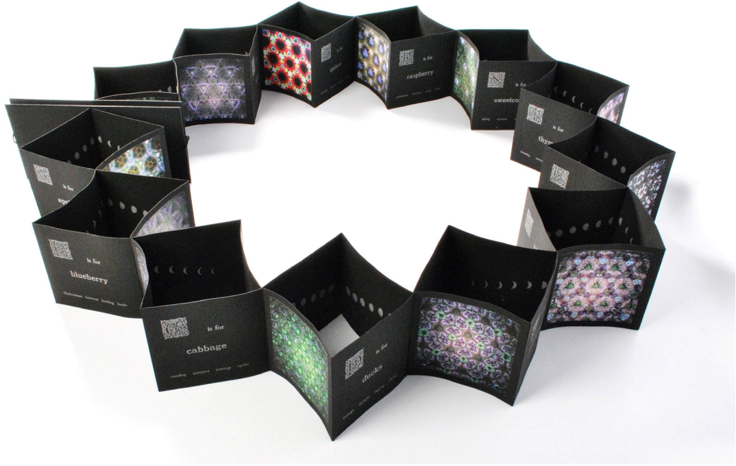
Resim 6. Francine Isaacs 'Kaleidoscopic Visions of Paradise', 2010

rının bir anlatım biçimi olarak 1960'lı yıllardan bu güne giderek artan bir ilgi görüyor olması artık kapitalist sistemin bir ürünü haline gelmiş nitelikli kitabı prestijli bir mülk olmaktan çıkartıp daha demokratik hale getirerek sisteme bir eleştiri ve alternatif oluşturmaktadır. (Yıldız, 2012: 177)