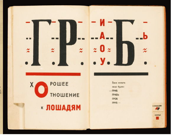
Resim 4. El-Lisitzsky, 'Dlya Golosa', 1923

Sanatçı kitapları 1960'larda popülerlik kazanmış ve 1970'ler boyunca popülerliğini genişletmeye devam etmiştir. 1980'li ve 1990'lı yıllarda çok daha fazla sanatçı kendini ifade