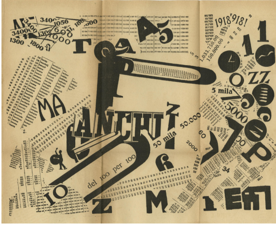
Resim 3. Filippo Marinetti, 'Zang Tumb Tumb', 1914

mayacak bir boyut kazanmış, kitap tasarımı grafik tasarımı için önemli bir çalışma alanı olarak yerini korumuştur.