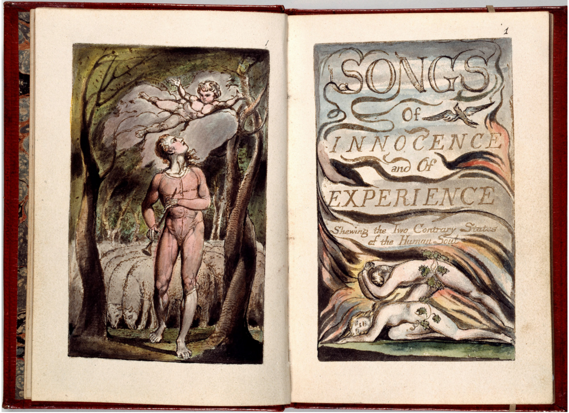
Resim 1. William Blake, 'Songs of Innocence and of Experience' 1789