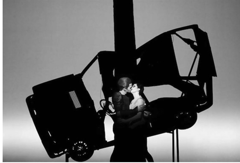
Resim 7. Shakespeare Sone.

İki bölüm de 7 sahneden oluşur; bu sahneler birbirlerini yansıtarak birer ayna görevi