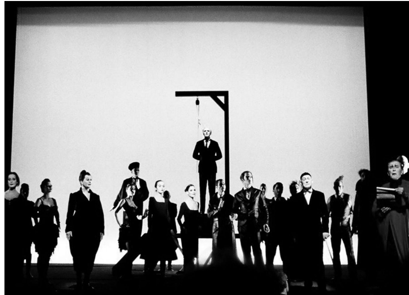
Resim 4. Üç Kuruşluk Opera.