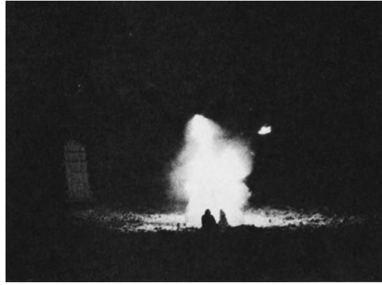
Resim 3. Basil Langton's photograph of the burning ape on Ka Mountain See The Drama Review, Vol 17, No. 2, June 1973.

hafta gibi kısa bir zamanda yazmıştır. Provasını yazarken yapan Wilson, her güne bir konu, bir renk, bir tema seçmiştir. Ka Mountain and Guardenia Terrace, Haf Tan Dağı'nda yedi gün süren ve doğal peyzaj etrafında düzenlenmiş bir gösterimdir. Oyun dağın önüne konulan bir çerçeve sahnede başlar. Oyunda 30 School of Byrds sanatçısı ve baştan sona zürafalar, kaplanlar, ayılar, baykuşlar ve su canlıları ile doludur.