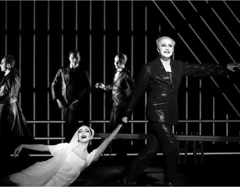
Resim 5. Üç Kuruşluk Opera.

Wilson'ın sanatında Shakespeare önemli bir yeri olduğu, belirli ve bilinen bir gerçektir.