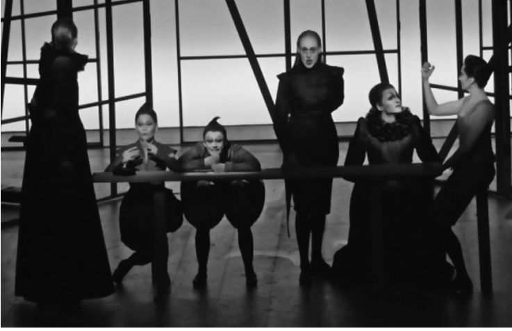
Resim 6. Shakespeare Sone.

Wilson 154 soneden sadece 23'ünü kullanarak sahnede kendi dünyasını Shakespeare'den de bağımsız bir biçimde kurmaktadır. Hem de bu kurduğu dünyanın içine de Shakespeare'i de dahil eder. Sadece yazarı dahil etmekle kalmaz sahnede gerçekleşenlere dışardan bakarak uzaktan uzağa Brecht'e bir gönderme yaparak bir travestiye de sahnelemesine eklemiştir.