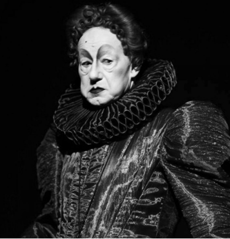
Resim 8. Shakespeare Sone.

özgü figürler içinde yer alır. Sahneyi 'paylaşan' oyunculara, bu alışılmışın dışındaki uzamsal göstergelerin hakim olduğu yöntem içerisinde, birbirleri ile çoğu zaman hiçbir etkileşimde bulunmazlar. Bu doğrultuda "Wilson'un dili parçaladığı görülür.