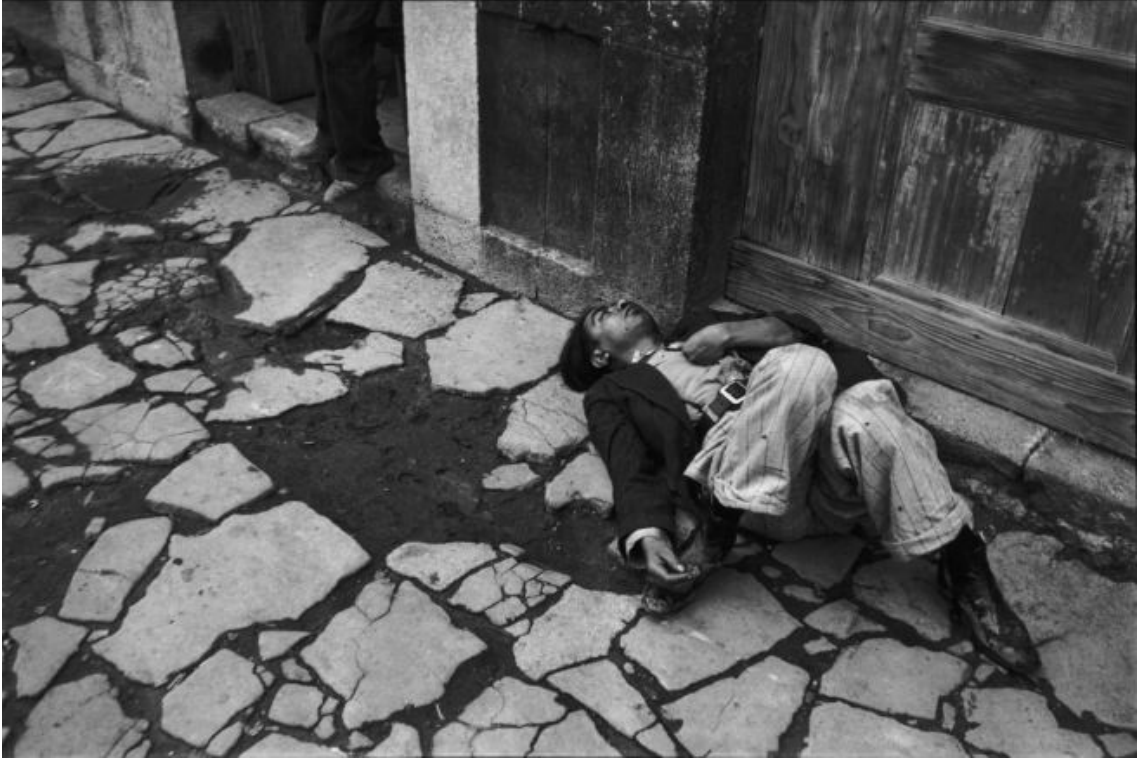
Resim 1. Henri Cartier-Bresson, Mexico, 1934

temsil alanı, anlam nesnesi, eleştirel çağrı, kavram gibi-bir takım anlam katmanlarına değinmek gerekmektedir. Fakat burada ele alınmak istenen snapshot fotoğraf mantığıdır.