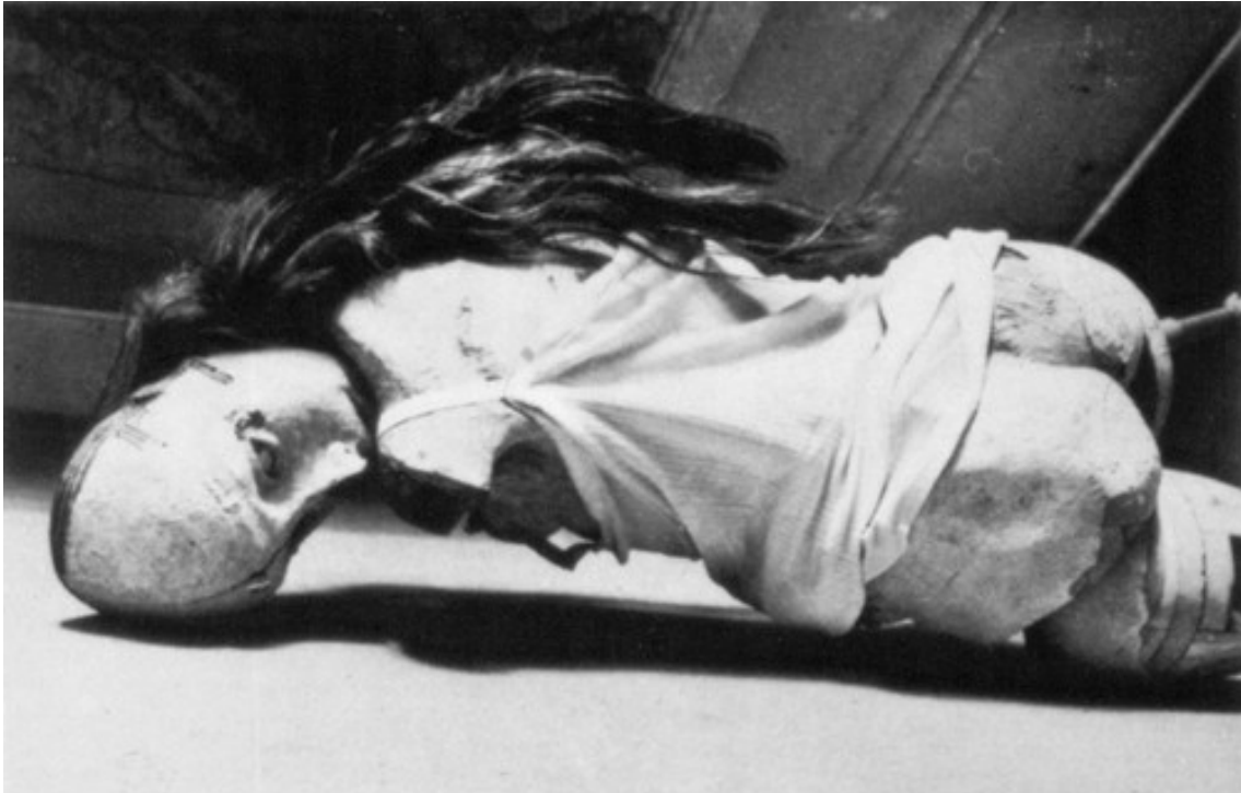
Resim 4. Hans Bellmer, Doll

"Etkinin bilincine vardığımızda gözümüz onu çoktan dönüştürmüştür; o artık bizim damgamızı taşımaktadır, yarı yarıya bize aittir, düşüncemiz onunla ilgilenmeye başladığı anda zaten algılanmıştır. Goethe; "Dünyaya dikkatle baktığımız her keresinde teori yaparız" der. Zira baktığımız nesne üzerinde düşünmediğimiz sürece onu gerçekte hiç de görmeyiz. Görmek her zaman tanımadır. Gözün zihne teslim etmediği, onun da alıp