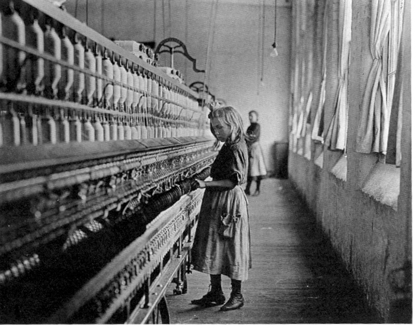
Resim 3. Lewis W. Hine, Child in Carolina cotton mill, 1908