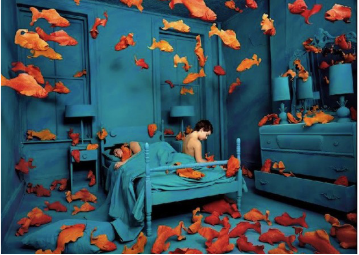
Resim 5. Sandy Skoglund /Revenge of the Goldfish

düşünceye dönüştürmediği etkilerin biçimi yoktur. Ona biçim veren biziz. Bir ağacı düşünme gücümüzle görürüz; bu güç olmasaydı o yalnızca bir renk duyumu olurdu.” (Bkz. Batur, 2000: 225)