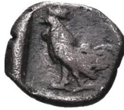
Şekil 2: Troas sikkeleri üzerinde horoz figürü.

Troas ile Mysia arasındaki stratejik bir bölgede konumlanan antik Antandros kentinde MÖ 5. Yüzyıl'a tarihlenen 3.5 yaşlarında bir çocuk mezarında bulunan horoz figürü yine benzer örnek oluşturmaktadır 43 . Bölgede horoz figürüne mezarlar dışında da rastlanılmıştır. Troas bölgesi kentlerinden bir diğeri Dardanos'a ait MÖ 3. ve 4. Yüzyıl'lara tarihlenen sikkenin bir yüzünde yine horoz figürü yer almıştır. Troas sikkeleri (Şekil 2) üzerinde ise bu figür örnekleri oldukça çok sayıdadır 44 .