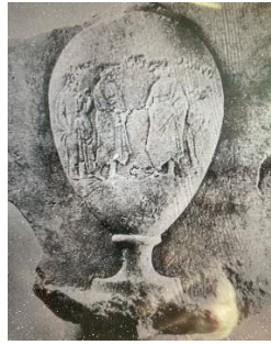
Şekil 1. Çocukların yetişkin rolüne işaret eden mezar taşı. (Grossman, 2007, s. 317).

ergen kızların mezar taşlarında, kızlar mantolarıyla ve festival kostümleriyle resmedilmişlerdir 21 (Şekil 1).