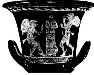
Şekil 3: Genç erkeklerin mücadelesi. (Csapo, 2006, s. 12)

Yine yakın bir coğrafya olması bakımından Denizli Leodikeia 2013 yılı kazı çalışmalarında Şimşek'in arkeolojik çalışmalarında gladyatör horozlar olarak adlandırılan, karşılıklı kavga eden iki horoz betimlemesi elde edilmiştir 52 . Hellas'da horoz dövüşleri bir spor olarak ergen erkekler ve genç aristokratlar için aynı zamanda bir eğlence etkinliğidir. Hellen sanatında dövüşen horozlar erkek çocuklarla ilişkilendirilmiştir 53 . Genç erkek ile horozun bir arada olduğu amphora örneklerine arkaik çağdan itibaren rastlanılmaktadır 54 . MÖ 423 dolaylarına tarihlenen bir seramikte (Şekil 3), genç iki erkeğin savaşı sahnelenmektedir. Resimde ayaklarının arkasındaki çıkıntıya kadar genç erkekler ayrıntılarıyla horoza benzetilmeye çalışılmıştır.