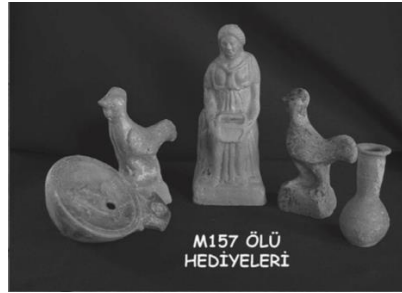
Şekil 6: Parion M157nolu çocuk mezarı buluntuları. (Başaran vd., 2012, s. 357).

Anadolu'da Aizanoi'de 2016 yılı araştırmacıların kazı sonuçlarında, MS 1. Yüzyıl dolaylarına tarihlenen 3 nolu mezar, inhumasyon gömü özelliği göstermiştir. Bir diğer inhumasyon gömü türüne 6 nolu çocuk mezarda rastlanılmıştır 87 . Yine Parion antik kenti 2011 yılı çalışmaları sonucunda inhumasyon gömü özelliğine sahip M155 nolu çocuk mezarları bulunmuştur 88 (Şekil 6).