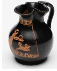
Şekil 5: Chous testisinden şarap içen çocuk figürlü kap 69 .