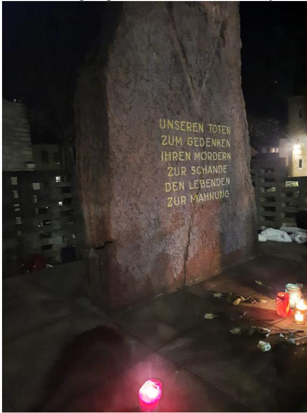
Ek 4: Thüringen eyaleti, Jena şehrindeki anıt: „Unseren Toten zum Gedenken/Ihren Mördern zur Schande/Den Lebenden zu Mahnung“ (Ölülerimiz Anısına, Katillerini Utandırmak, Yaşayanları Uyarmak İçin) [Kasım 2022]