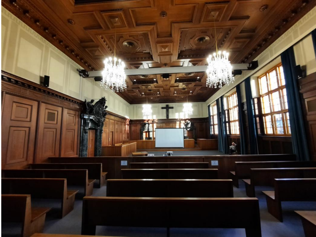
Ek 2 : Nürnberg Yargılamalarının yapıldığı ve bugün yargılamalara dair pek çok kaynağa erişimin mümkün olduğu, müze olarak kullanılan yapıdaki ana yargılama salonu (Ekim 2022).