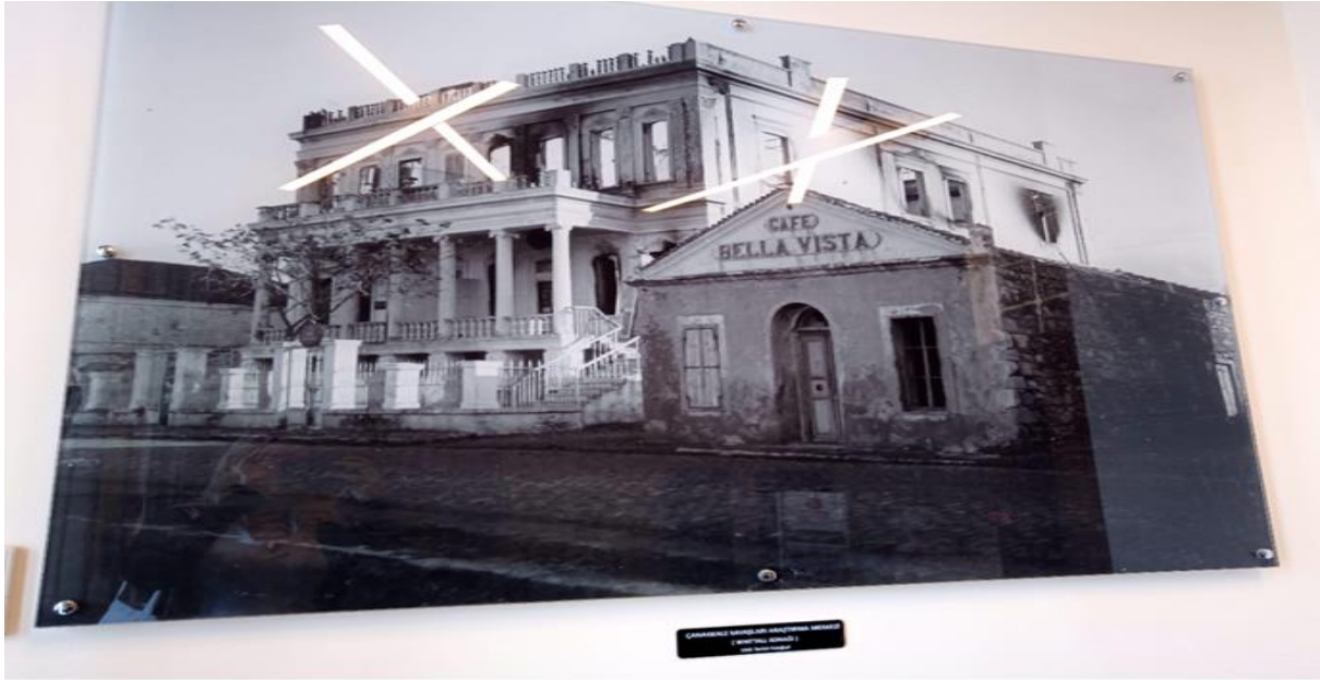
Resim 8. 1932 Yılı Whittall Konağı Görünümü