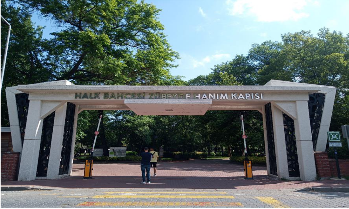
Resim 3. Halk Bahçesi Kapısı