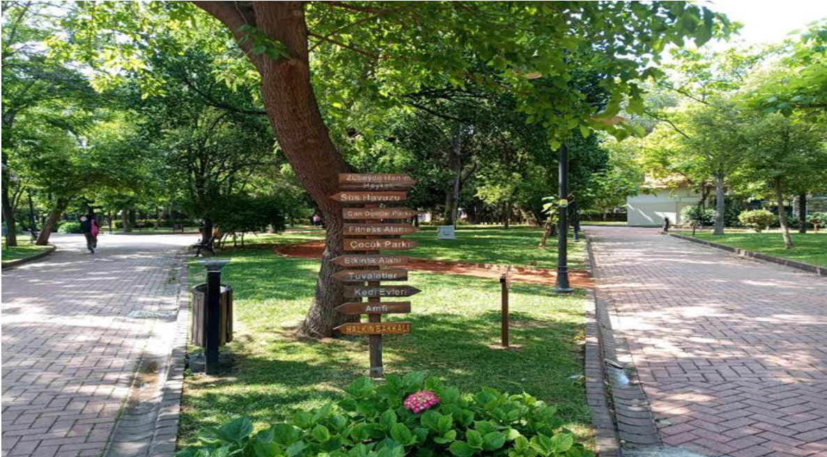
Resim 4. Halk Bahçesi İçerişi