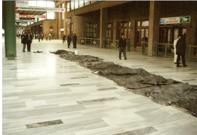
Şekil 4. Selim Birsnel, Kurşun Uykusu, 1995

Kamusal niteliğiyle sayısız kişinin de bellek yükünü taşıyan bir “alan” olarak gar, sanatçılar tarafından yolcularla ilişki estetiğinin kurulabileceği bir sergileme “olanağı” olarak kullanılmıştır. Selim Birsnel’e göre, Claude Leon’un garın çeşitli bölgelerine serpiştirdiği teleskopa benzeyen ayna işini en iyi oralarda dolaşan ayyaş anlamıştır: "Bunlar işte bize bakıyor, hep bizi izliyorlar, kontrol ediyorlar" der 2 . Ayşe Erkmen “demiryolu” fikrinin sinemadaki temsillerinden kolajladığı görüntüleri, televizyon ekranından yolculara aktarır, temsil ile gerçek içiçe geçer, aynada çoğalan imajlar gibi. Vahap Avşar ise “Dönüş” adlı videosunda garın döngüsel bir akışta haritasını çıkarmıştır; gidenler, kalanlar ve iç mekânın tüm strüktürel unsurları, beton ve insanın “sıradan” yaklaşması en azından bir seferliğine kayıt altına alınır (Gürdaş, 2019, s. 246).