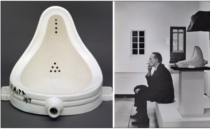
Resim 3. Marcel Duchamp, “Fountain” (Çeşme), 1917.

“O yıllarda sanatçıların kendi yüksek sanat miraslarının dışında bir şey aramaları pek enderdi; ayrıca Afrika oymalarının çoğu Avrupa sanat gelenekleriyle kesin bir karşıtlık içindeydi. Bu garip, bize uzak ve bir anlamda zaman dışı sanatın gücünü ilk gören ve sanatçı arkadaşlarına gösteren kim olursa olsun, yaratıcı sanatın altın madeninde, zamanla hepimize açılacak zengin bir damar bulmuş oluyordu.” (Lynton, 1982, s. 29).