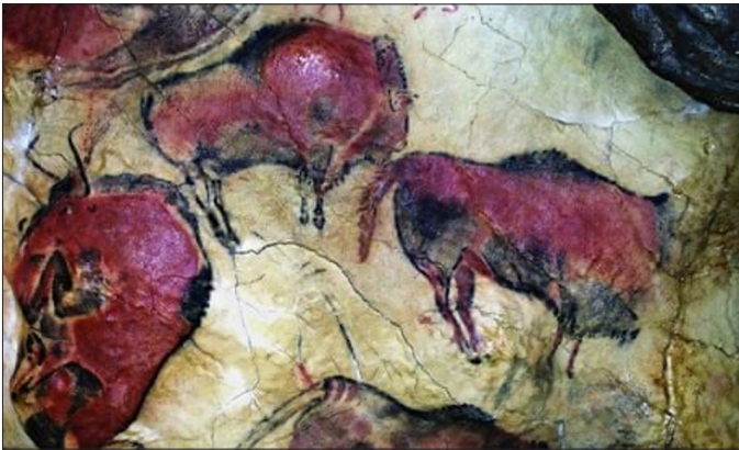
Resim 2. Altamira Mağarası Resimleri

bağımsız bir güzellik imgesiyle yüzleştirir." (Kris & Kurz, 2013, s. 50). Bu yaklaşım doğanın kusurlarını örtlen güçlü bir figür olarak sanatçının özgün yönüne işaret eder. Milattan önce sanatçının kimliğini pekiştirme adına açılan bu yol, hiç kapanmamış ve süreç içerisinde sanatın kendisi kadar önemli bir ilgi alanı haline gelmiştir. Sanatçının hayal gücüne yapılan vurgular artmış, bu vurgular özellikle Rönesans döneminde 'eserin özenli bir biçimde ortaya konmasına' harcanan gayret ve emekle birlikte sanatsal coşkuya verilen değerlerin artmasına doğru ilerlemiştir. Bu ilerleme, sanatçı olgusunun modern olanla ilişkili olduğunu düşündürür. En azından sanatçının varlığının araştırılmaya başlanmasının modern olanın sanatçıyı ön plana çıkaran pratiğinin tecrübe edilmesinden sonra denk geldiğine dair güçlü bir argümandır.