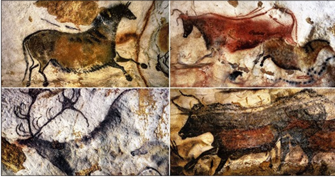
Resim 1. Lascaux Mağarası Resimleri