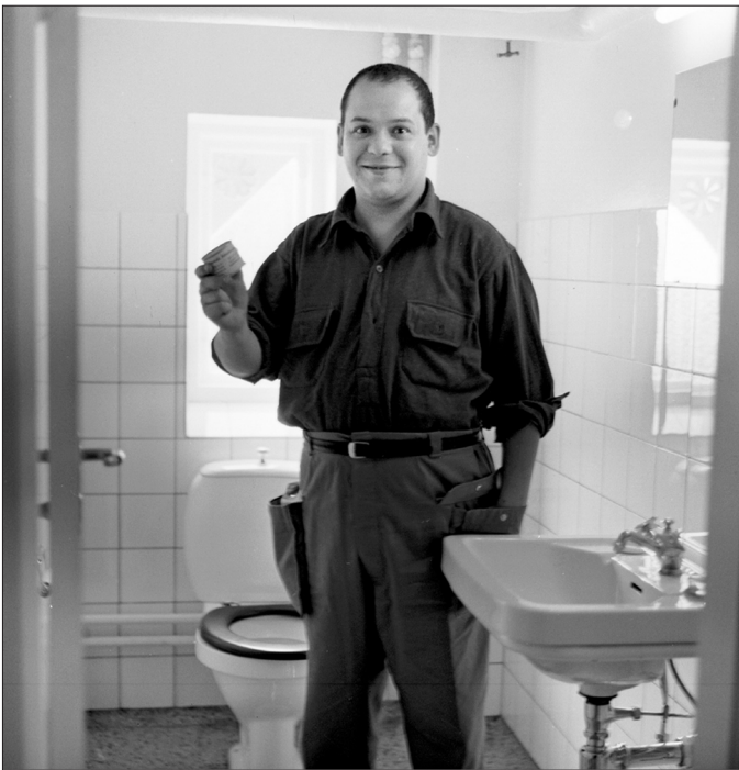
Resim 4. Piero Manzoni, “Merda d’artista ile Sanatçı”, Angli Gömlek Fabrikası, Herning, Danimarka, 1961.

20. yüzyılın başından itibaren sanatçı, sanatın kendisinden daha öndedir. Yaşadığı çağın sosyolojik imkânlarını ya da insanlığın maruz bırakıldığı travmaları (art arda savaşlar gibi) bireyin odakta olduğu bir anlama biçimiyle estetize eder ve her fırsatta farklı yollar dener. Bireyin ön planda olduğu bu atmosfer, kimi zaman Duchamp ve Manzoni gibi avangard çıkışlar yapan sanatçıların ortaya çıkmasıyla; bir taraftan sanatta modernist yansımaları göstermeleri bağlamında değerlendiren yapıcı yaklaşımların diğer taraftan sanatçının konumunu sorgulatan eleştirel tavırların önünü açar (Resim 3, Resim 4).