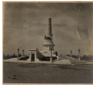
Görsel 2: Abide-i Hürriyet Anıtı.