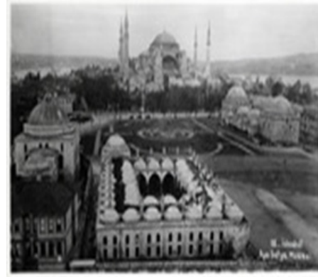
Görsel 4: Ayasofya Camisi.