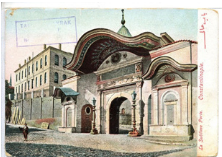
Görsel 1: Bab-ı Ali Kapısı.

Adana Dârümuallimîn izci gurubu öğrencilerinin İstanbul gezi programının amacının bilimsel araştırma ve incelemede bulunmak olduğu gezi programında ifade edilmiştir. Gezi sonunda bu amaca ulaşıp ulaşılamadığını bilemiyoruz. Şüphesiz bu kazanımı ölçecek bir ölçme- değerlendirme imkânının varlığı bugün bile tartışmalıdır. Öğrenciler açısından seyahatin, dönemin şartları düşünüldüğünde, gerçekten ilgi çekici olduğu düşünülebilir. Okulda öğretmenlerinden duydukları, sosyal çevrelerinde gidip-gelenlerin anlattığı payitahtı merak ettikleri muhakkaktır. Gezi planı belli olduğunda ise heyecanlı oldukları bugünden tahmin edilebilir. Dönemin şanslı öğrenci gruplarından biri içerisinde oldukları da söylenebilir. Hele ki o dönem yıldızı parlayan Enver Paşa ile yüz yüze görüşmüş olmaları onlar için unutulmaz bir anı olsa gerektir.