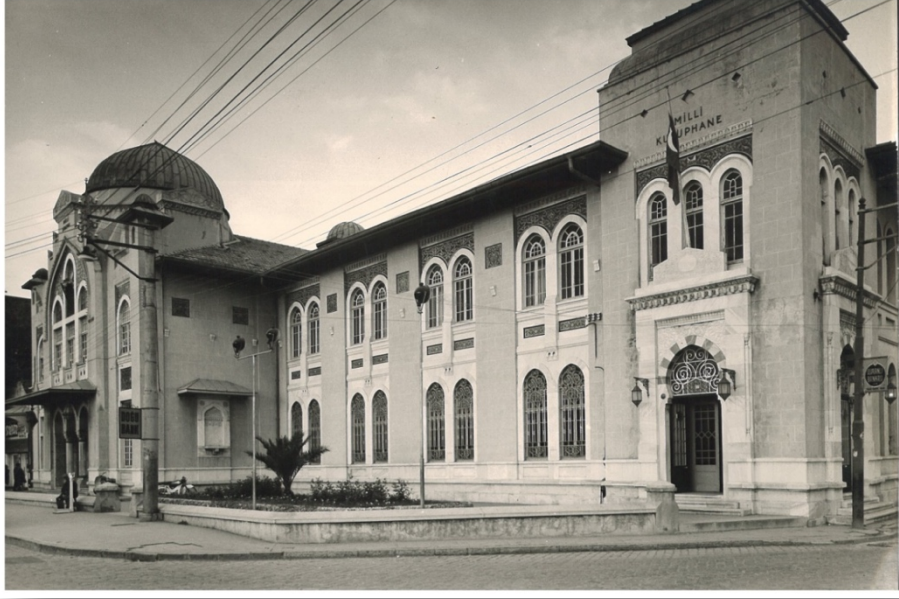
Foto. 2. İzmir Milli Kütüphane ve Milli Sinema Genel Görünüş