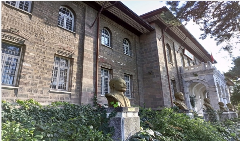
Foto 5. İzmir Kız Lisesi (İttihat ve Terakki Erkek Muallim Mektebi) Giriş Cephesine Kuzey'den Bakış.