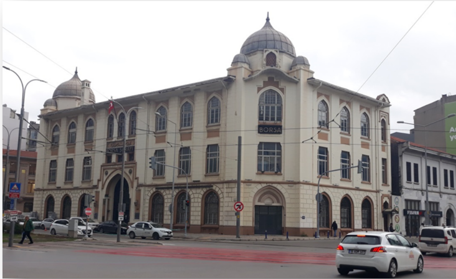
Foto. 6. İzmir Borsa Sarayı Genel Görünüş.

Mimarın kariyerinin ikinci aşamasını oluşturan bu dönemde, Tahsin Sermet Bey tasarımlarıyla Cumhuriyet öncesinde olduğu gibi Cumhuriyet'ten sonra da İzmir'in mimari çizgisinde öncü bir rol üstlenmiştir. Bu dönemde I. Ulusal Mimari etkisinde tasarladığı yapılarla birlikte bu değişimi şehirde görmek mümkündür. 1891 yılında kurulan Türkiye'nin ilk Ticaret Borsası, Cumhuriyet'in birinci kuşak mimarlarından Tahsin Sermet Bey'in Gazi Bulvarı'nda I. Ulusal Mimari stilinde tasarladığı ve içerisinde bir mimar kitabesinin yer aldığı yeni Borsa Sarayı'na (İzmir Ticaret Borsası) taşınmıştır (Güner 2005: 119). 1928 yılında görkemli bir törenle açılan İzmir Ticaret Borsası binası, Tahsin Sermet Bey'in Cumhuriyet'ten sonra kente kazandırdığı yapılardan biridir (Foto. 6).