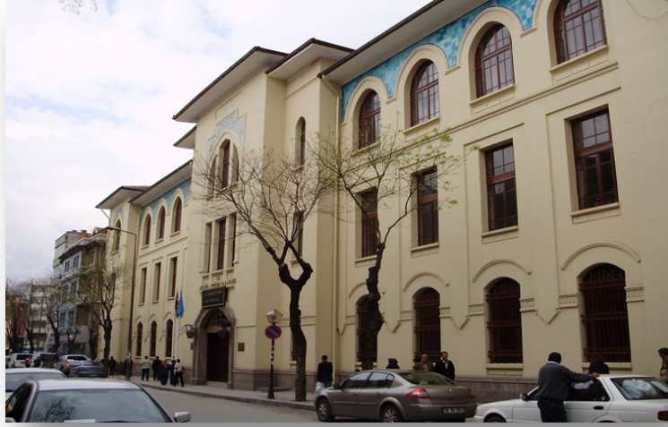
Foto. 9. Eski Ankara Adliyesi.