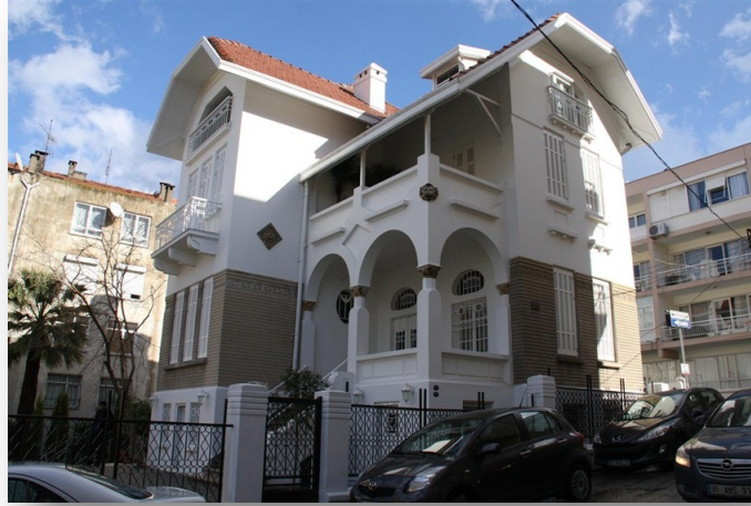
Foto. 8. İzmir Küçükalyalı, Aslanlı Köşk (16 Odalı Köşk) Genel Görünüş.

Tahsin Sermet Bey'in kendisi ve ailesi için konut olarak İzmir Küçükalyalı'da tasarladığı Aslanlı Köşk (16 Odalı Köşk) 4 mimarın İzmir'deki kariyerine önemli referanslar oluşturmaktadır (Foto. 8). Erken Cumhuriyet Dönemi öncesi İzmir konutunda yer alan melez karakterin yanı sıra I. Ulusal Mimari kökenli üslupla etkileşime girmiş Yapının Batı cephesinde yapının mimarının Tahsin Sermet Bey olduğuna dair bir kitabe bulunmaktadır (Ortaer 2021: 103).