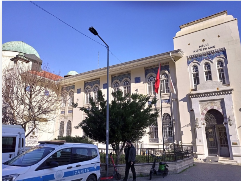
Foto. 3. İzmir Milli Kütüphane Giriş Cephesi