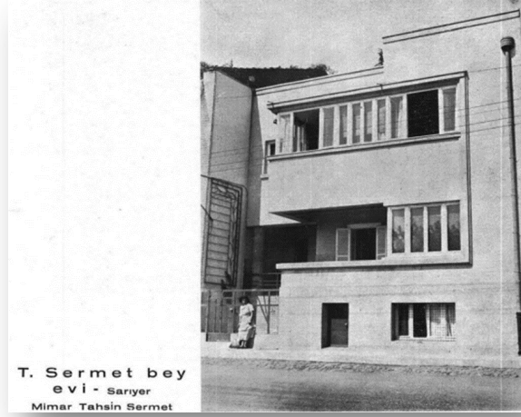
Foto. 10. Tahsin Sermet Bey Evi (Sarıyer-1934)

tam teşekküllü konutta idame ettiğini, Arkitekt'te yayımladığı Tahsin Sermet Bey Evi projesinden (Foto. 10) öğrenebilmekteyiz (Sermet 1934: 35-37).