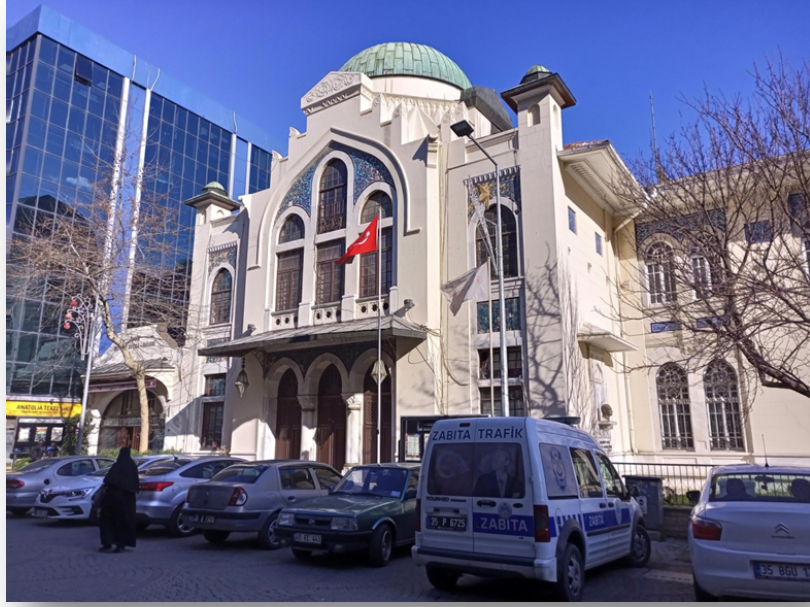
Foto 4. İzmir Milli Sinema Giriş Cephesi.

Müteakiben yine İttihat ve Terakki'nin desteği sayesinde İzmir'in mimaride Türk unsurları ve ideolojisi ile şekillendirilen imar ve inşasında aktif rol alan Tahsin Sermet Bey, Karataş Erkek Muallim Mektebi olarak inşa edilen (Foto. 5) fakat günümüzde İzmir Kız Lisesi (1914,1915-1918) olarak faaliyet gösteren yapının da tasarımını üstlenmiştir (Belge 2, BOA.DH.UMVM.69/45).