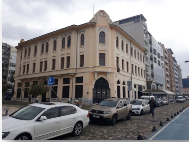
Foto. 7. İzmir Denizcilik İşletmeleri Binası İzmir Şube Müdürlüğü Genel Görünüş.

Tahsin Sermet Bey'in bir başka tasarımı ise 20. yüzyılın ilk çeyreğine tarihlenen ve girişinde bulunan küçük tabelada "Şehir Mimari Tahsin Sermed Bey" imzasıyla bilinen Denizcilik İşletmeleri İzmir Şube Müdürlüğü binasıdır (Kuyulu 2000: 98). Mimar, bu yapıda I. Ulusal Mimari formlarıyla birlikte Art Deco akımı çizgilerini sentezlemiştir (Eyüce 2005: 104) (Foto. 7.).