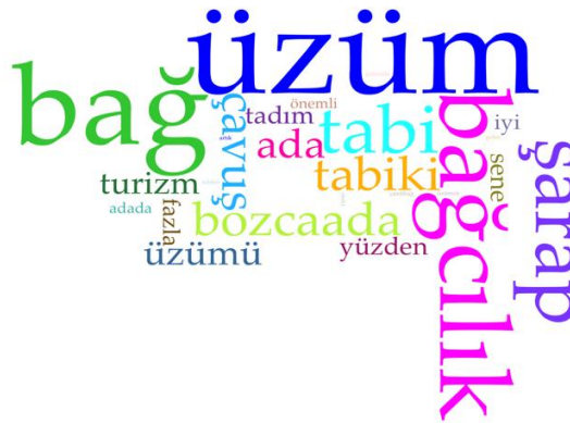
Şekil 1: Katılımcıların En Çok Tekrar Ettiği Kelimeler

Şekil 1'de ise görüşme sırasında en çok tekrar eden kelimeler yer almaktadır. En çok tekrar eden kelimelerin “üzüm”, “bağ”, “bağcılık” ve “şarap” olduğu görülmektedir. Üzüm kelimesi görüşme boyunca 37 kez tekrarlanmış onu sırasıyla bağ (34 kez), bağcılık (28 kez) ve şarap (23 kez) takip etmiştir.