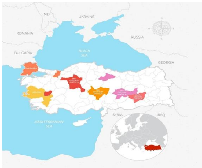
Resim 2: Türkiye bağ rotaları

Agro- turizm çeşidi içinde yer alan bağ turizmi, turistlere bağ rotaları sayesinde farklı deneyimler sunmaktadır. Bu rotalar, bir bölgedeki çeşitli bağ ve şarap üretim yerlerini birbirine bağlayan turistik güzergâhlardır (Charters ve Knight, 2002). Turistler için oluşturulan güzergâhlarda amaç sadece bağlara gidip şarap tadımı yapmaktan ziyade, rota üzerindeki doğal ve fiziki çekim merkezlerini tanımaktır. Bir diğer önemli amaç ise; üzümlere hayat veren toprakları, iklimi ve kültürel birikimi yakından deneyimleme fırsatı sunmasıdır (Bruwer, 2003). Resim 2'de Türkiye'nin sahip olduğu bağ rotaları gösterilmektedir.