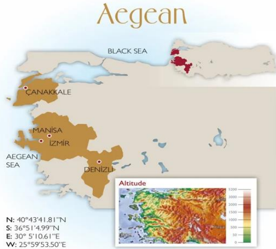
Resim 3: Ege bağ rotası