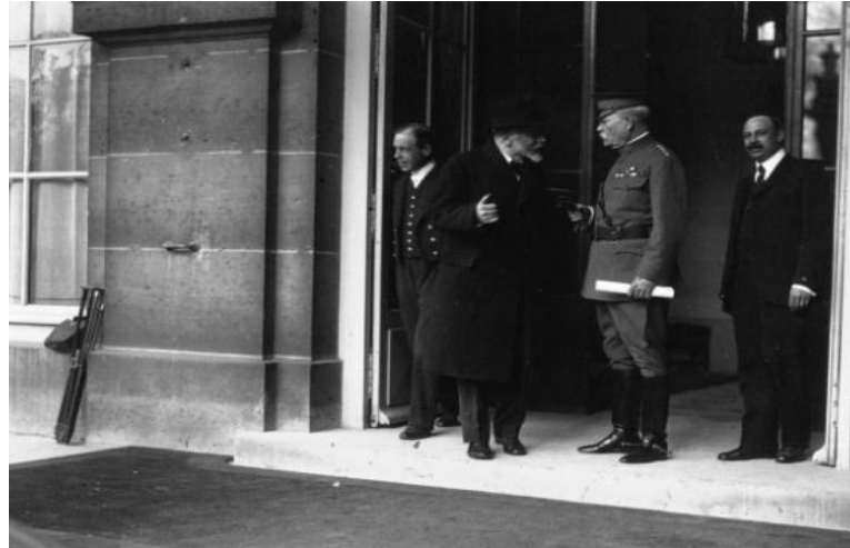
Ek 2. Paris Sulh Konferansı'nda Venizelos ve General Bliss