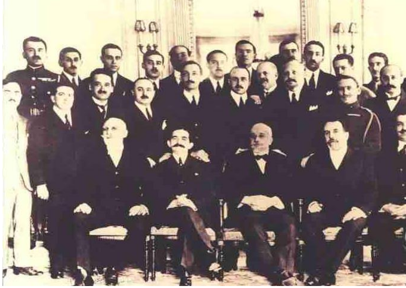
Ek 1. Eleftherios Venizelos, Paris'teki Sulh Konferansı'nda Heyet üyeleriyle