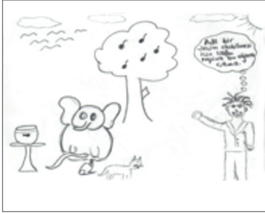
Şekil 3. “Adaletsizlik” görseli