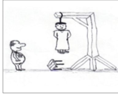
Şekil 4. “Adam asmaca” görseli