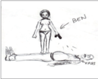
Şekil 5. “Cinayet” görseli