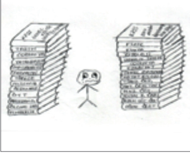
Şekil 7. “Kitaplar” görseli