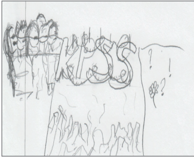
Şekil 1. “Sırat köprüsü” görseli