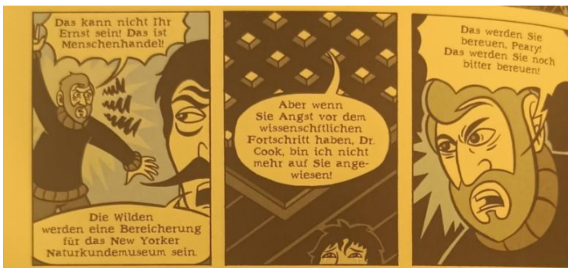
Abb.7: Die Bereicherung des New Yorker Naturkundemuseums. (Schwartz 2012: 82)

Menschen liegt im Wissen, das duldet keinen Zweifel“ (Horkheimer und Adorno 1994: 22). Auf diese Art und Weise werden die kulturellen Güter oder die religiösen Elemente des Volkes nicht als wertvoll angesehen.