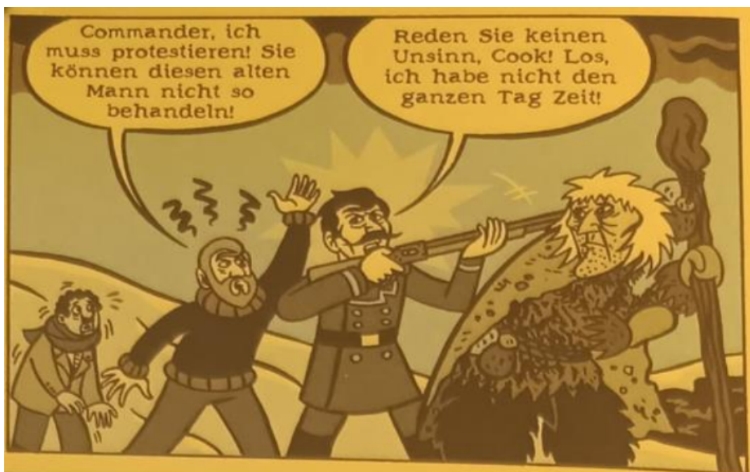
Abb.6: Die Unterdrückung der Einheimischen. (Schwartz 2012: 78)

sich festhalten, dass die Zuordnung des Fremden allgemein in koloniale Diskurse wie ‚Wildheit‘ und ‚Barbarei‘ eingebunden ist.