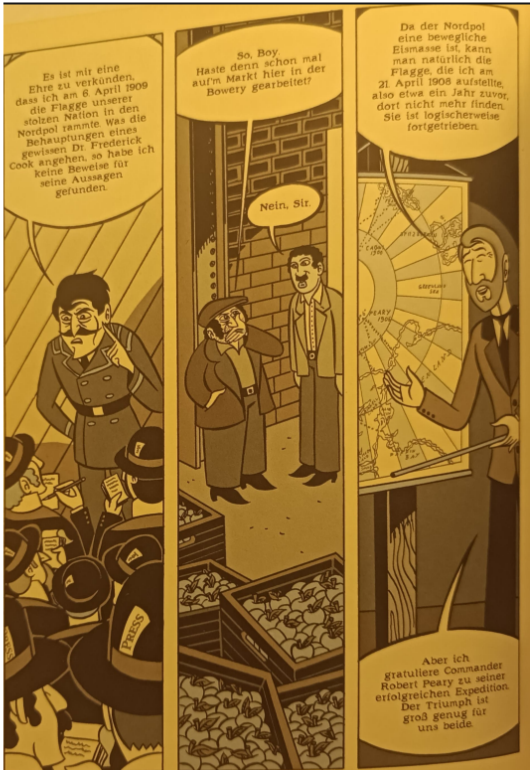
Abb.4: Die Interviews. (Schwartz 2012: 118)