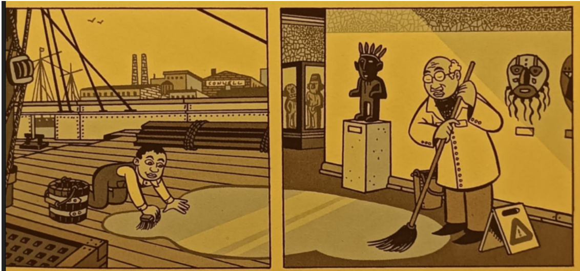
Abb.3: Die Kindheit und die Rentnerzeit. (Schwartz 2012: 15)