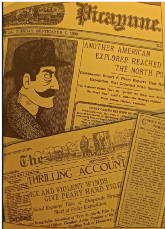
Abb.2: Zeitungsausschnitt 2. (Schwartz 2012: 118)

Ähnlich wie Christoph Ransmayr vermittelt auch Simon Schwartz die Handlung in seiner Graphic Novel in drei zeitlichen Handlungsdimensionen. Der Leser erfährt von Matthew Hensons Kindheit, seinen Erlebnissen auf der Expedition sowie seinem früheren Berufsleben und bevorstehenden Ruhestand. Diese unterschiedlichen Zeiträume werden durch analeptische und proleptische Konstruktionen dargestellt, wie auf der unteren Abbildung zu sehen ist: