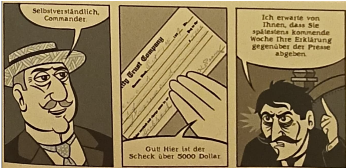
Abb.5: Bestechung. (Schwartz 2012: 129)

Es reicht Peary nicht, einfach nur Beweise zu vernichten. Er lässt Menschen auch hohe Summen zahlen, damit sie falsche Aussagen machen. Mit diesem Verhalten festigt er seine Position und setzt seine eigene Story mithilfe der Medien und seiner finanziellen Ressourcen um.