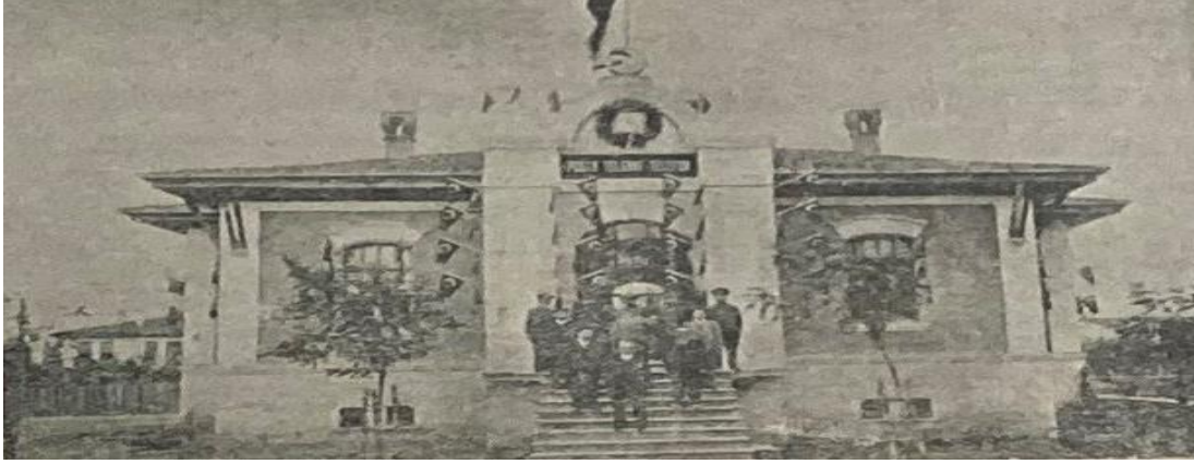
“Cumhuriyet Bayramı’nda Süslenen Posta ve Telgraf Binası”, Bolu , S.1020, 7 İkinci Teşrin 1935, s.3.