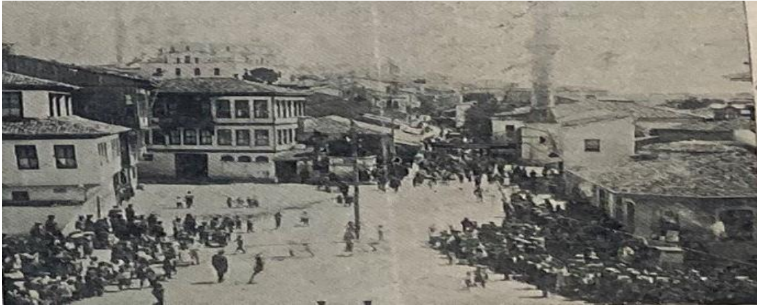
"Bolu'da Cumhuriyetin 15. Yıl Dönümü Kutlamaları", Bolu , S.1171, 3 Teşrin-i Sâni 1938, s.1.