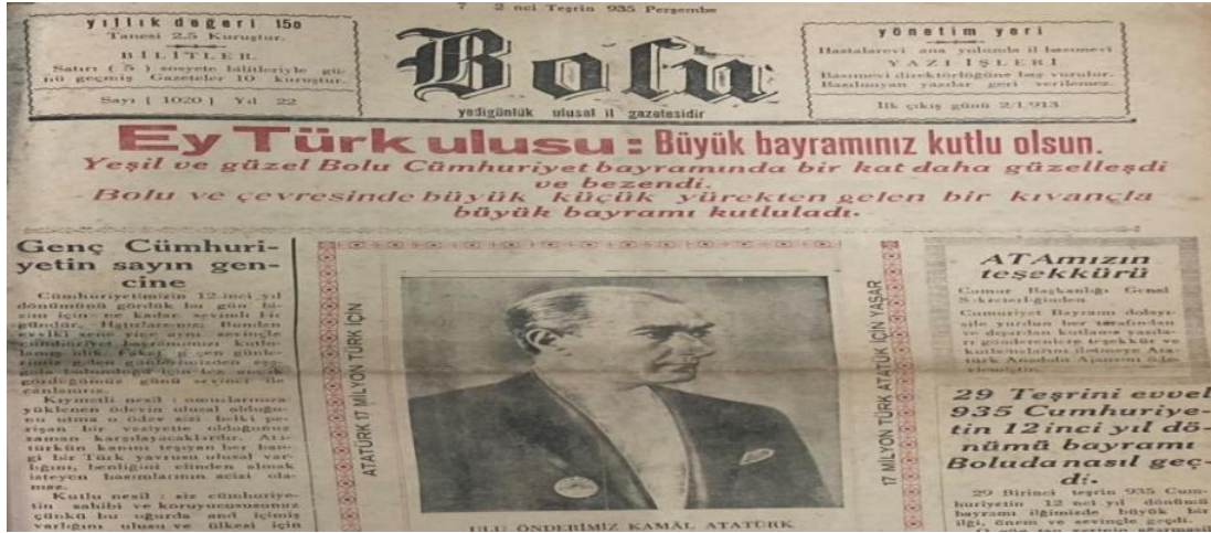
"Ey Türk Ulusu: Büyük Bayramınız Kutlu Olsun" manşeti ile Bolu gazetesi, 7 Kasım 1935.