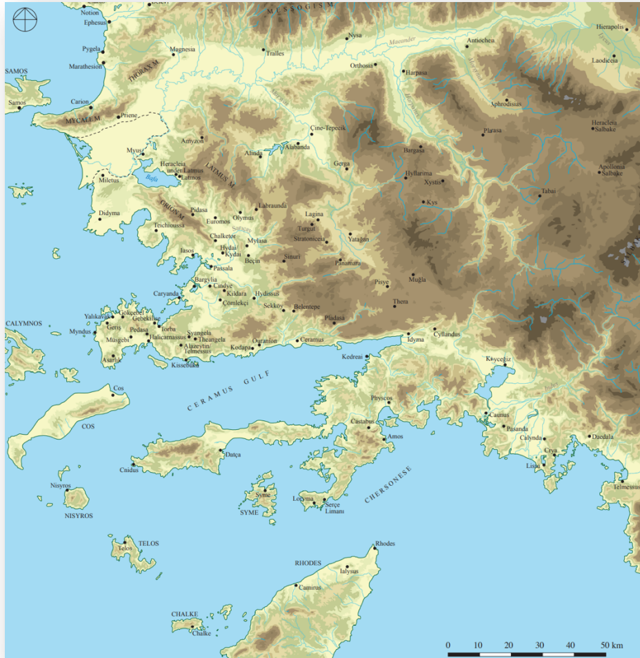
Resim 1. Karia Bölgesi Haritası (Henry 2020: XVIII).

Karia bölgesinde gelecekte yapılacak çalışmalar Anadolu ve Ege arkeolojisine önemli katkılar sağlamaya devam edecektir. Bu katkıların Tunç Çağı ve öncesi dönemler, Erken Demir Çağı, Geç Antik ve Orta Çağ kültürlerini anlamaya dönük olarak artması sahip olduğumuz geçmişin daha iyi anlaşılabilmesi bakımından gereklidir. Böylelikle Cumhuriyet Dönemi'nde Atatürk ün öngörüsü ve teşvikleriyle hız kazanan kültür tarihi çalışmalarımız geleceğe taşınacaktır.