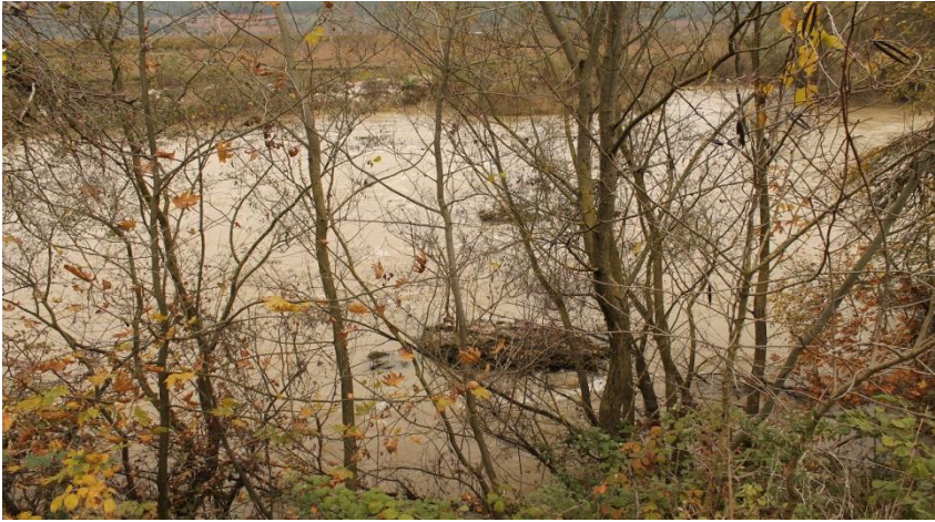
Resim 1: Sakarya Nehri'nde Köprü Kalıntıları (Göksu Köprüsünün Kuzeyi)