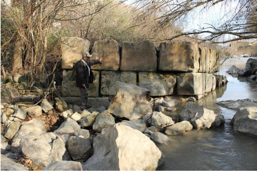
Resim 2: Sakarya Nehri'nde Roma Köprüsü Kalıntıları