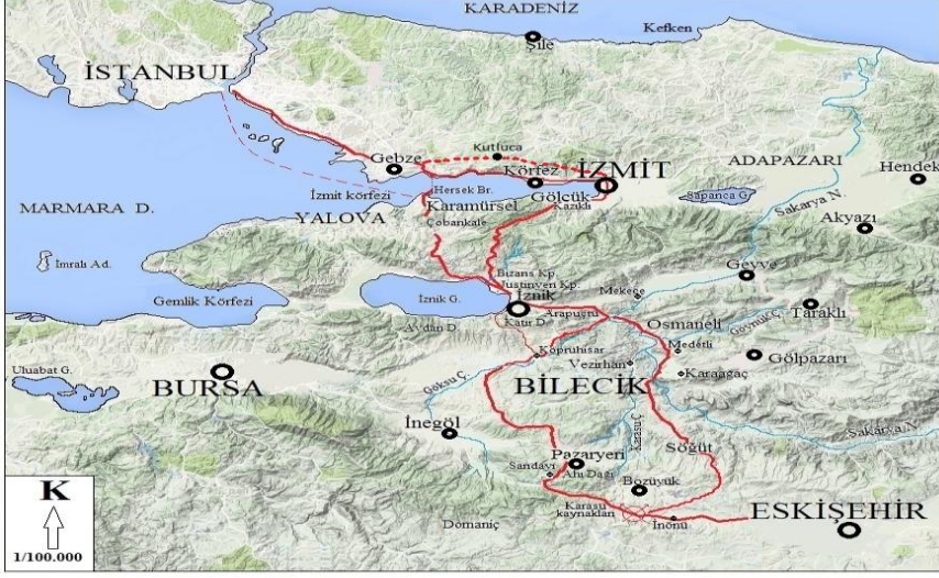
Harita 1: Haçlıların Kullanabileceği Tarihi Yollar.