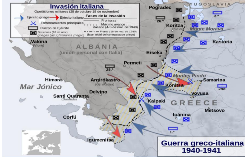
Harita 2: İtalyan-Yunan Savaşı (1940-1941) (URL 1)