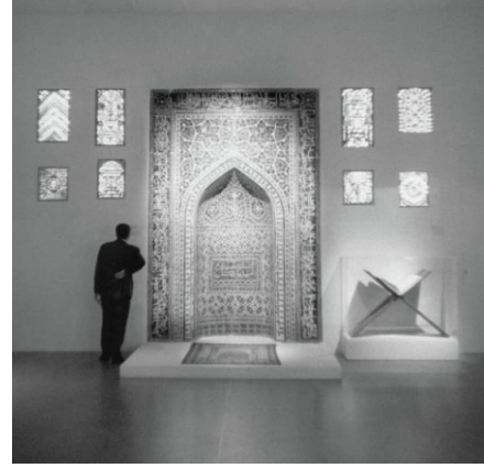
Şekil 2. Mihrap, İsfahan, m.1354, İran