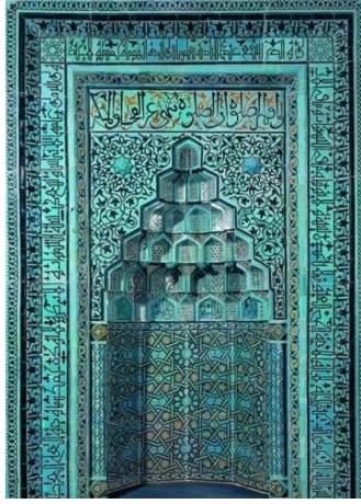
Şekil 3. Beyhekim Camii'nin çini mozaikli mihrabı 13. yy Konya. (Eravşar, vd. 2014).