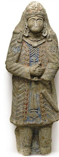
Şekil 9 (Alçı) Stuk malzeme, Kadın figürü, İran. (Eravşar, vd. 2014).