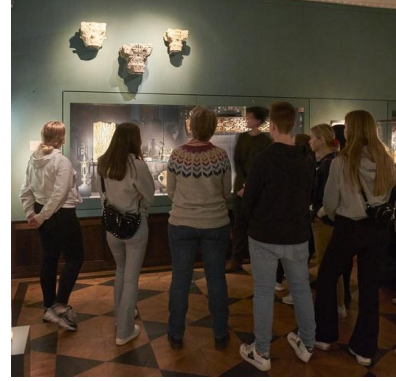
Şekil 12 David Samling Museum. 2020.

https://www.davidmus.dk/en/skoletjenest,