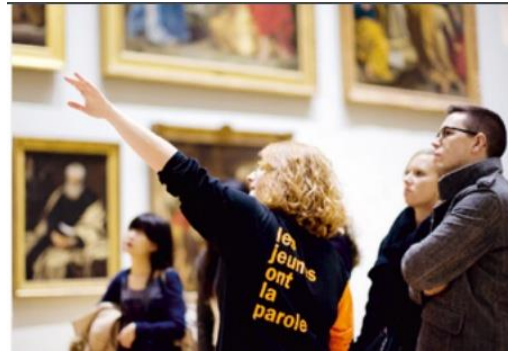
Şekil 14 Louvre Müzesi, Ziyaretçilerle