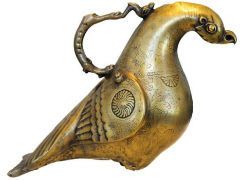
Şekil 4. Buhurdan 10. ya da 11. yy Güvercin formulu bronz, İran. (Eravşar, vd. 2014).