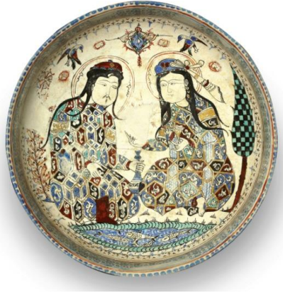
Şekil 11 Seramik kâse, Firit içerikli çok renkli sırüstü boyalı ve opak tek renk sırlı minai, 11. ya da 12. yy İran. (Eravşar, vd. 2014).