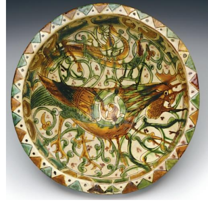
Şekil 7 Sırlı kâse, Siğrafito tekniği 11. ya da 12. yy İran. (Eravşar, vd. 2014).