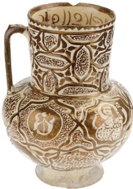
Şekil 13 Seramik sürahi, Firit hamurlu,

Müze, okul çocukları, engelli ziyaretçiler ve daha pek çok grupta müzeyi ziyaret etmek için bir dizi etkinlik ve araç sunar.