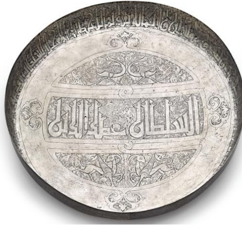
Şekil. 5. Gümüş tepsi, Kazıma tekniği, 11. ya da 12. yy İran. (Eravşar, vd. 2014).

Selçuklu Çağı sanatsal kumaşlarının sadece estetik nitelikleriyle değil, yüksek bir işçilikle de özel bir yerde bulduklarının altını çizmek gerekir. Bu kumaşlar aynı zamanda Selçuklular ve mensubu oldukları Oğuzların daha o zamanlarda kaba zanaattan, ince bir işçiliğe geçişlerinin de kanıtıdır. Müslümanların, ölüleri defin etmeden önce sardıkları kumaş için sadece kefeni kullandıkları göz önünde bulundurulursa, günlük hayata dair nesnelerin bu mezarlarda bulunmuş olması dahi İslam medeniyeti için büyük öneme sahiptir.