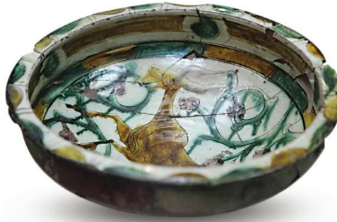
Şekil 10 Kâse, Sığrafito tekniğinde, 12. ya da 13. yy Bakü. (Eravşar, vd. 2014).