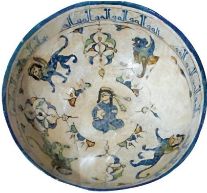
Şekil 8 Sırlı seramik kâse, 12. yy İran. (Eravşar, vd. 2014).