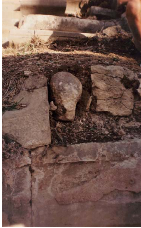
Fig. 5. Portre başın buluntu konumu (Side kazı arşivleri, 2000)

Yapı, mimari bezemelerinden hareketle MS II. yüzyılın ortalarına tarihlendirilir (Mansel 1978, 208). Ancak alt cavea'daki oturma basamaklarının hemen altında tespit edilen basamaklar, yapının Hellenistik döneme tarihlenen daha küçük ölçekli bir tiyatronun üzerine inşa edilmiş olduğunu düşündürmektedir (Mansel 1963, 94; Bernardi Ferrero 1970, 141; Nollé 1993, 82; İzmirliğil 1985, 393). Arkeolojik ve epigrafik veriler, yapının farklı dönemlerde değişiklikler ve onarımlar geçirerek uzun soluklu kullanıldığına işaret eder. İlk büyük değişim, MS III. yüzyılda yaşanır. Bu süreçte cavea'nın ilk oturma sırasının önüne, orkestrayı komple çevreleyen, ön tarafı devşirme kesme taşlardan, arkası ise küçük moloz taşlar ile desteklenen bir duvar oturtulmuştur (Fig. 6-7). Bu duvarın gerisine, tiyatronun ana ekseninde olmayan bir noktaya, yüksekçe bir platform ve bir loca yerleştirilir. Böylece orkestra, gladyatör oyunları ile vahşi hayvan dövüşlerinin düzenlendiği bir arenaya çevrilmiştir (Mansel 1962, 53; Mansel 1978, 208). Bahsi geçen duvarın dış cephesi su geçirmez pembeye yakın bir harç ile sıvanmıştır.