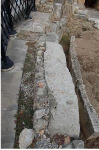
Fig. 7. MS III. yüzyıl duvarından detay

436-437). Bu durumda yapının sahne binasının arkasının surun bir parçası konumuna getirilmesi ve diğer değişiklikler ancak bu tarihten itibaren gerçekleşmiş olmalıdır.