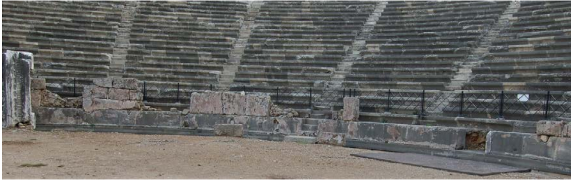
Fig. 6. Orkestrayı çevreleyen MS III. yüzyıl duvarı

Aynı sıra, sahne binasının önündeki pulpitum'un cephesinde de tespit edilmiştir ve orkestranın altında bir su kanalının varlığı ortaya çıkarılmıştır. Tüm bu verilerin ışığında, Mansel, bu alanın aynı zamanda bir havuz görevi üstlendiğini ve burada deniz savaşları oyunlarının da düzenlendiğini belirtse de henüz bu öneriyi kanıtlayacak bir veriye ulaşamamıştır. Ancak, gladyatör oyunlarının düzenlenmiş olduğunu gösteren arkeolojik ve epigrafik veriler söz konusudur. Bunlardan en önemlisi sütunlu caddede (agora propylaion'unun karşısında) duran anıtsal heykel kaideleridir. Bu kaideler, Tetrapolit mahallesi gerusia'sı tarafından, tüm bu oyunların masraflarını karşılayan Modesta ve Modestus için dikilmiştir (Mansel 1978, 209-210; Nollé 2001, No. 111-112; Yurtsever 2018, 67-78).