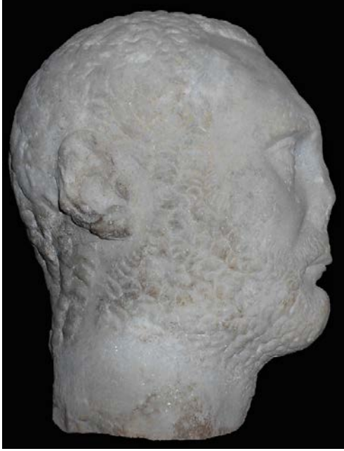
Fig. 3. Portre Baş – Sağ Profil

kemikleri çıkıntılı verilmiştir. Burnun özellikle uç kısmının ve üzerinin kırık ve eksik olması form olarak tam bir tanımlama yapmaya imkân tanımaz, ancak burun kökünün kalınlığı dikkat çekicidir. Burun kanatlarını iki yanda çevreleyen naso-labial kıvrım, derin işlenmiştir. Göz altı torbaları belirgindir. Alında birbirine paralel, hareketli iki adet yatay, burun kökünün kaşlar ile birleştiği noktada ise iki adet dikey derin kırışıklığa sahiptir.