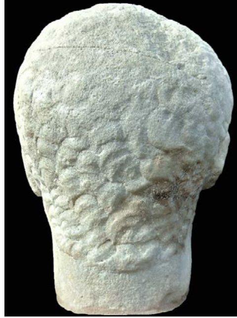
Fig. 4. Portre Baş – Arka Cephe

Bir kulaktan diğerine yüz, birbirlerinden plastik biçimde ayrılmış kabarık, gür, kısa ve kıvrık saç perçemleri ile çevrenir. Şakaklarda geriye doğru çekilen perçemler, ense de uzundur. Kulak önlerinde uç kısımları yüze doğru taranan favoriler, daha kısa kıllardan meydana gelen sıkı bir sakal ile birleştirilmiştir. Sakal, çene altından boyun başlangıcına kadar gür bir biçimde devam eder. Eserin saç ve sakalında a penna tekniğinin uygulanmış olduğu söylenirse de (Akçay-Güven 2014, 85) her ikisinin de plastik bir biçimde işlenmiş olduğu gözlemlenir. Bu teknik sakalın sadece yanak ile birleşim yerlerinde, bıyıkta ve dudak altı kıllarında kullanılmıştır. Başın arkasındaki ve üstündeki perçemler ön taraftakilere oranla kaba bırakılmıştır.