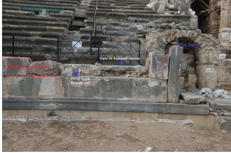
Fig. 8. Tiyatro batı cavea: MS III. yüzyıl duvarı, Batı Şapeli ve Şapel ile bağlantılı onarım, Portre başın buluntu yeri