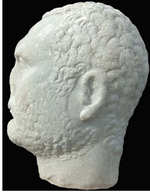
Fig. 2. Portre Baş – Sol Profil

Dolgun yüzün dış konturu alın kısmında geniş, çeneye doğru daralıp oval bir forma dönüşür. Bu formun içerisinde gözler asimetrik olarak konumlandırılmışlardır. Öyle ki sağ göz sol göze göre aşağıdadır. Ancak asıl asimetrik durum yanaklarda yakalanmaktadır. Sağ yanak soldakine göre daha dardır. Bu uygulamalar başın bakış açısının sağ tarafa doğru olduğunu gösterir. Hatta çenenin hafif sağa dönük olması ve göz bebeklerinin sağa bakışı da bu görüşü doğrular.