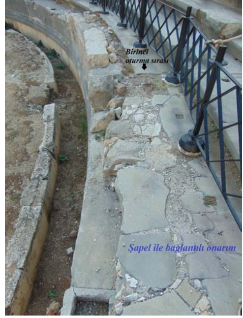
Fig. 9. Tiyatro batı cavea: Birinci oturma sırası, Şapel ile bağlantılı onarım

Çalışmaya konu edilen portre başın buluntu durumu, orijinal yeri hakkında net bir bilgi vermeye imkân tanınmasa da bazı öneriler getirilebilir. Tiyatronun, başın tarihlendirildiği MS 253-260 yılı civarında nasıl bir düzenlemeye ve bu portrenin bu düzenlemenin içinde nasıl bir yere sahip olduğunu söylemek oldukça güçtür. Eğer bu başın orijinal yeri gerçekten tiyatro ise, tiyatroda MS III. yüzyılın üçüncü çeyreğinde bir düzenlemenin varlığından söz edilebilir. Ancak, MS III. yüzyıl, kentin mimari anlamda yeni yapılaşmalara sahne olduğu ve mevcut yapıların da onarımlar geçirdiği önemli bir dönemdir (Mansel 1978, 108-111 ve 317-318; Gliwitzky 2010, 87-156). Bu noktada başın, tiyatroya ait olması kuvvetle muhtemelse de kentteki bir başka yapıdan MS IV. yüzyılın son çeyreği ya da hemen sonrasında tiyatroya duvarın içerisinde devşirme bir malzeme olarak kullanılmak üzere getirilmiş olma olasılığı da göz ardı edilmemelidir.