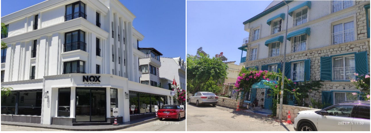
Şekil 4. Barınaklar Bölgesi'nde Son Yıllarda Gelişen Butik Oteller

Seks turizmine olan yol bağımlılığından kopan Barınaklar'da, yeni sektörel türlerden biri de apart oteller olmuştur. 2017 yılından önce yasal işletme formunda olmadan, çoğunlukla emlak sektörü tarafından faaliyet gösteren günlük evler ve apart daireler 687 sayılı KHK ile yasal olarak konaklama tesisi olmuştur. Barınaklar'daki ilk apart otel işletmecilerinden A6 yasal değişikliklerle ortaya çıkan dönüşüm sürecini şu ifadelerle belirtmektedir: