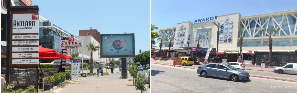
Şekil 5. Barınaklar Caddesi'nde Son Yıllarda Artan Dış Klinikleri ve Alışveriş Merkezleri

Yeni dışsallıkların yarattığı turizm talebi ve arz yönündeki değişimle karşılıncı Barınaklar'daki işletmeler çok çeşitli pazar portföyü yaratmışlardır. Bu kapsamda dış kliniklerinin sayısının artması ve yurtdışı ile kıyaslandığında fiyat ve hizmet koşullarındaki Türkiye'nin avantajlı konumu, Barınaklar Bölgesi'ndeki konaklama işletmelerini sağlık turizminde önemli bir destinasyon haline getirmiştir. Bölgeye sağlık turizmi kapsamında gelen ziyaretçiler için bir diğer çekicilik ise bölge içerisinde alışveriş merkezlerinin sayıca fazla olmasıdır. Dolayısıyla gerek sağlık turizmi gerekse iş ve gezi seyahatleri sonucu kente gelen ziyaretçiler Barınaklar Bölgesi'ndeki konaklama tesislerini tercih etmektedir. A4 ve A5 bu dışsallıkların oluşturduğu müşteri çeşitliliğini şu ifadelerle aktarmaktadır: