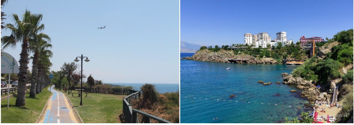
Şekil 3. Şirinyalı'daki Sosyal Alanlar ve Kıyı Olanakları

2010 yılı sonrası peyzaj düzenlemelerinin yapıldığı kıyı alanında önemli diğer gelişme, Düden Şelalesi'nde yapılan peyzaj çalışmalarıyla önemli bir ziyaretçi talebini oluşturmuştur. Yine de tüm bu dışsallıklar Barınaklar Bölgesi'ndeki seks turizmine olan yol bağımlılığını değiştirememiştir. Barınakların mevcut turistleri önceki turistlerin aksine Düden Şelalesi'ni ziyaret etmektedir. A4 tarafından Düden Şelalesi'nin mevcut turizm talebine katkısı şu şekilde ifade edilmektedir: