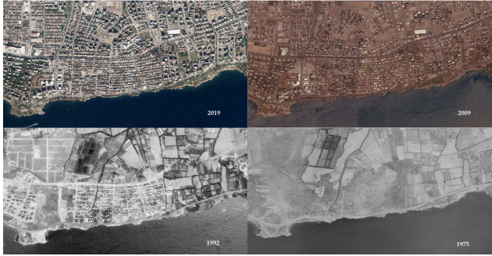
Şekil 2. Barınaklar Bölgesi'nde Mekânsal Değişim Kaynak: Harita Genel Müdürlüğü (2021).

ayırıyordu. Yıllık otelin bütün ücretini ödüyorlardı. Oteli kapatıyorlardı. Dışarıdan misafir almıyorlardı... Öyle çalışılırdı burada.” (A1, 47 yaşında, Müdür).