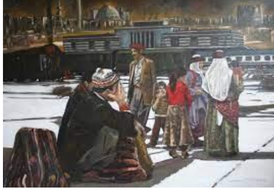
Resim 7. Mehmet Başbuğ, Diyarbakır Tren İstasyonu , 140x200 cm, Tuval üzerine yağlı boya, 2007. (Kaynak: Türkiye Cumhuriyeti Devlet Demir Yolları Koleksiyonu).

eserinde göç sürecinin insanların bekleyişi, endişesi ve değişen zamanın yükünü figürler aracılığıyla işleyerek, göç temasını figüratif bir dille yansıtmıştır. Bu eser, insanın duygusal durumunu ve toplumsal gerçekliği yoğun bir biçimde resmederek izleyicide derin izler bırakmaktadır.