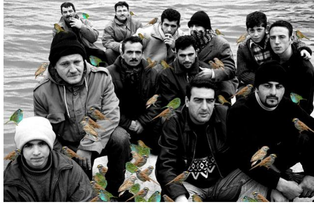
Resim 6. Şükran Moral, Despair, Light From the Middle East : New Photography, 2003.

açıklamaktadır. Çalışma, göçmenlerin yaşadığı zorlukları ve çaresizlikleri ifade etmek için semboller ve metaforlar kullanarak göç konusunu ele almaktadır. Bu metafor, rengarenk kuşlar ve şarkı söyleyen insanlarla temsil edilmektedir. Kuşlar, kanatlarının kırık olmasıyla göçmenlerin zorluklarına ve engellere rağmen umudu taşıyan tarafını yansıtır. Kuş metaforu, göçmen kadınların deneyimlerini ve göç sürecinde yaşadıkları çaresizlikleri, umutları ve direnişlerinin simgesidir. Teknedeki insanlar ise göçmenlerin içinde bulunduğu zorlu yolculuğu temsil eder. Sanatçı, göçü "yüzyılın dramı" olarak nitelendirerek göçmenlerin yaşadığı acı ve zorluklara vurgu yapmaktadır. Kendi göç deneyimini anımsatarak, çalışmalarının otobiyografik bir boyut taşıdığını belirtir. "Göçmen Kuşlar" metaforu, kuşların kapana kısılmışlık durumunu yansıtarak göçmenlerin yaşadığı sıkışmışlık hissini ifade eder. Göç teması, fiziksel bir hareketlilik beraberine, kimlik, aidiyet ve yer değiştirme gibi daha anlamları da içerdiği söylenebilir.