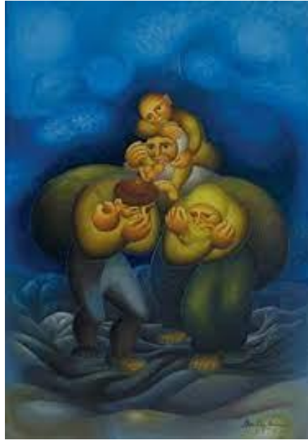
Resim 3. İbrahim Balaban, Göç , 100x70, Duralit üzerine yağlı boya, 1978. (Kaynak: Balaban, 2011, s. 21).

hikâyesini ele almıştır. Çıplak ayaklı yetişkinlerin sırtladığı bohçalar ve resimlerinde sıkça yer verdiği kadın figürleri, çocuklar, göçün zorlu sürecini betimlemektedir. Biçimsel dil, figürlerin ruh halini yansıtırken, fantastik bir kurgu içinde figürlerin güçlü bir ritimle yerleştirilmesine imkân sağlamıştır. Renk seçimi, resmin anlamını güçlendirmiş ve yapısal bütünlüğü desteklemiştir. Bu yönüyle Balaban'ın eserleri, insanın ve hayatın kesitlerini estetik ve duygusal bir derinlikle işleyerek izleyiciye güçlü bir anlatım sunmaktadır. Melih Cevdet Anday, Balaban'ın ilk sergisi için: "Çabalamaktan hepsi bitkin, çoğu pırtılara bürünmüş, koyu bir yoksulluk içinde görünen insan kalabalıkları seyredene hiç de umutsuzluk vermiyor. En çok yürek parçalayan konularda bile Balaban, sevinç, umut öğelerini araya katmasını bilmiş" (Balaban & Bilgin, 2009, s. 158), ifadelerine ek olarak sanatçının yaşadığı dönemdeki siyasi zorluklara rağmen kendini tuvalinde ifade etmesi, Balaban'ın sadece resimde değil, aynı zamanda yaşamın içinde de mücadeleci ve özgün bir karakter olduğunu gösterir. Ayrıca Balaban'ın eserleri, sanatsal bir ifade aracı olmanın ötesinde, tarih, kültür ve insanlık hikâyelerini anlatan önemli belge niteliği taşır. Bu çerçevede, kadın figürleri bireysel portreler olmalarının yanı sıra toplumsal ve tarihsel bir bakış açısından da değerlendirilirler. Balaban'ın eserlerinde kadınlar, geçmişten günümüze uzanan çeşitli hikâyelerin temsilcisi olarak görülebilir.