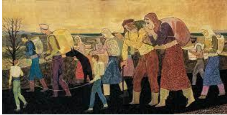
Resim 2. Nuri İyem, Göç , 200x100 cm, Tuval üzerine yağlı boya, 1970. (Kaynak: Çalışkan, 2018, s. 41).

Nuri İyem (1915), göç temasını işleyen birçok sanatçı arasında öne çıkan bir isimdir ve bilinen otuz üç göç temalı eserlerinde, göçün insanlar üzerindeki etkilerini sanatsal bir ifade şekli olarak kullanmıştır. Sanat kariyeri boyunca farklı tarzlarda eserler ortaya koyan Nuri İyem, özellikle 1960'ların sonlarından itibaren Anadolu insanının yaşam tarzlarına odaklanarak kendi özgün figür anlatısını geliştirmiş bir sanatçıdır (Arisoy & Altinkurt, 2012, s. 7). İyem'in eserlerinde (Resim 2), resimsel içeriğin anlamını vurgulayan açık ve samimi bir anlatım tarzını benimsemiştir. Sanatçı, eserlerinde gösterişten uzak, saf bir içtenliğe odaklanmış ve doğaçlama bir anlatım tarzını ustalıkla sergilemiştir. Bu kapsamda, Nuri İyem'in eserlerinde kadınlar, göç temalı resimsel anlatımların önemli bir parçasını oluşturur.