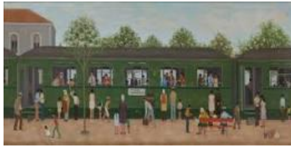
Resim 4. Nedim Günsür, Yeşil Tren / İstanbul – Frankfurt , 80x40 cm, Tuval üzerine yağlı boya, (Kaynak: Akbank resim koleksiyonu.).

Avrupa'ya yapılan insan göçü, sanatçının eserlerinde göç ve getirdiği süreçlerin duyarlı bir şekilde ele alınmasına yol açmıştır. Günsür'un "İstanbul-Frankfurt" gibi tren seferlerini işlediği eserlerinde, göç eden insanların umutsuzluk, zorluk ve çaresizlikle başa çıkma çabalarını anlattığı düşünülmektedir. Trenin yola çıkışını simgeleyen figürler, gerçeklikten izler taşıyan farklı insan gruplarını temsil etmektedir. Bu eserlerde gerçekçi bir anlatım ve psikolojik etkileri yansıtan figürler, göçün getirdiği yapıların üzerinde duru bir anlatımla sunulmuştur. Günsür'ün eserlerinde, göçün toplumsal etkileri, insanların ruh halleri ve yaşadıkları zorluklar, sade bir üslupla ancak derinlikli bir anlatımla yansıtılmıştır. Öte yandan eserdeki kadınların, toplumsal normlar ve kısıtlamalarla mücadele ederek kendi kimliklerini bulma ve özgürlük arayışlarında bir yolculuğa çıktığı, aile içi ilişkilerden toplumsal rollerine kadar geniş bir yelpazede değerlendirilebilir. Bununla birlikte eserlerindeki biçimsel düzenlemeler ve kullanılan renk değerleri, görsel açıdan dengeli ve anlamsal olarak zengin bir içerik sunmuştur.