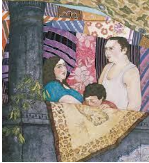
Resim 5. Gülsün Karamustafa, Balkon'dan , 52x57 cm, Kâğıt üzerine guvaş boya, suluboya, renkli füzen, 1982.

sanatçı eserlerinde tasvir etmiştir. 1980'lerin ortalarından itibaren, Karamustafa'nın eserlerinde toplumsal etkiler ve göç teması daha belirgin hale gelmiş, toplumsal yozlaşma, kültürel etkileşimler, melezleşme gibi konuların yanı sıra, Türkiye'nin siyasal tarihine uzanan zorunlu göç, göçün sosyo-ekonomik ve kültürel yansımalarını da ele almıştır (Heinrich, 2007, s. 19-20). Bu dönemde yerleştirme ve videolarında da göç ve kültürel kimlik konularını işlemiştir. Karamustafa'nın eserlerinde, özellikle yorgan, kilim, örtü, kumaş, kaşık, yelek gibi nesnelere merkeze alarak göç ve kimlik temasını ön plana çıkarır. Gündelik hayattan esinlenen bu nesnelere, göç, bellek, kimlik, kültürel ifade, kitsch, popüler kültür imgeleri, cinsiyet gibi konuları işler. Özellikle bu gündelik nesnelere aracılığıyla kadınların toplumsal yaşamını yansıtan Karamustafa, kadının deneyimleriyle ilgili pek çok sorunu ele alır. Bu şekilde, onun çalışmaları kadının yerini, rolünü ve deneyimlerini benzersiz bir şekilde gösterir, özellikle kadınların günlük hayatta karşılaştığı cinsiyetçi algılar ve toplumsal yapılar üzerine odaklanır. Bu yönüyle "Balkon" adlı çalışmasında (Resim 5), dikkat çeken nokta eserin eklektik yapısı ve karmaşık stili olmuştur. Bu eserde, şehirdeki yaşamdan kesitler sunarak, göç edenlerin şehirdeki yaşamlarındaki çatışma veya uzlaşma durumlarını, farklı öğelerin derinliksiz birlikteliğiyle göstermiştir.