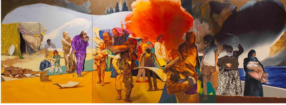
Resim 8. Temür Köran, Göç , Tuval üzerine yağlıboya, 150x410 cm, 2015.