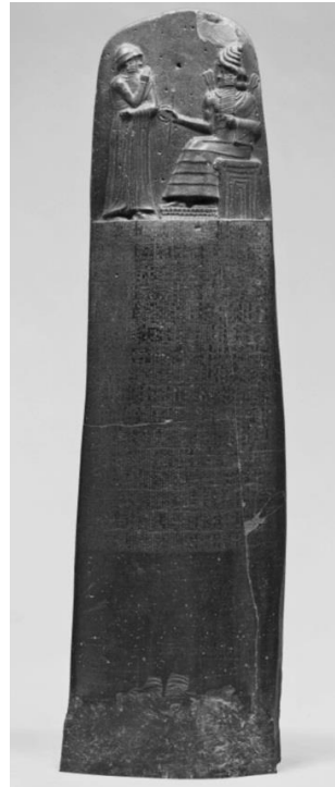
Ek 2: Louvre Müzesinde bulunan taş stelin üzerindeki heykelde Tanrı Šamaš oturarak Kral Hammurabi ise ayakta gösterilmiştir. Stelin ana gövdesinde ise Hammurabi Kanunlarının yazılıdır. (Mieroop, 2018: 122)