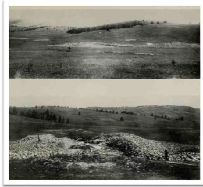
Görsel 1. Pazırık Kurganları Kazılmadan Önceki Halinden Bir Görünüm (Rudenko, Frozen Tombs of Siberia The Pazyryk Bruials of Iron Age Horsemen)

Pazırık kurganları içerisinde 1929 yılında Rudenko tarafından açılan ilk kurgan Pazırık 1 numaralı kurgan olarak adlandırılmaktadır. Bu kurgan, 47-50 m çapında ve 2,2-2,5 m yüksekliğinde taş yığından yapılmış bir kurgandır. Pazırık 1 kurganı üzerinde yapılan çalışmalarda, kurganı koruyan ağaç kütüklerinden oluşan koruma tabakasına rastlanılmıştır. Bu tabakanın 300 kadar tomruktan oluştuğu tespit edilmiştir. Mezar odasının tavanı kuzey ve güney duvarlarında karşılıklı olarak bulunan üç kiriş üzerine oturtulmuştur. Bu ağaç koruma tabakasının ya da tavanın altında ise 4 m. derinliğe sahip iç içe iki oda ortaya çıkarılmıştır. Mezar odasının üst katmanında ise huş ağacı kabuğu ile karaçam ağacının kabukları ve dumanlı çay çalısının yaprakları bulunmuştur. Mezar odasını meydana getiren ahşap oda ise mezar çukurunun tamamını kaplamamakta ve mezar çukurunun daha geniş olan güney tarafında yer almaktadır (Rudenko, 1970: 15-21 Çoruhlu, 2019: 132).