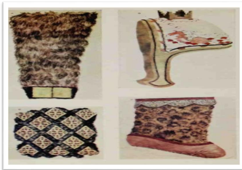
Görsel 4. Pazırık Kurganlarında Bulunan Giyim ve Kuşam ile İlgili Buluntular (Rudenko, Frozen Tombs of Siberia The Pazyryk Bruials of İron Age Horsemen)

Bozkır insanının sosyal yaşamının bir diğeri yeme içmedir. Bozkır kavimlerinin başlıca gıda maddesi ettir. Et ihtiyaçlarını; kuzu, koyun, koç, keçi, erkeç, oğlak, at, deve, tavuk gibi kendi besledikleri