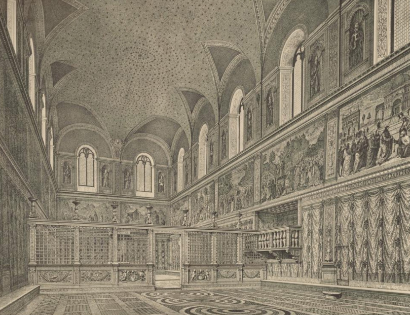
Görsel 6: Vatikan'daki Sistine Şapeli'nin Michelangelo öncesi lapis lazuli üzeri altın renkli yıldızlarıyla orijinal tavan dekorasyonu (Steinmann, Die Sixtinische Kapelle c.1, levha VII)

19. yüzyıl Avrupa ve Amerika mimarisinde antik Mısır kültürüne artan ilgi ve yeniden canlandırıcı üslupların yaygınlaşması, özellikle neogotik üsluplu yapılarda bahsedilen tavan dekorasyonunun sıklıkla kullanılmasına yol açmıştır. Eldridge Street Sinagogu (New York, 1887), St. Mary The Virgin Kilisesi (New York, 1868), Notre Dame Bazilikası (Montreal, 1829), Rykestrasse Sinagogu (Berlin, 1904), St. Birinus Kilisesi 16 (Dorchester Upon Thames, 1849), St. Sava Katedrali (1855, New York) dekorasyonun görüldüğü neogotik örnekler arasındadır. Uygulamanın yaygınlaşmasında neogotik mimarinin öncüsü mimar ve teorisyen Augustus W. N. Pugin'in etkisi olduğu anlaşılmaktadır. 17 Pugin'in 1846'da tasarlayıp inşa ettiği Cheadle'daki St. Giles Kilisesi'nin tavanında aynı tavan dekorasyonu uygulanmıştır. Pugin St. Giles Kilisesi'nin inşa edildiği dönemde Fransa'da restorasyon alanındaki gelişmeleri ve özellikle Paris'teki Sainte-Chapelle'in restorasyonunu yakından takip etmiştir. 18 Pugin, profesör olarak gotik dekorasyonu üzerine yaptığı konuşmalarda gotik kiliselerin ahşap tavanlarında gök mavisi üzerine altın renginde yıldız serpiştirilmiş dekorasyonun "gökyüzünün güzel, mistik ve anlamlı bir temsili" 19 olduğundan bahsetmektedir.