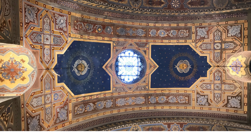
Görsel 10: İstiklal Caddesi, Santa Maria Draperis Kilisesi'nin tonoz yüzeyinde gök mavisi üzerine altın renkli yıldızlı kalemşi bezeme