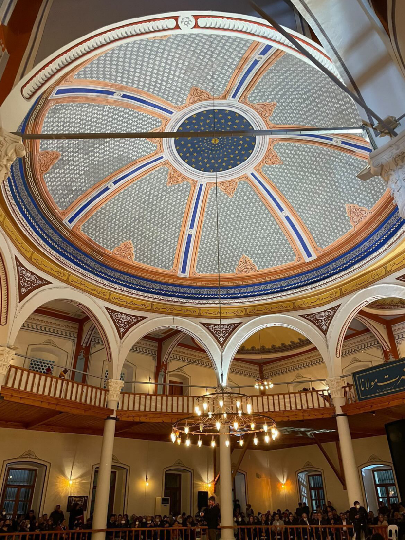
Görsel 14: Gelibolu Mevlevihanesi'nin kubbesinde merkezde gök mavisi üzerine altın renginde yıldızlı kalemîşi bezeme ve kalan yüzeyde fleur-de-lis motifi

17. yüzyılda kurulan ve vakfıyesi ele geçmediği için kuruluş tarihi kesin olarak bilinmeyen Gelibolu Mevlevihanesi'nden günümüze semahane-türbe binası ile iki taç kapı kalmıştır. Semahane-türbe binasının II. Abdülhamid tarafından 1899-1900'da yenilediği türbenin ve semahanenin kapılarındaki kitabelerden anlaşılmaktadır. Batıdaki avlu taçkapısının arka cephesinde bulunan kitabeden mevlevihaneyi “kâbetü'l-uşşâk-ı sâni” (ikinci Mevlâna Dergâhı)