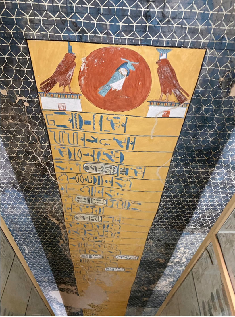
Görsel 1: XIX. Hanedanlık dönemi Firavun Siptah'ın mezar tavanında gök mavisi üzerine altın renginde yıldızlı bezeme (Paola Cartagena Piana, 2022)

Uygulamanın yaygın olarak görüldüğü bir sonraki dönem, geç antik Roma ve Bizans dönemidir. Roma dönemi uygulamaları kalemişinden ziyade mozaikle gerçekleştirilmiştir. M.S. 4. yüzyılda Napoli'de inşa edilen San Giovanni in Fonte Vaftizhanesi'nin kubbesinin iç yüzeyinde yer alan mozaiklerde Hz. İsa'nın monogramı ve etrafında gök mavisi üzerine altın