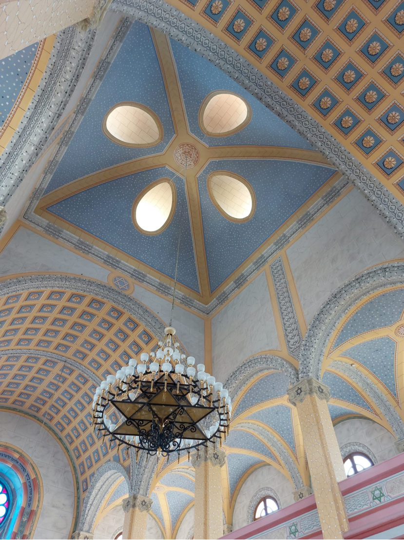
Grsel 13: Edirne Byk Sinagogu’nun tonoz yzeylerinde gk mavisi zerine altın renginde yıldızlı kalemiř bezeme (M. aęhan Keskin, 2022)

yerine 6 Ocak 1906 tarihli fermanla inřaatına izin verilen Edirne Byk Sinagogu Kal Kados ha Godal ismiyle 1907’de aılmıřtır. Fransız mimar France Depre tarafından tasarlanmıř ve inřa edilmiřtir. 30