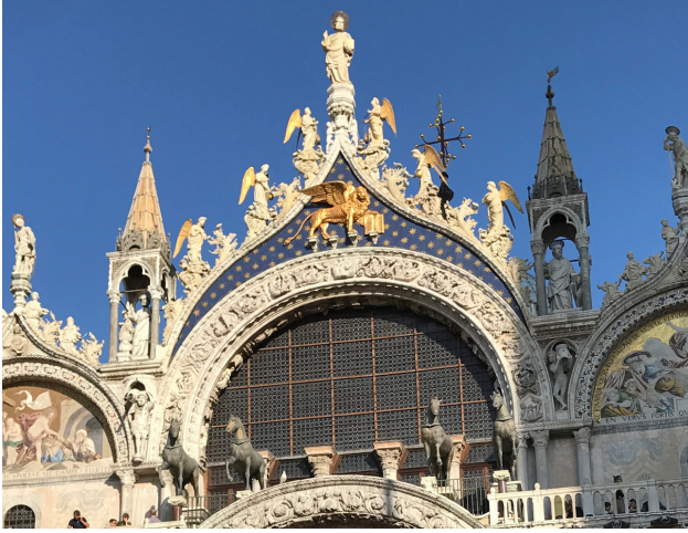
Görsel 3: San Marco Kilisesi giriş cephesinde Konstantinopolis'ten getirtilmiş Quadriga ve gök mavisi üzerine altın renginde bezemeli alınlık

kullanılmıştır. Üst şapelin duvarları Yüksek Gotik Çağ'ın (1150-1250) son döneminde ortaya çıkan rayonnant üslubunda yüksek renkli camlar ve camların arasındaki ince uzun ayaklara oturmış sivri kemerlerle çevrilidir. Yapı bu haliyle havada asılı duran çapraz tonozlu bir tavana sahip cam duvarlı bir strüktür olarak görünmektedir. 14 Tavanın iç mekandaki bu vurgusu, üzerindeki gök mavisi üzerine altın renkli yıldız desenini ön plana çıkarmaktadır.