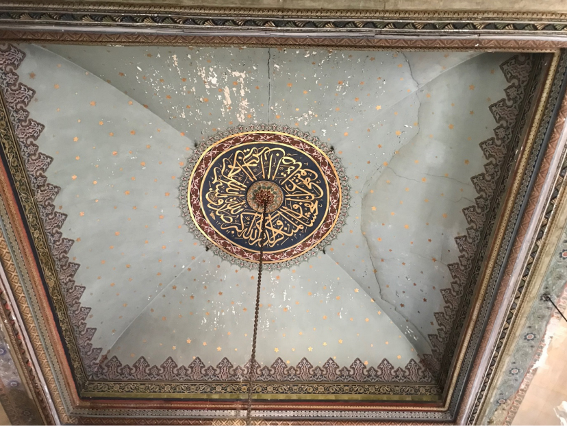
Görsel 12: Yeniköy, Osman Reis Camisi’nin harim bölümünün tavanında gök mavisi üzerine altın renginde yıldızlı kalemişi bezeme (Mustafa Kaan Sağ, 2022)

Yeniköy’de bulunan Osman Reis Camisi, 17. yüzyılda inşa edilmişse de son halini 1903-1904 senelerinde Alexandre Vallaury’nin onarımı ile almıştır. 28 Eski cami, neogotik üslubun ön planda olduğu eklektik bir stilde yeniden tasarlanmıştır. Caminin harim bölümünün tavanında aynı uygulamayla karşılaşılmaktadır ( G.12 ). Uygulamanın görüldüğü bir diğer cami ise Sultan II. Abdülhamid tarafından 1895’te kurulan Darülaceze’ye ait Darülaceze Camisi’dir.