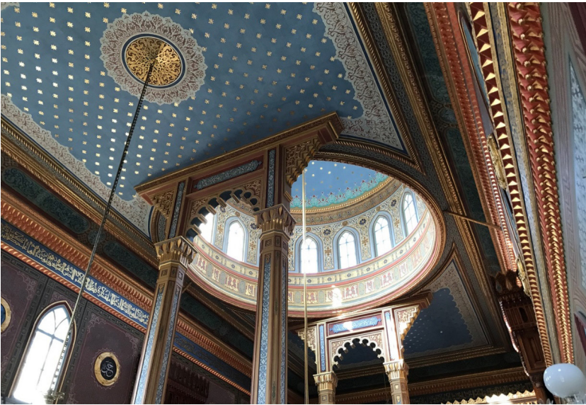
Görsel 11: Yıldız Hamidiye Camii harim tavanında gök mavisi üzerine altın renginde yıldızlı kalemîşi bezeme

Osmanlı başkentinde karşılaşılan bu uygulamanın 19. yüzyıl sonunda camiler ve sinagoglara da yayıldığı anlaşılmaktadır. Ele alınan dekorasyonun günümüze ulaşan İstanbul'daki en görkemli örneği şüphesiz Yıldız Hamidiye Camisi'dir (G.11). Sultan II. Abdülhamid, Cuma selamlık törenleri için Yıldız Sarayı'nı çevreleyen duvarların hemen dışında Koltuk Kapısı olarak adlandırılan girişin önünde 1885-86 senelerinde Yıldız Hamidiye Camisi'ni inşa ettirmiştir. 27 Cami, neogotik, neobizans ve oryantalizm üsluplarını bir arada barındıran eklektik bir tasarıma sahiptir. Hamidiye Camisi'nin harim bölümünün tavanını ve kubbe iç yüzeyini tümüyle kaplayan bezemenin, bu uygulamayı 20. yüzyıl başında İstanbul ve çevresinde daha popüler hale getirdiği görülmektedir.