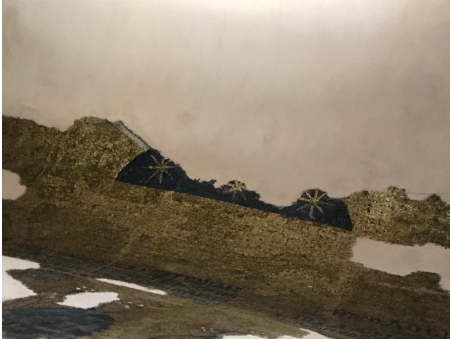
Görsel 4: Sakız Adası, Nea Moni Kilisesi'nin narteks tavanında günümüze kısmen ulaşan mozaikle yapılmış gök mavisi üzerine altın renkli yıldızlar (Mustafa Kaan Sağ, 2023)