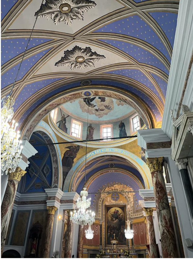
Görsel 8: Moda, Notre Dame de L'assumption Kilisesi'nde tonoz yüzeylerinde ve apsisi örten kubbenin iç yüzeyinde gök mavisi üzerine altın renkli yıldızlı kalemışı bezeme (Mustafa Kaan Sağ, 2023)

tarafından Assomptionistler'e verilmiştir. 1975'ten itibaren ise Süryani-kadim cemaatinin kullanımına açılmıştır. 22 İki adet çan kulesi yer alan giriş cephesi ile iç mekanı barok ve rönesans mimarisine öykünen klasisist bir üslupta tasarlanmıştır. Haç planlı kilisede, ana nefle transeptin kesiştiği bölümde yüksek kasnaklı bir kubbe yer alırken, nef ve transept kollarının üzeri beşik tonozla örtülmüştür. Beşik tonozların iç yüzeyinde kaburgalı çapraz tonoz süslemesi yer alırken kaburgaların arasındaki tüm yüzey apsisle beraber yıldızlı dekorasyon ile bezenmiştir (G.8).