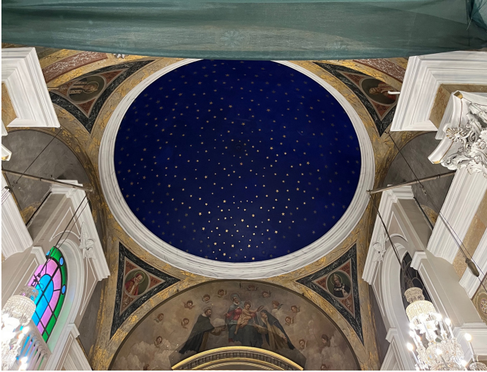
Görsel 7: Galata, Saint Pierre ve Saint Paul Kilisesi’nde koro bölümünü örten kubbenin iç yüzeyinde gök mavisi fon üzerine altın yıldızlı kalemşi bezeme (Mustafa Kan Sağ, 2023)

Osmanlı başkenti İstanbul’da uygulamanın geçmişinin ne kadar eskiye dayandığı bilinmemekle beraber günümüze ulaşan ilk örnekler kiliselerdedir. Tanzimat Dönemi’nde inşa edilmiş yapılardan uygulamanın günümüze ulaşan örneklerinden biri Galata’daki Saint Pierre ve Saint Paul (Peter & Paul) Kilisesi’nin içerisinde yer almaktadır. İlk inşa tarihi 15. yüzyıla dayanan Saint Pierre ve Saint Paul Kilisesi, kardeşi Giuseppe Fossati ile Ayasofya’yı restore eden (1847-49) mimar Gaspare Fossati tarafından 1843’te beşinci ve son kez inşa edilmiştir. 20 Tek nefli bazilikal planlı bir yapı olan kilisenin üst örtüsü, nefte beşik tonoz ve apsis kısmında koro bölümünü örten kubbeden oluşmaktadır. Koro bölümünü örten sekiz metre çapındaki kubbenin iç yüzeyi koyu mavi fon üzerine altın yaldızlı yıldızlarla bezelidir (G.7).