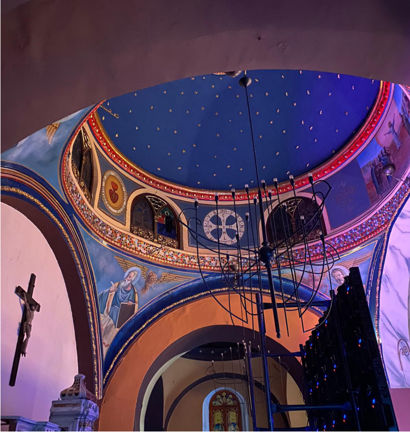
Görsel 9: Karaköy, St. Benoit (Aziz Benedetto) Kilisesi'nin apsis bölümünü örten kubbenin iç yüzeyinde gök mavisi üzerine altın renkli yıldızlı kalemişı bezeme

St. Benoit (Aziz Benedetto) Kilisesi'nin apsis bölümünü örten kubbenin iç yüzeyinde de aynı uygulama görülmektedir (G.9). Günümüzde Karaköy'deki St. Benoit Lisesi bünyesinde bulunan St. Benoit Kilisesi ve manastırının geçmişı 15. yüzyıla dayansa da birçok kez yangına maruz kalan ve tekrar inşa edilen yapı son olarak 1871'de hizmete açılmıştır. 23