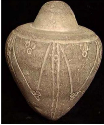
Görsel 2: Horasan’da ele geçmiş olan ve MS10. yüzyıla ait pişmiş toraktan yapılmış el bombası, Hassaan, “Medieval Centuries,”196, fig. 6.

Gerçek ne olursa olsun, İslam dünyasının geliştirmiş olduğu el bombaları özellikle MS 12. ve 13. yüzyıl Haçlı Dönemi’nde kullanışlı silahlar haline gelmiştir 21 . Yine de, elle atılan daha küçük el bombaları meselesi sorunlu olmaya devam etmektedir. İlk zamanlarda bunlara “çömlek” anlamına gelen “qawāir” veya “qudūr” denilmekteydi. Onları kullanan adamlar bazen sadece “nār atıcılar” olarak adlandırılırdı. Ateşe dayanıklı giysiler giymiş ve aralarında alev püskürtücülerle silahlanmış olanları da vardı. Bu arada MS 1142’ de Lizbon’u ele geçiren Haçlıların ellerinde “ateş topları” betimlenmiştir. El bombaları, Haçlıların elinde bulunan Akka’da yapılan çeşitli el yazmalarında ve Akka’nın Memlûk Sultanlığı’nın eline geçmesinden birkaç yıl sonrasına tarihlenmektedir. Bu tasvirlerden birisinde el bombası şeklinde betimlenmiştir (G.3) 22 . Humbaranın kullanımına yönelik günümüzde yapılmış canlandırmalardan birisi de humbaranın ağzına bağlanan iple humbaracının başının etrafından döndürülüp ivme kazanmasını sağlamak ve sonrasında düşman bölgesine kuvvetle atmak şeklindedir (G.4) 23 . Haçlı seferleri ile Avrupa’nın tanıştığı el bombalarının cam örnekleri pişmiş topraktan yapılmış olanlardan sonra ortaya çıkmıştır 24 . Avrupa’da kullanımından kısa bir süre sonra ise Osmanlı cam sanatı,