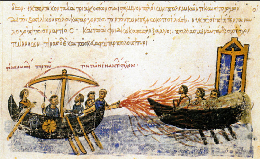
Görsel 1: Bizans donanması İsyancı Slav Thomas’ın donanmasına karşı Yunan Ateşi’ni kullanır şekilde betimlenmiş el yazması.

Halifelik orduları tarafından temelde aynı piroteknik biçimde kullanılmıştır. Erken ve Klasik İslam Dönemleri piroteknik gelişimler ile birlikte insanlık tarihindeki ilk “makine zihniyetli çağ” olarak nitelendirilebilir 18 . Dolayısıyla Müslüman kimyagerlerin, teknisyenlerin Bizanslı çağdaşlarını MS 10. yüzyılda geride bırakmaları şaşırtıcı değildir 19 . Horasan’da ele geçmiş olan ve MS 10. yüzyıla ait pişmiş topraktan yapılmış el bombası küçük bir fitil deliği olan ve fosil yakıt ile patlaması amaçlanan bir silah olarak karşımıza çıkmaktadır. Henüz içerik olarak barut kullanılmadığı dönemlerdir (G.2) 20 .