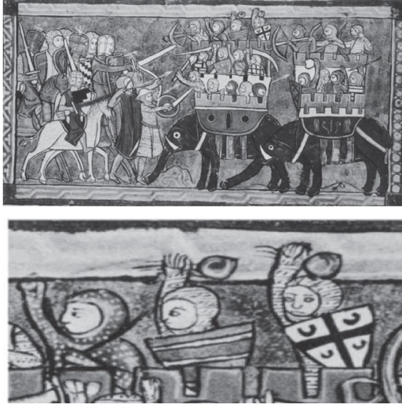
Görsel 3: Büyük İskender ve Hindistan Kralı Porus'un ordularının savaşını gösteren görsel ve altta detayı MS 1287 civarı, Nicolle, "Fire Grenades,": 175, fig.7a-b.

Mustafa Nuri Paşa'ya anlatımlarına göre humbaranın icadı Fatih Sultan Mehmet zamanında olmuş ve 1475 İşkodra Kuşatması'nda kullanılmıştır 36 . Kesin bir tarihi olmamakla birlikte Osmanlı bu etkileyici savaş silahını ordusunun vazgeçilmez bir parçası olarak yüzyıllar boyunca kullanmıştır. Humbaraların savaş meydanlarında tehlikeli bir silah olarak kullanılmasında en önemli neden içeriğidir. Cam humbaraların içeriğinde; ana bileşenleri nafta, sülfür veya yağ, reçine ve yanmamış kireçten oluşan patlama ve duman çıkaran bir karışım bulunmaktaydı. Fital olarak ise kurutulmuş ağaçtan (çam) yanıcı otsu bitkiler (kenevir) hatta kıyı kayalıklarında yetişen çalılar ki son derece hızlı alev alabilen fitiller olarak kullanılmıştır (G.5) 37 .