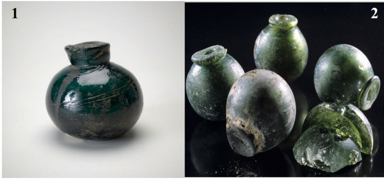
Görsel 10: 1. Royal Collections'da bulunan 10.-12. yüzyıllara ait cam humbara; 2. Städtische Museen Freiburg bulunan 1744-45. yüzyıllara ait cam humbara ( https://www.rct.uk/collection/themes/exhibitions/cairo-to-constantinople-early-photographs-of-the-middle-east/the-queens-gallery-buckingham-palace/jar-hand-grenade ).

Eserin envanter fişinde müzeye geliş şeklinin 1936 yılında İngiliz madam Bekin ile matmazel Calvert tarafından armağan olduğu yazmaktadır. Ayrıca buluntu yeri olarak da Truva gösterilmiştir 45 . Buluntuyu armağan eden Calvert ailesi uzun yıllar Çanakkale'de ikamet eden Maltalı İngiliz uyruklu kişilerdir. Ailede en tanınan kişi hiç kuşkusuz Heinrich Schliemann'a kazacağı yerler konusunda rehberlik yapmış Frank Calvert'tir. F. Calvert, Troas'ta hem kazı yaparak hem de eser toplayarak 1850'lerden 1908'e kadar olan sürede 17'den fazla arkeolojik yerleşimi keşfetmiş ve bu bölgede yaklaşık olarak 30 kazı gerçekleştirmiştir 46 ( G.11 ). F. Calvert, yaşamının son on yılında Amerika'ya yaptığı seyahatlerde kendi koleksiyonu içinden en kaliteli olanları Amerika'ya götürmüştür 47 . F.