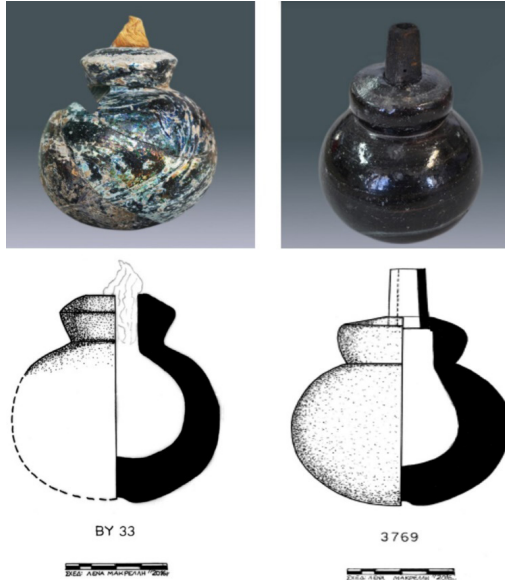
Görsel 5: Archaeological Museum of Mytilene envanterinde bulunan fitilleri ile korunmuş cam humbaralar, Triantafyllidis, "War in Medieval," 299-300. fig.6-9.