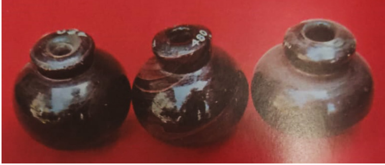
Görsel 9: İstanbul Deniz Müzesi envanterindeki humbaralar, Bayramoğlu, Beykoz-ware , 130.