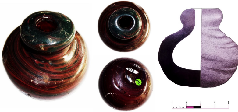
Görsel 6: Çanakkale Müzesi envanterindeki cam humbara (Emre Taştemür, 2015).

Çanakkale Müzesi envanterindeki humbara 1936 yılında armağan edilmiş olup; ağız çapı: 3.8 cm, gövde çapı; 9.6 cm, dip çapı, 2.7 cm ve yüksekliği 9 cm, hacmi 96 mililitredir. Koyu yeşil ve bordo renkli cam hamurundan alınan eriyik haldeki camın serbest üfleme tekniği ve aletle şekillendirilmesi ile oluşturulmuştur. Cidar kalınlığı 1.1 cm ile 1.8 cm arasında değişmektedir. Camın gövde kısmında geniş bir kırık bazı yerlerinde ise ufak kopmalar bulunmaktadır. Dip kısmında noble izi görülmektedir (G.6). Bu humbara envanter fişinde yanlışlıkla hokka olarak tanımlanmış ancak cam hokkaların en önemli özellikleri ve Bizans Dönemi minyatürlerinde de karşımıza çıkan şeffaf oluşudur ki, içeriğinin ne kadar kaldığını göstermesi açısından bu oldukça önemlidir, humbaraların genel çoğunluğu koyu renkli cam hamuruna sahiptir 38 . Ayrıca Çanakkale humbarası dahil olmak üzere oval diplerinden dolayı düz bir zeminde sağlam bir şekilde durmaları zordur. Bu nedenler ve tipolojik analogilerinde de bu formun hokka olarak kullanıldığı tek bir örneğinin olmaması bu tanımlamanın yanlış bir ifade olduğunu göstermektedir.