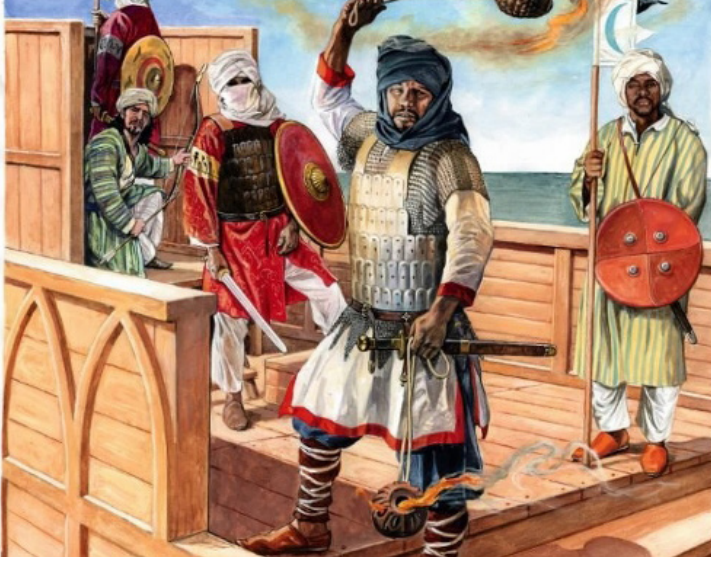
Görsel 4: Humbaranın kullanımına yönelik canlandırma.