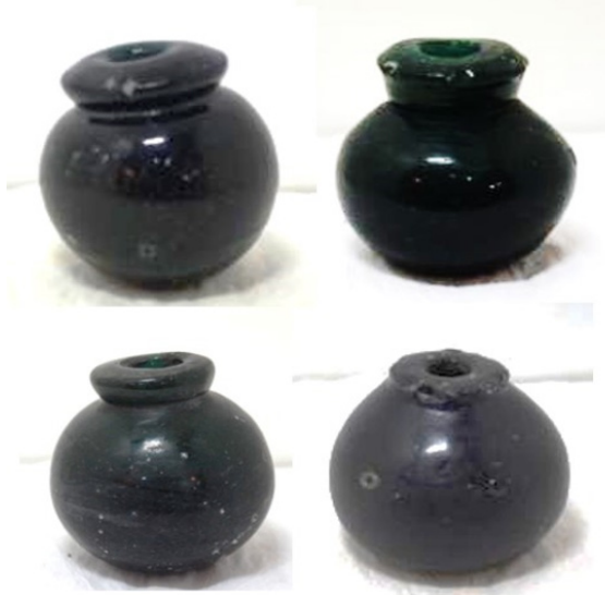
Görsel 8: On iki Ada Eski Eserler Müzesi'nden MS 10.-16. yüzyıllara tarihlendirilen cam humbaralar ( https://www.searchculture.gr/aggregator/edm/mnam/000150-395570 )

forma dahil olmak üzere benzer tipolojinin MS 15. ve 16. yüzyıllarda kullanılmış olduğunu göstermesi açısından önemlidir. Ayrıca Çanakkale humbarası ile benzer tipolojiye sahip olmasa da çeşitli müzelerde ve koleksiyonlarda MS 10.-18. yüzyıllar arasına tarihlenen cam humbaralar bulunmaktadır. MS 10.-12. yüzyıllara tarihlendirilen Royal Collection'dan cam humbara 43 , Städtische Museen Freiburg bulunan ve 2007/2008 yıllarında yapılan kazılarda ortaya çıkarılmış olan 1744/45 yıllarına tarihlendirilen cam humbaralar 44 kullanım alanlarının kronolojik olarak gösterilmesi açısından önemlidir ( G.10 ),