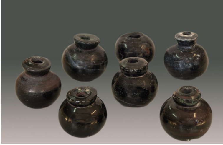
Görsel 7: Midilli Kalesi'nden cam humbaralar, Triantafyllidis, “War in Medieval,” 298, fig. 4.